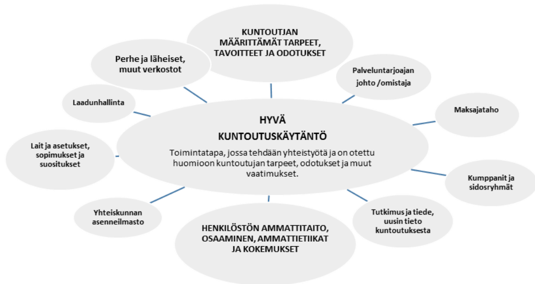
Kuvio 1. Hyvän kuntoutuskäytännön periaatteet

Jotta hyvä kuntoutuskäytäntö toteutuu, tulee kuntoutujalla olla mahdollisuus osallistua omaan kuntoutusprosessiinsa sen eri vaiheissa. Pyrkimyksenä tulee olla kuntoutujan voimavarojen lisääntyminen tietenkin jaksaminen huomioiden. Kuntoutujan sekä eri alojen ammattilaisten ja toimijoiden välisen yhteistyön sujuvuus on erittäin tärkeää kuntoutumisprosessin onnistumisen kannalta. Yhteistyötä kuntoutuspalveluiden maksajatahon kanssa ei myöskään sovi unohtaa, koska palvelujen sisältö ja toteutus riippuu kuitenkin hyvin pitkälti myös taloudellisista realiteeteista. Kuntoutusta voidaan toteuttaa vain taloudellisesti sovittujen voimavarojen puitteissa. Myös maksajat usein edellyttävät, että kuntoutuja itse on mahdollisuuksiensa mukaan osallisena kaikissa kuntoutusprosessin vaiheissa sekä vaikuttaa suunnitelmiin ja päätöksiin, joita hänen kuntoutumisensa edistymiseksi tehdään. (Invalidiliitto 2009. s.6.)