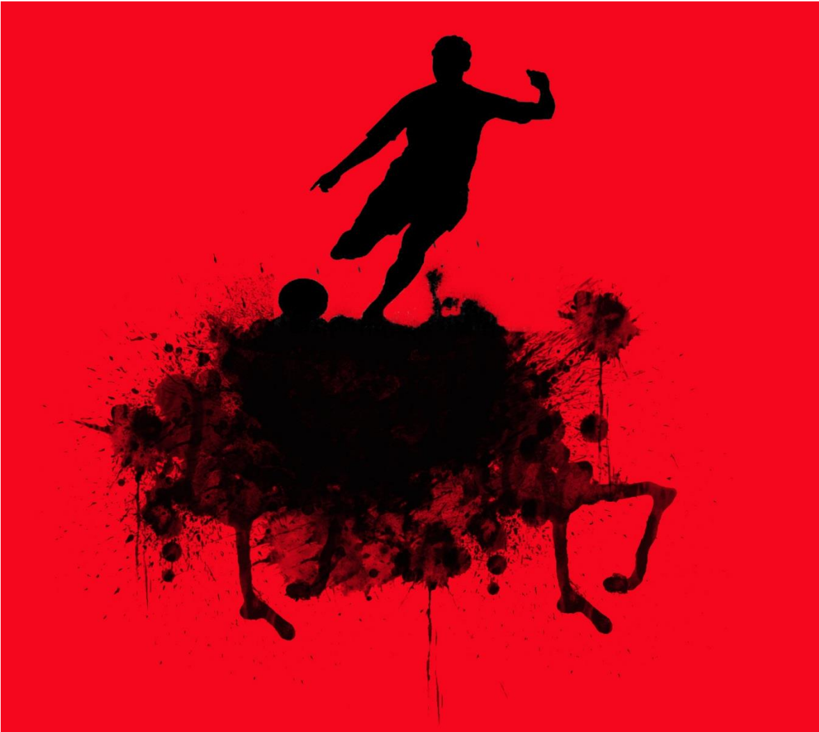
KUVIO 2. Toinen vedos.

Kuvio kaksi on toinen vedos, jossa on käytetty seuran päävärejä (punaista #FF0000 ja mustaa #000000). Logoa ei käytetty vedoksessa, koska se olisi saanut kuvan epätasapainoon ja huomio olisi siirtynyt poissa mainoslehden keskipisteestä. Vedoksessa on suunniteltu käytettävän fonttia Century 30 pt sharp, jonka väri on valkoinen (#FFFFFF), teksti sijoitetaan kuvan keskellä olevaan mustaan alueeseen, joka korostaa valkoista tekstiä. Tekstin sijoitus punaiselle alueelle tapahtuu mustalla typografilla.