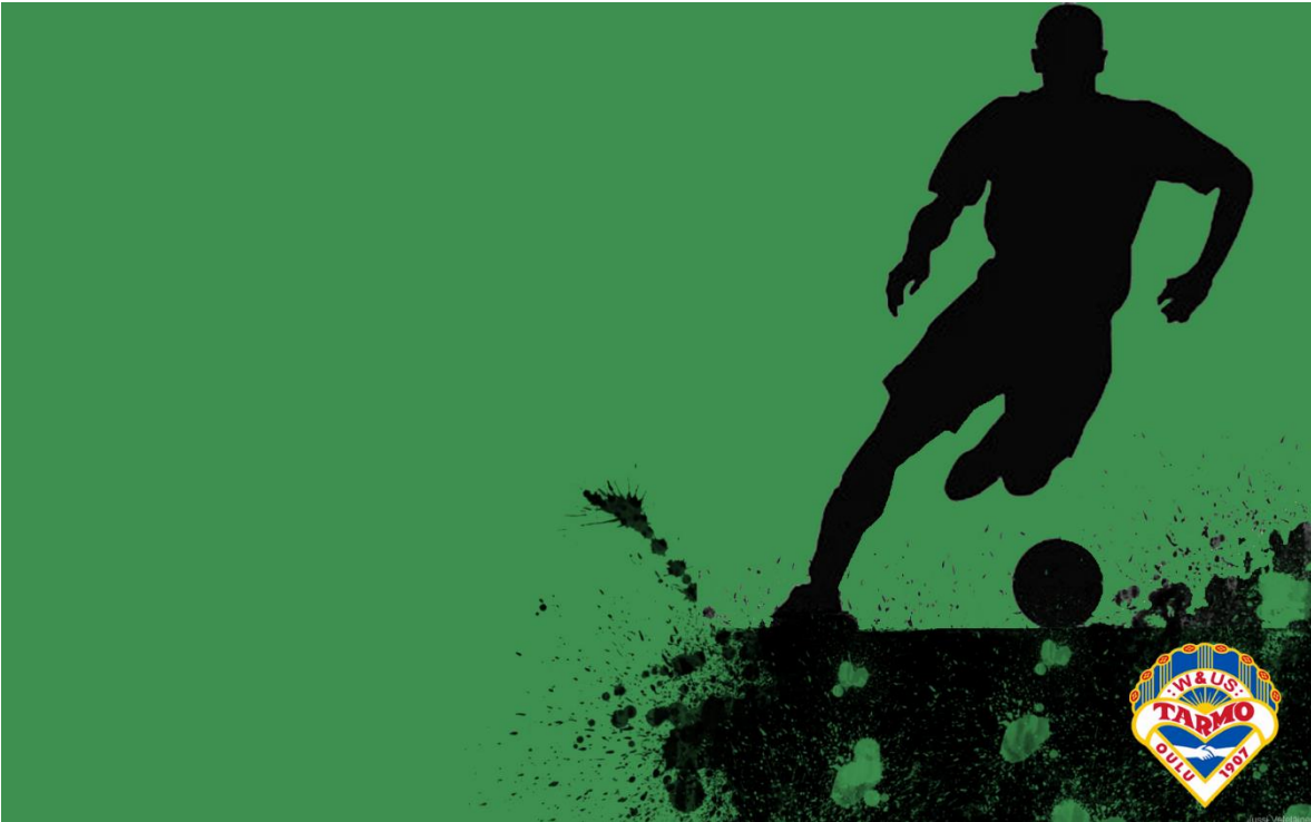
KUVIO 1. Ensimmäinen vedos.

Kuvio yksi on ensimmäinen vedos, jossa on käytetty ennalta sovittuja värejä (vihreää #006400 ja mustaa #000000) ja logoa, jonka väritystä korjasin tarkemmaksi, koska annetussa logossa oli liian haaleat värit verrattuna värikarttaan. Logo on sijoitettu oikeaan alareunaan vahvistamaan vedoksen graafista kuviota. Vedoksessa on suunniteltu käytettävän fonttina Century 30 pt sharp jonka väri on valkoinen (#FFFFFF), teksti sijoitetaan alkamaan vasemmasta yläkulmasta.