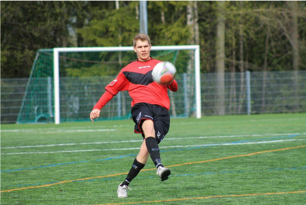
KUVIO 6. Kuva otettu ottelusta 11.6.2015.