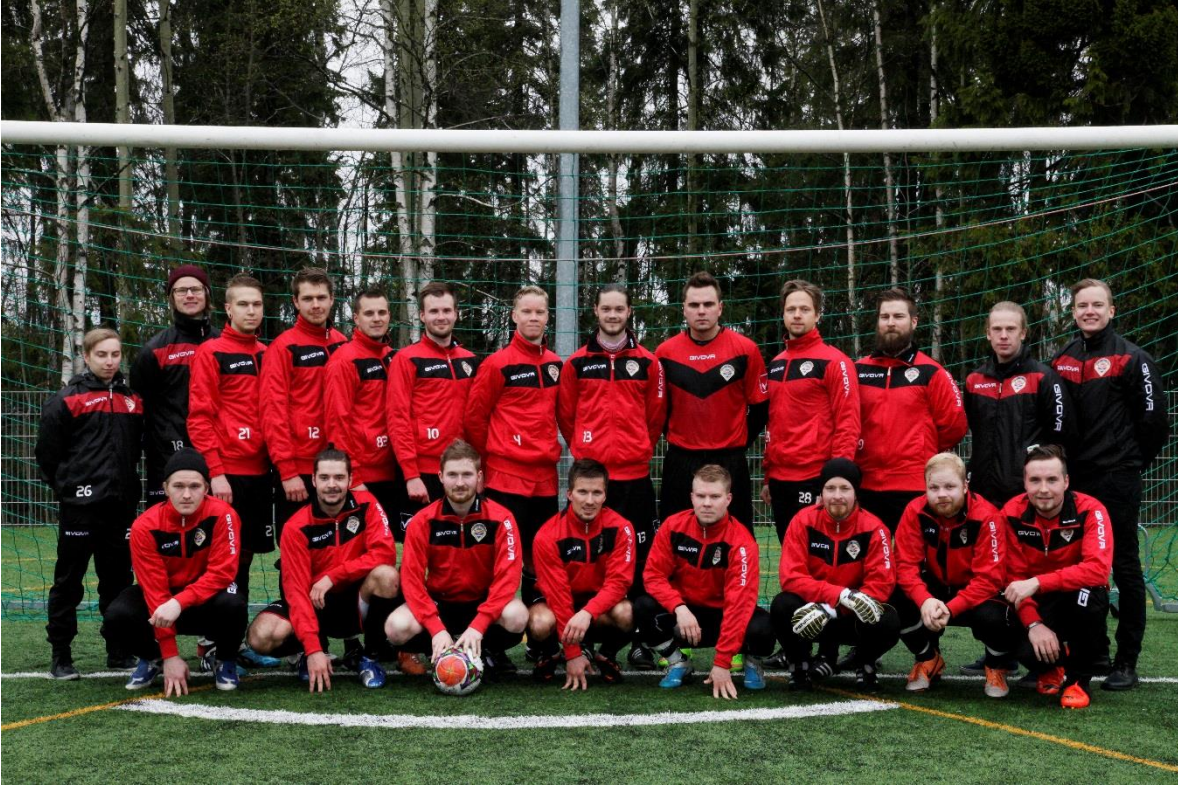
KUVIO 4. Joukkuekuva 2.

Kuvio neljä on otettu Canon EOS 1100D kameralla ja 70-300mm objektiivilla, kuvaa on jälkikäsitelty Photoshop-ohjelmalla, siitä on korostettu joukkueen käyttämien pelipaitojen punaista väriä ja terävyyttä sekä värimaailmaa on pirstetty.