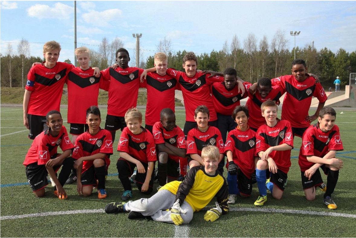
KUVIO 5. Joukkuekuva 3.

Kuvio viisi on otettu Canon EOS 1100D kameralla ja 70-300mm objektiivilla, kuvan terävyyttä, värejä ja pelipaitojen punaisuutta on korostettu Adobe Photoshop-ohjelmalla jälkeenpäin.