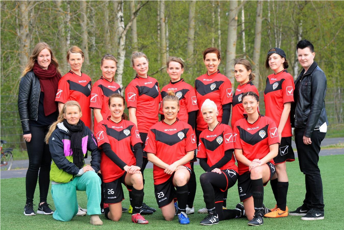
KUVIO 3. Joukkuekuva yksi.

Kuvio kolme on otettu Canon EOS 1100D kameralla ja 70-300mm objektiivilla, kuvaa on jälkikäsitelty Photoshop-ohjelmalla, siitä on muokattu tarkkuutta ja värejä sekä korostettu joukkueen pelipaitojen punaista väriä.