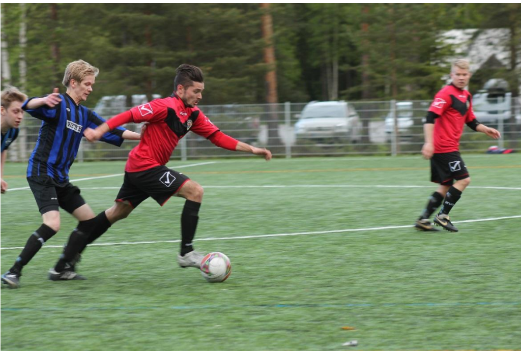
KUVIO 7. Kuva otettu ottelusta 11.6.2015.

Kuvio kuusi ja seitsemän on otettu Oulun Tarmon kesäkuussa pelatusta ottelusta. Esimerkki ottelukuvien muokkaustyylistä, joissa yhteistyösopimuksessa halutut välittyvät asiat piti havaita, kuten urheilullisuus, yhteisöllisyys ja kilpailullisuus.