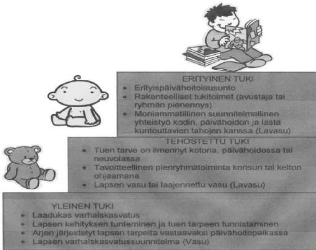
KUVIO 4. Kolmiportainen tuki Akaan kaupungin varhaiskasvatuksessa.

Lapsella voi olla tarve erityiseen tai tehostettuun tukeen päivähoidossa fyysisen, tiedollisen tai taidollisen kehityksen osa-alueella. Tukea tarvitaan myös tunne-elämään ja sosiaalisiin taitoihin, esimerkiksi ryhmässä toimimisen taitojen oppimiseksi. Myös perheessä tapahtuvat muutostilanteet ja perheen voimavarojen heikentyminen ovat syinä tuen tarjoamiselle ja antamiselle. Tuki annetaan lapsen päivähoidon arjessa ja se rakentuu yhteistyölle perheiden, päivähoidon henkilöstön, konsultoivan/kiertävän erityislastentarhanopettajan sekä tarvittaessa muiden yhteistyötahojen kanssa (esim. neuvola, erityissairaanhoido, perhekeskus, sosiaalitoimi). Periaatteena tuelle ovat lapsen kehitystä ja oppimista hidastavien tekijöiden varhainen havaitseminen, lapsen oikeus yksilölliseen hoitoon ja tukeen lapsiryhmässä sekä vanhempien ja päivähoidon henkilöstön tiedon ja osaamisen arvostaminen. Tavoitteena on oppimisympäristön ja toiminnan muuttaminen lapsen myönteistä kehitystä ja hyvää itsetuntoa tukevaksi. Erityistä tukea tarvitseva lapsi saa hoitoa ja kuntoutusta. Tuetaan lapsen omatoimisuutta sekä perheiden ja päivähoidon kasvatustyötä. (Kolmiportainen tuki, 2015.)