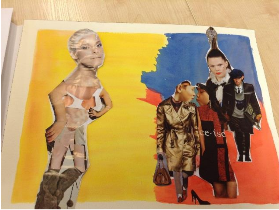
Kuvio 2. Kahden asiakkaan yhteinen kollaasityö.