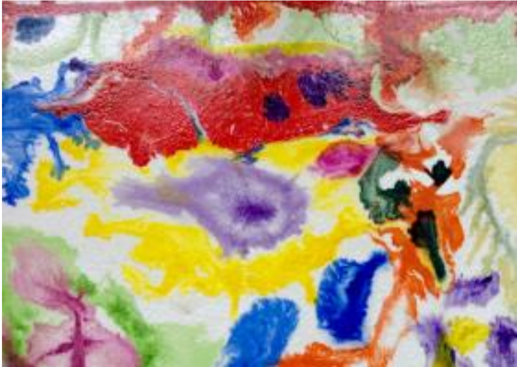
Kuvio 4. Sokerivesimaalaus peiteväreillä ja vesiväreillä.

Osallistuja tuntui nauttivan maalaamisesta ja vaikutti positiivisesti yllättyneeltä maalauksistaan, ja sanoi töitään kauniiksi. Hän myös kysyi mistä voi hankkia materiaaleja, että voisi jatkaa työskentelyä kotona.