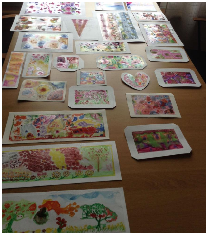
Kuvio 6. Kolmen ryhmäkerran sokerivesimaalukset.