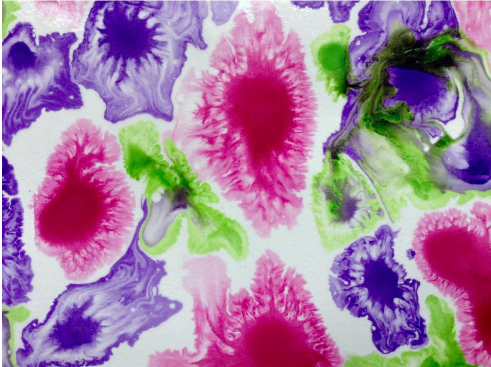
Kuvio 5. Sokerivesimaalaus musteilla.