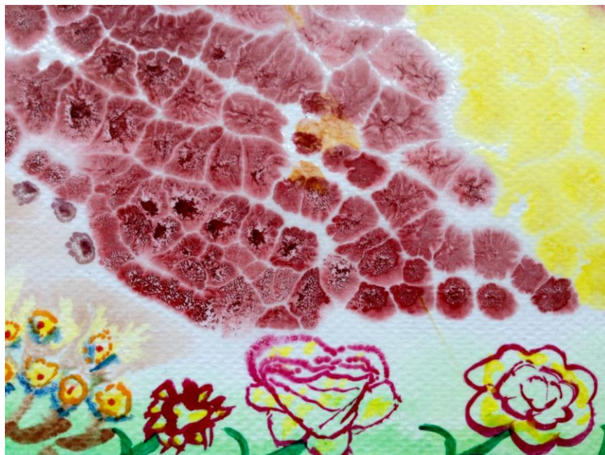
Kuvio 8. Sokerivesimaalaus akvarelliväreillä ja musteilla.

Kuvataiteellinen ryhmätoiminta toimintaterapeuttisesti toteutettuna on käyttökelpoinen menetelmä matalan kynnyksen työmuotona. Toimintaterapia pystyy tarjoamaan teoriapohjan ja keskitettyä osaamista koskien ihmisen toiminnallisuutta ja elämänhallintaa arjessa siinä ympäristössä, jossa asiakas elää, sekä tukemaan stigmatoidun ihmisryhmän toiminnallisen oikeudenmukaisuuden toteutumista myös yhteiskunnallisesti.