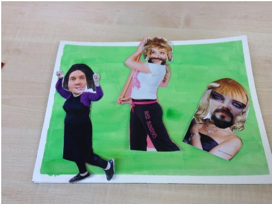
Kuvio 3. Kollaasi.