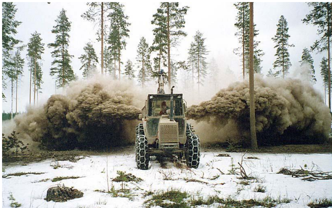
Kuva 3. Pölytuhkan levittämistä puhallinlevittimellä (Korpilahti 2004, 7)

Pölytuhkaa on levitetty maataloustraktorikäyttöisellä puhallinlevittimellä. Puhallinlevitin on tehty metsäperävaunun alustaan. Levitin soveltuu tuhkan levittämiseen kangasmaille ja jäätyneille turvemaille. (Korpilahti 2004, 13.) Pölytuhkan levittämistä Maa- ja metsätalousministeriön asetuksen lannoitevalmisteista 24/11 nojalla ei saisi levittää sellaisenaan vaan se olisi käsiteltävä ennen levitystä tuhkan pölyämisen minimoimiseksi.