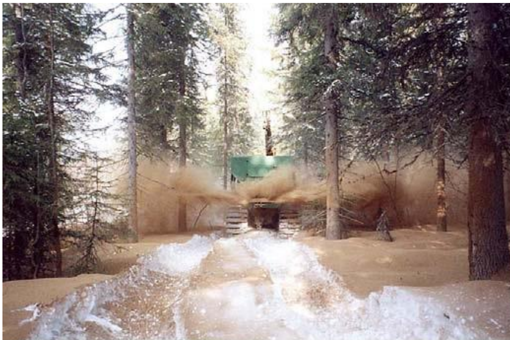
Kuva 4. Itsekovetetun tuhkan levittämistä (Korpilahti 2004, 8)

vitintä. Tuhkasiilon koko on 4 - 10 m 3 . Levityskapasiteetti on 5 - 10 tonnia tunnissa. (Rakeistetun tuhkan maalevyys, Rinne 2007, 4.; Korpilahti 2004.) Helppoissa maastoissa tuhkaa voidaan levittää käyttämällä maataloustraktorin vetämää kalkinlevitysvaunua (Rinne 2007, 4).