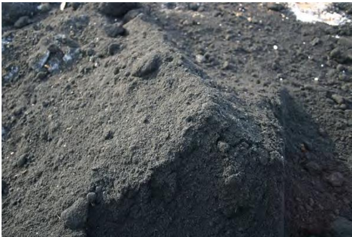
Kuva 1. Itsekovetettua tuhkaa (Makkonen 2008, 9.)