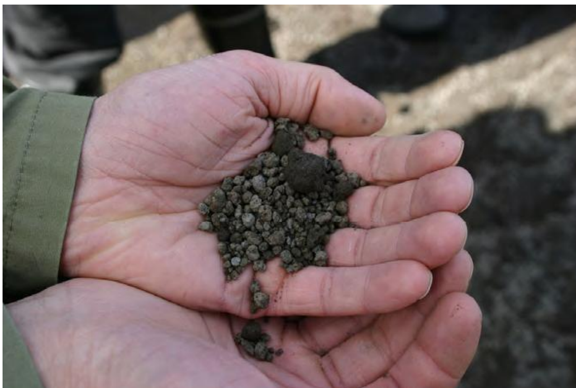
Kuva 2. Rakeistettua tuhkaa (Makkonen 2008, 7)

Tuhkan rakeistamista suoritetaan Suomessa teollisessa mittakaavassa ja kiinteitä rakeistamoja ovat: Enocell Oy:n sellutehtaan yhteydessä Uimaharjussa ja FA Forest Oy:llä Liperissä ja Viitasaarella. (Rinne 2007, 3).