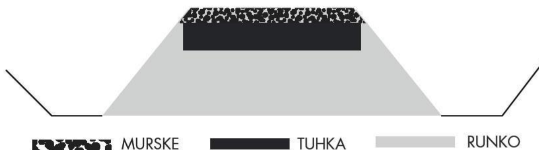
Kuva 5. UPM:n käyttämän tuhkamursketien kaaviokuva (Kuva: Mäki 2013, 30–31.)

UPM on hyödyntänyt polttolaitoksista syntynyttä tuhkaa metsäteiden valmistusmateriaalina. UPM:n käyttämässä menetelmässä metsätien runkoon tehdään 20 – 25 cm paksuinen tuhkatatja, jonka päälle levitetään 10 cm paksuinen murskekerros. UPM:n metsänhoitopäällikön Jyri Schildtin mukaan kokemukset tuhkan käytöstä metsäteissä ovat olleet hyviä. Metsäteiden kelirikkokesävyys ja kantavuus ovat parantuneet tuhkan käytön ansiosta. Tuhkamurskerakenteella tehtyjen teiden tienrunko on säilyttänyt ryhtinsä pitkään ja metsäteiden kunnossapidon tarve on vähentynyt. Hyvänä käytännön esimerkkinä UPM:n tuhkamurskerakenteella kunnostamasta metsätiestä on Jämsässä Kaipolan lähellä oleva metsätie. Metsätien kantavuus on parantunut, ja tien pinta on kestänyt hyvänä kunnostuksen jälkeen. (Mäki 2013, 30–31.)