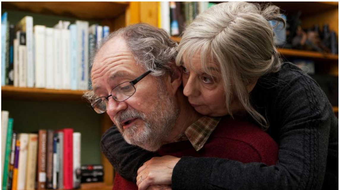
Kuvio 6. Jim Broadbent ja Ruth Sheen Mike Leigh'n elokuvassa Vuosi elämästä (Yhdysvallat 2010)