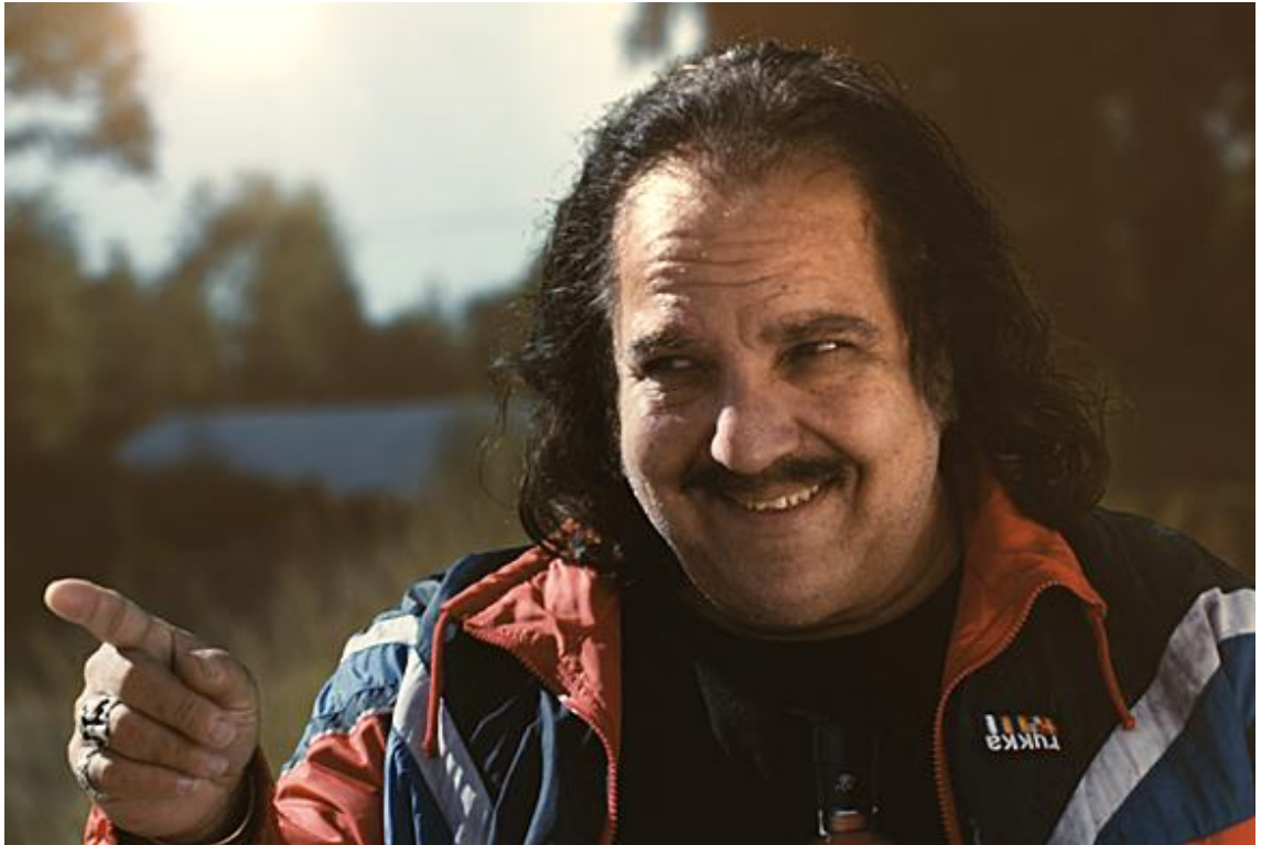
Kuvio 10. Pornotähtenä paremmin tunnettu Ron Jeremy päähenkilön fantasiassa Anselmi nuori ihmissusi –elokuvassa