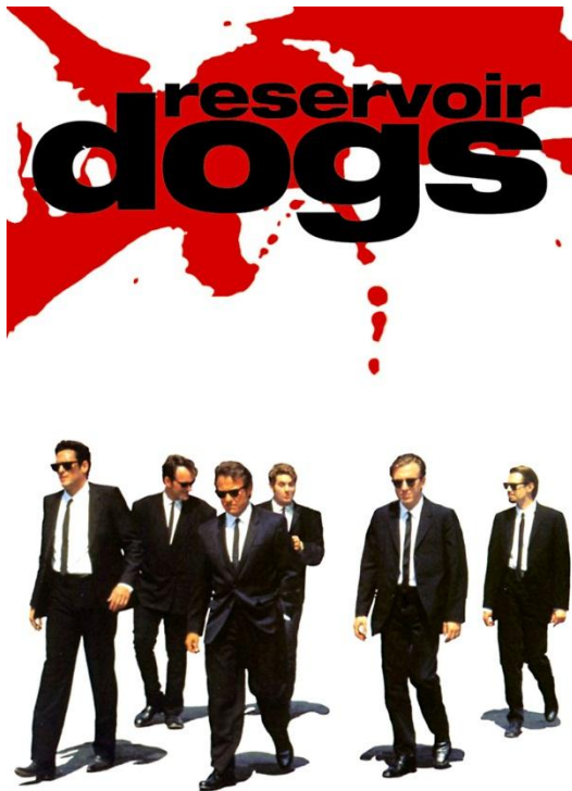
Kuvio 1. Quentin Tarantinon ohjaaman ja käsikirjoittaman Reservoir Dogs -elokuvan juliste

Erityisesti Yhdysvalloissa suuret elokuvastudiot, joista käytetään nimitystä studio system , eivät ole pelkkiä tuotantoyhtiöitä, vaan kyseisen ”systeemin” alla hoidetaan niin levitys kuin kaikki muukin. Esimerkiksi studiojätti Paramount Pictures koostuu lähes kymmenestä erillisestä osastosta: digitaalisen sisällöntuotannon osasto, kotiviihdeosasto, kansainvälisen levityksen ja markkinoinnin osasto, lisensointi ja oheistuoteosasto, studio-osasto, johon kuuluu studioiden lisäksi muun muassa jälkituotantoyksiköitä, televisiolevitysosasto, tv-elokuvaosasto sekä teemapuisto ja lomakohdeosasto (Paramount Pictures 2015).