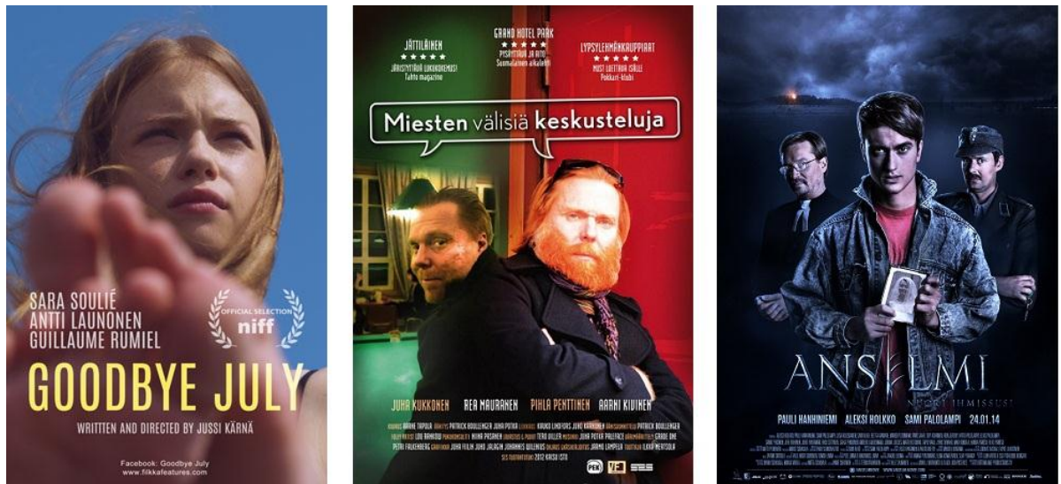
Kuvio 9. Goodbye July-, Miesten välisiä keskusteluja-, sekä Anselmi nuori ihmissusi -elokuvajulisteet