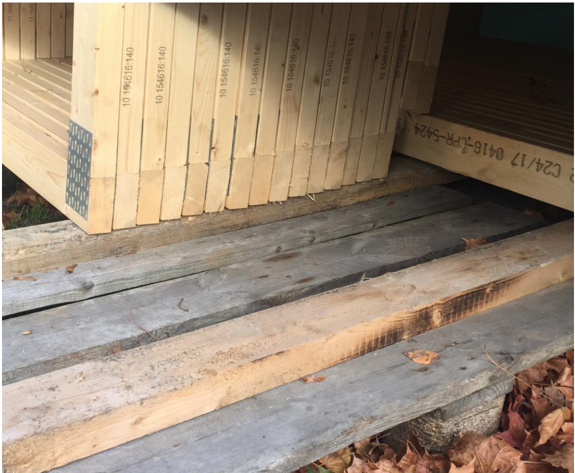
Kuva 3. Materiaalin varastointi

Vaikka työmaalla tapahtuvaa materiaalin varastointia pyritään välttämään tai ainakin minimoimaan varastointi aikaa, varastoitavaa tulee kuitenkin. Kuvissa kolme ja neljä on esitetty hyvät varastointitavat. Materiaalit ovat suojattu, suojat kiinnitetty luotettavasti ja puutavara on nostettu maasta lavojen päälle.