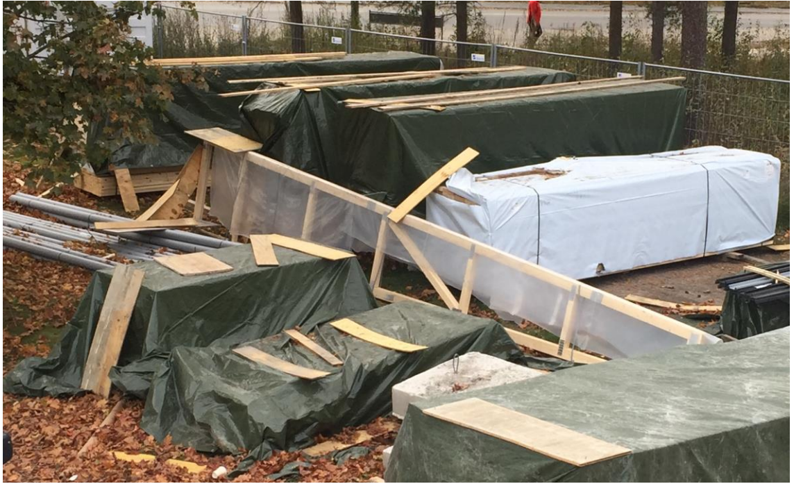
Kuva 5. Materiaalien varastointi