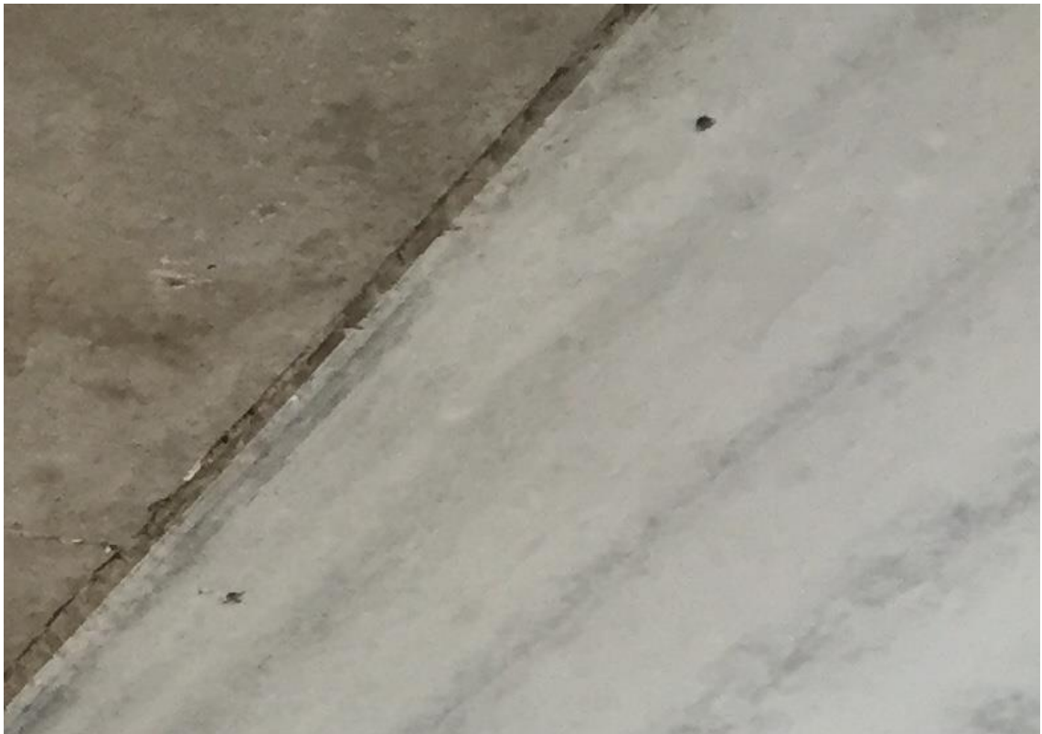
Kuva 1. Ontelolaattojen vesireiät paikallavalukaistojen vieressä.

Ontelolaattojen vesireiät tehdään poraamalla alapuolelta. Onteloissa on jo päissä yhdet reiät. Työmaalla kuitenkin varmistetaan niiden toimivuus ja joudutaan tekemään uusia reikiä. Työntekijälle on kerrottu tarkasti mihin reiät tulee porata, ja miksi ne tehdään jotta hän ymmärtää asian tärkeyden. Työnjohdon tulee kuitenkin kiertää kaikki paikat läpi ja tarkistaa reikien riittävyys. Kuvassa yksi on paikallavalukaistan ja ontelolaatan reuna, jossa on tiheämmin porattu vesireikiä.