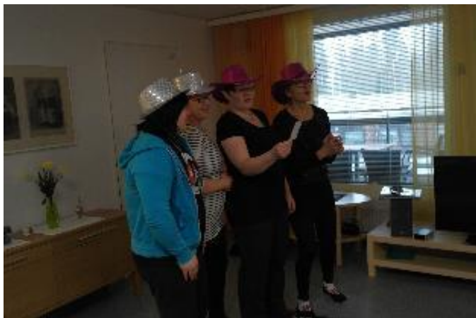
Kuva 13. Esitysryhmä laulaa laulua Kodin kynttilät

Esityksestä valmistettiin DVD-tallenne ja sitä katseltiin kodilla lainakoneen kautta. Kodin DVD-soitin ei toistanut ääntä riittävän hyvin, joten katselu jäi muutamaan kertaan. Katselijat olivat iloisen yllättyneitä, jopa ylpeitä siitä, että esiintyivät televisiossa ja kuulivat sieltä omia sekä toisten tarinoita.