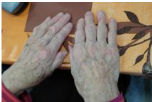
Kuva 5. Iän taidetta

Polku jatkuu, edellisellä kerralla omista käsistä otetut valokuvat oli tulostettu hoivakodin tulostimella. Aluksi kuvista tunnistettiin omia käsiä, se osoittautui käsien omistajille helpoksi tehtäväksi. Valokuvia käsistä katseltiin ja muisteltiin samalla, mitä on käsillä tehty ja mitä vielä voi tehdä. Ensimmäinen kuva näyttää tarinaa työtä tehneistä, iän muovaamista käsistä (Kuva 5). Toisessa kuvassa ovat äidin ja tyttären läheiset kädet (Kuva 6).