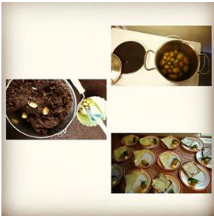
Kuva 10. Perunoiden matka nostosta lautaselle

maistella oman työnsä tuloksia. Seuraava kuvakollaasi alkaa perunoiden nostosta, jatkuu valmistuksella ja lopuksi ovat syötäväksi valmistettuina asetettu tarjolle, voin, tillin ja voileivän kera (Kuva 10).