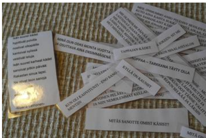
Kuva 12. Valmiita tarinalappuja

Esityspäivän varmistuttua, laitettiin mainokset tapahtumasta kodin seinälle. (liite 2). Kaikille kodissa vieraille läheisille mainostettiin esitystä. Sähköpostitse kutsuttiin myös kaksi kaupungin asumispalvelukoordinaattoria, he eivät kutsuun vastanneet, eivätkä paikalle saapuneet. Freelancer-toimittaja kutsuttiin kuvaamaan esitystä, ja samalla tekemään pientä juttua paikallislehteen, hän oli lupautunut toisaalle.