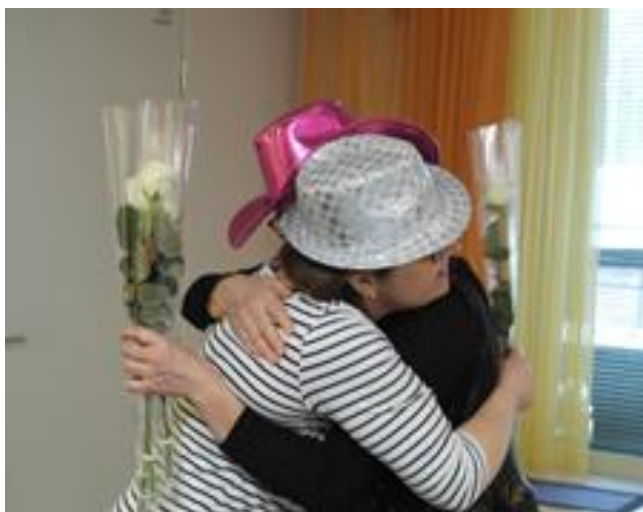
Kuva 14. Heittäytyjät ovat ruusunsa ansainneet

Esityksestä tehtiin myös valokuvakirja, johon tarinoita kirjoitettiin. Valokuva-kirja oli hyvä toiston väline, on helposti saatavilla, katsottavissa ja luettavissa. Voi sanoa, että koti on ylpeä tekemisistään, joita on hyvä muistella valokuva-kirjan avulla, palauttaen tapahtunutta ja tarinoita aina uudelleen mieleen. Parasta yhteishengen ja tuttuuden toteutumista tuo se, että on voinut itse olla mukana, osallisena yhteisessä projektissa. Kiitoshalaukset halattiin esiintyjien kesken sovelletun tarinateatteriesityksen jälkeen. (Kuva14.)