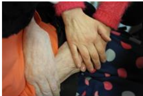
Kuva 6. Läheiset kädet

Valokuvia omista käsistä katsellessa mieleen nousi töihin, harrastuksiin, soitaan ja opiskeluun liittyviä asioita, joista seuraavassa muutamain esimerkein kerrotaan.