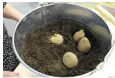
Kuva 9. Perunoiden istutus

Itämisen jälkeen perunat istutettiin sinkkiämpäriin. Parvekkeelle viennin jälkeen asukkaat ilmaisivat huolensa, josko siellä on vielä liian kylmää. Perunämpäri tuotiin keittiöön, ja joka-aamuinen rutiini oli käydä katsomassa, ovatko jo taimelle nousseet. Ilo oli suuri ensimmäisten taimien tultua esiin. Niiden kasvua seurattiin ja päivittäin. Tuli lämmintä ja perunat siirrettiin parvekkeelle, jossa seuraaminen jatkui. Perunat kasvoivat hyvin sinkkiämpärissä, parvekkeen lämmössä.