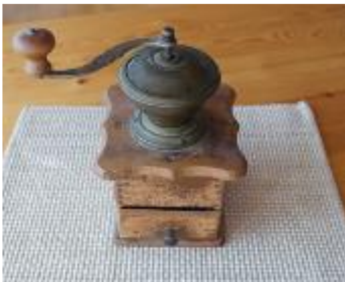
Kuva 4. kahvimylly

Polun varrelle osui sauna, joka lämmitettiin mielikuvilla. Osallistujia oli 12 asukasta sekä yksi läheinen, työvuorossa olevat hoitajat näyttivät seuraavan kiinnostuneina. Aistikokemuksiin oli haettu ennen mielikuvasaunamatkan aloitusta ämpärillinen lunta hoivakodin pihalta. Saunavasta tuotiin kotipakkasesta. Tervashampoo, kahvinmurut sekä kahvimylly tuotiin samoin mukana. Mikrossa lämmitettävä vehnälämpötyyny löytyi hoivakodilta. Seuraavassa kuvassa on kahvimylly, laatikossaan kahvipuruja, tuomaan kahvin tuoksua ja hajuaistille aktivointia. (Kuva 4.)