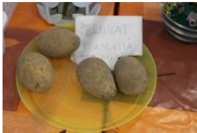
Kuva 8. Perunat itämässä

Parvekeprojekti aloitettiin neljällä perunalla. Perunat laitettiin keittiön isolle ruokapöydälle, lautaselle itämään. Laitettiin muistiin itämisen aloitusajankohta paperille. Saatiin veikkailla, kuinka kauan itämisessä menee aikaa, sekä pohdittua, milloin idut ovat riittävän suuria istutusta ajatellen. Perunoiden itämisen seuraaminen kahden viikon aikana kirvoitti puhetta elämän aikana tehdyistä viljelytöistä. Ihmetystä ja epäilystä tuotti ajatus perunoiden istuttamisesta sinkkiämpäriin. Seuraavissa kuvissa alkaa perunoiden matka. Perunat ovat ruokapöydällä, itämistä odottamassa (Kuva 8) sekä itäneitä perunoita istutetaan sinkkiämpäriin (Kuva 9).