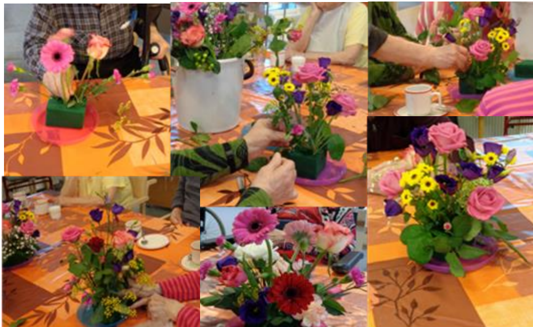
Kuva 7. Kukka-asetelmien tekoa sekä valmiita asetelmia

kaista ollessa muistisairaita, kauniit asetelmat saivat silti olla pöydillä koskematta, silmänilona. Kuvakollaasissa valmistetaan kukka-asetelmia kahvittelun lomassa sekä katsotaan työn tuloksia. (Kuva 7.)