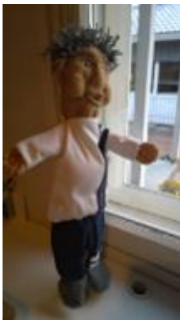
Kuva 2. Käsinukke on valmistunut tutustumiskäynnin oppien pohjalta

Esitystä, eli tarinoiden palauttamista miettiessä epäusko toteutumisesta oli mielessä monta kertaa. Ensimmäinen vaihtoehto, nukketeatteriesitys, poiki tilaisuuden tutustua nukketaiteilijaan, nukketeatteriin, sekä saada taitelija esiintymään hoivakotiin. Nukketaiteilijan esiintymisen ehtona oli teettää opinnäytetyön tekijällä käsinukke, tavoitteena päästä paremmin sisälle nukketeatteri maailmaan. Nukesta tuli liikunnallinen ja alkuperäisenä sen tehtävänä oli osallistua hoivakodin jumppahetkiin ohjaajana. Tehtävä tuli täytettyä ja liikunnan-ohjaaja on valmis (Kuva 2).