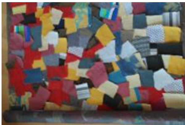
Kuva 3. mielialatilkutyö