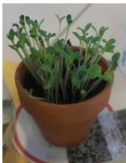
Kuva 11. Lavendeli vahvassa kasvussa

Kukkien siemenet istutettiin samoin sinkkiämpäreihin, kuten myös herneet. Siementen kylvöhaluisia ja -taitoisia asukkaita löytyi helpolla. Samoin kuin perunoiden kanssa, asukkaat seurasivat mielellään kasvien itämistä ja kehitystä. Yrttikasvustoja sai kosketella ja tuoksutella, alla kuva hyvin kasvunsa aloittaneesta lavendelistä (Kuva11).