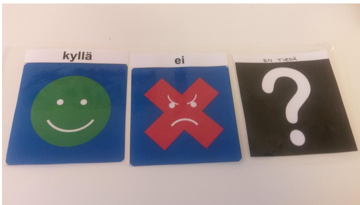
Kuva 1. Kyselyyn vastaamiseen tehdyt kuvakommunikaatiokortit.