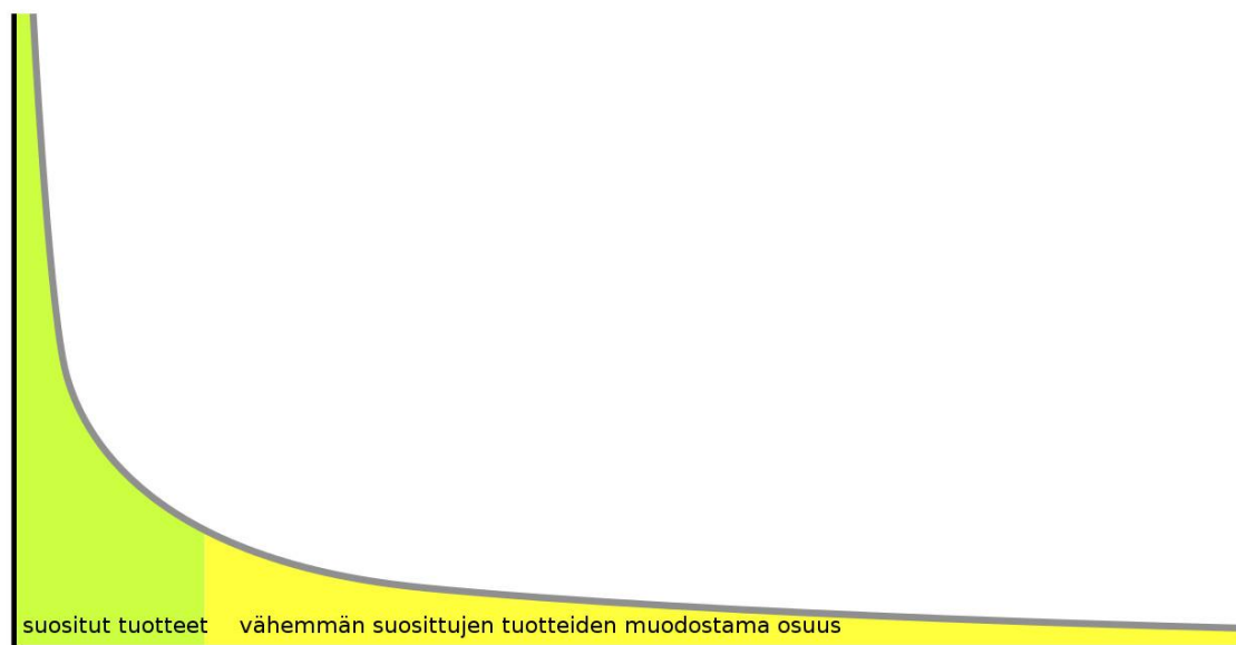
Kuva 12 Long tail-käsite