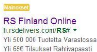
Kuva 2 Esimerkki RS Finlandin hakusanamainoksesta

merkkiä laaja. (Lahtinen 2013, 201-202; Charlesworth 2009, 233.) Frost (2015) huomauttaa että tähän yhteensä 70 merkkiin on syytä pyrkiä tiivistämään yrityksen kilpailutekijä, esimerkiksi nopea toimitusaika, mainostettavan tuotteen tai palvelun hyödyt asiakkaalle, sekä ostokehoitus (Frost 2015). Tämän mainoksen leipätekstin tulisi sisältää samoja sanoja ja ilmauksia kuin sivun sisällössä, sekä täsmälliset nimet kuville ja sivuston videoille, sillä se edesauttaa mainoksen suosion mittaamisessa ja osuuvuudessa suhteessa tehtävään hakukonehakuun. Leipätekstin mainostekstin merkitys korostuu myös asiakkaiden silmissä sitä enemmän, mitä paremman sijoituksen mainos listauksessa saa. (Hunt & Moran 2015, 76.) Google on nimennyt mainoksen eri osiot nimin title eli otsikko, description eli kuvaus ja display URL eli näytettävä URL. Nämä mainoksen luonnin yhteydessä esillä olevat kuvaavat otsikot helpottavat hahmottamaan sitä, miten mainos jäsentyy hakukoneeseen. Kuva 1 osoittaa kuinka ne ovat olleet hyödyksi mainoksen teossa ja helpottavat mainoksen kokonaisuuden hahmottamista, sisällön suunnittelua, sekä mainoksen tekoa.