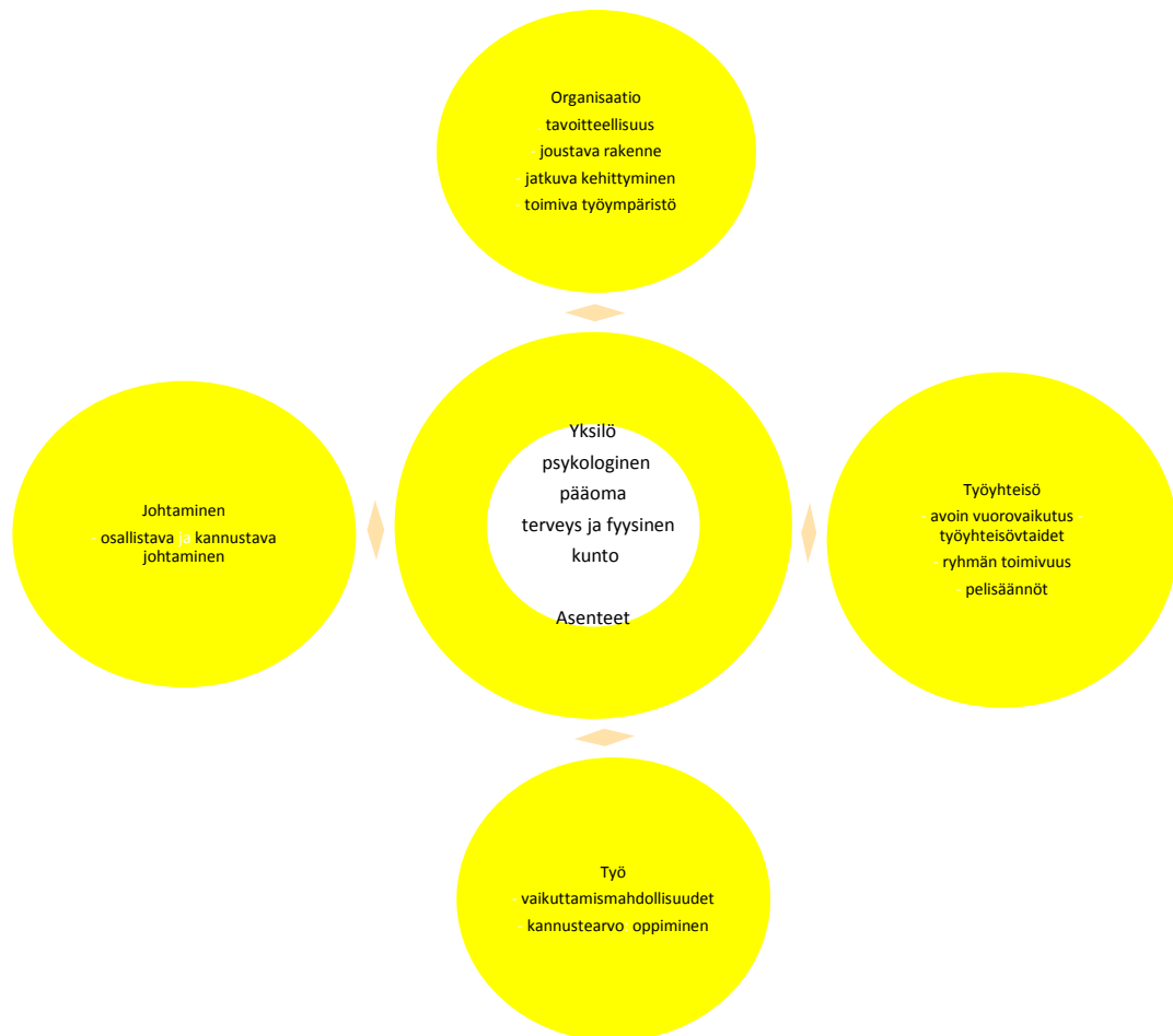
Kuvio 1. Työniloon vaikuttavat tekijät (Manka 2010)

Työn iloa kokeakseen on keskityttävä positiivisiin asioihin ja ratkaisuihin silloin, kun arki on haasteellista. Ratkaisukeskeisyydessä on samaa ajatusta, kuin positiivisessa psykologiassa. Keskitytään voimavaroihin ja vahvuuksiin. Menneisyys nähdään voimavarana. Asiakkaalla on oikeus asettaa omat tavoitteensa ja työntekijä auttaa pääsemään niitä kohti. Myönteinen palaute, kiitos ja kannustus ovat ratkaisukeskeisyyden ydintä. Yhteistyö, luova toiminta ja huumori auttavat etsimään kussakin tilanteessa sopivan tavan toimia. Ratkaisukeskeisyydessä toimintatapoja voidaan etsiä luovasti eri toimintamuodoista. Terapiana ratkaisukeskeisyys on yleistynyt yhteistyön, voimavarojen, kannustuksen ja toiveikkouden korostajana. (Ratkaisukeskeisyys pähkinänkuoressa.)