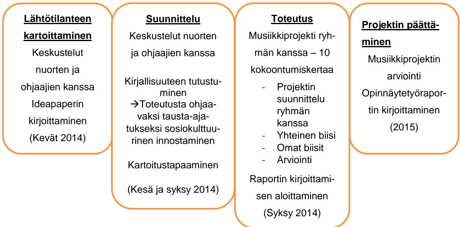
Kuvio 1. Opinnäytetyön kokonaisprosessi

Opinnäytetyössäni etenin soveltaen sosiokulttuurisen innostamisen perusideoita ja projektityön prosessimallia (Kettunen 2009). Projekti alkaa ideasta tai tarpeesta, jonka jälkeen idean toteuttamiskelpoisuutta arvioidaan määrittelyvaiheessa. Suunnitteluvaiheessa laaditaan suunnitelma ja tarkennetaan tavoitteita. Toteutusvaiheessa toteutetaan suunniteltu ja päätösvaiheessa laaditaan loppuraportti projektista pohdintoineen. Yksinkertaistin mallia yhdistämällä määrittely ja suunnitteluvaiheen. Tarpeen tunnistamisesta käytän nimitystä lähtötilanteen kartoittaminen. (Kettunen 2009, 43–54.)