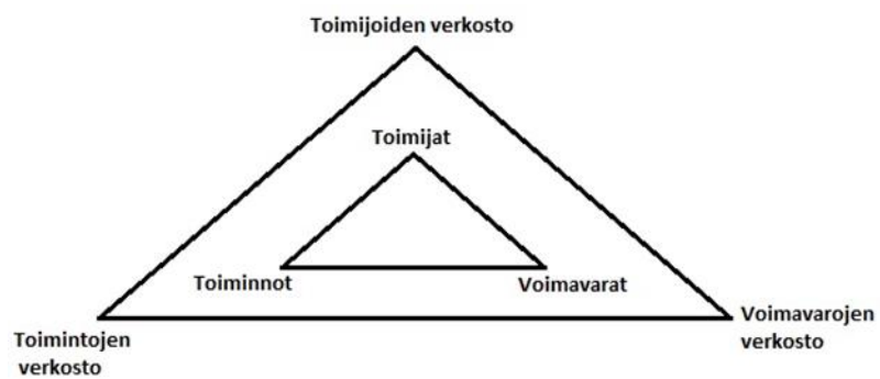
KUVIO 2. Yritysverkostojen perusrakenne Häkanssonin ja Johanssonin mukaan (Haapakoski 2013, 43.)