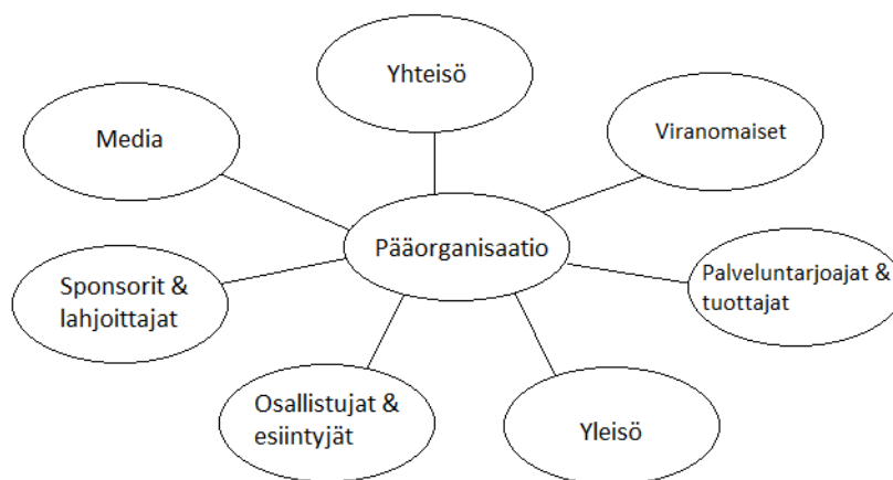
KUVIO 3. Tapahtuman sidosryhmät (van der Wagen & White 2011, 24-25.)

WHO Healthy Cities -konferenssissa työskentelimme useiden Kuopion alueen yritysten kanssa. Sidosryhmät olivat tärkeässä osassa tapahtuman onnistumisen kannalta ja tukivat työskentelyä koko projektin ajan. Konferenssin järjestäjätahona toimi Kuopion kaupunki, mutta kaikki päätökset kulkivat WHO:n kautta heidän protokollansa mukaisesti. Tapahtuman toimijoiden verkostolla oli useita rooleja, esimerkiksi Kuopion yliopistollinen sairaala oli konferenssissa niin palveluntarjoaja kuin osallistujakin. Työssä tarkasteltavat sidosryhmät valitsimme yhdessä toimeksiantajan kanssa. Valinnat tehtiin sen perusteella, mikä yrityksen rooli oli konferenssin aikana. Valitsimme sidosryhmät ottaen huomioon potentiaalisen yhteistyön mahdollisuuden myös tulevaisuuden konferensseissa. Merkittävimmät sidosryhmät ja heidän toimenkuvansa on kuvattu alla.