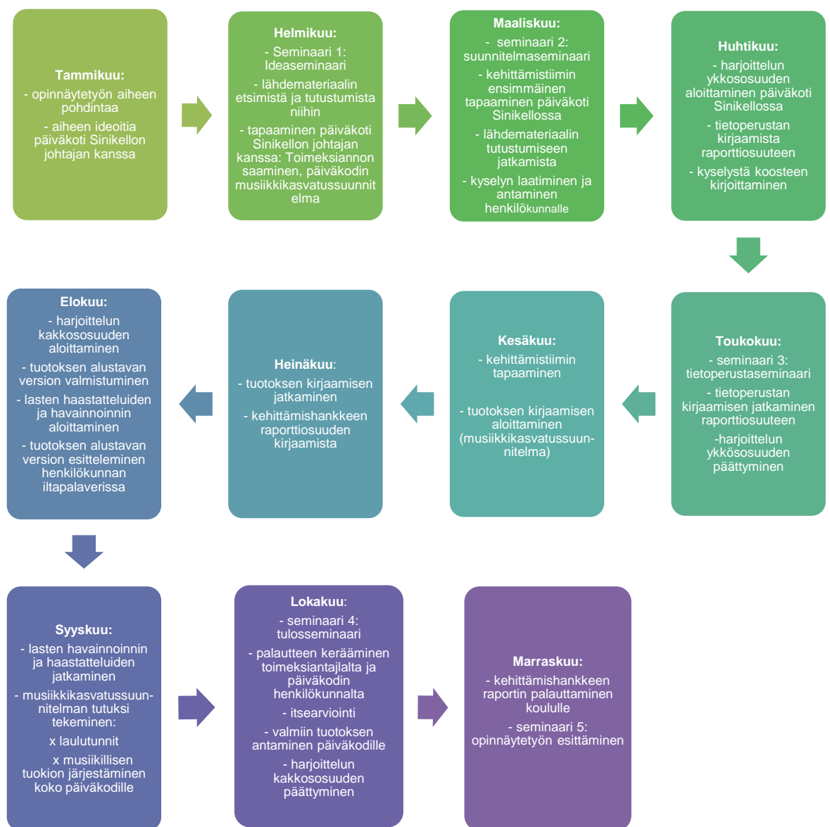
Taulukko 2: kehittämishankkeen prosessi