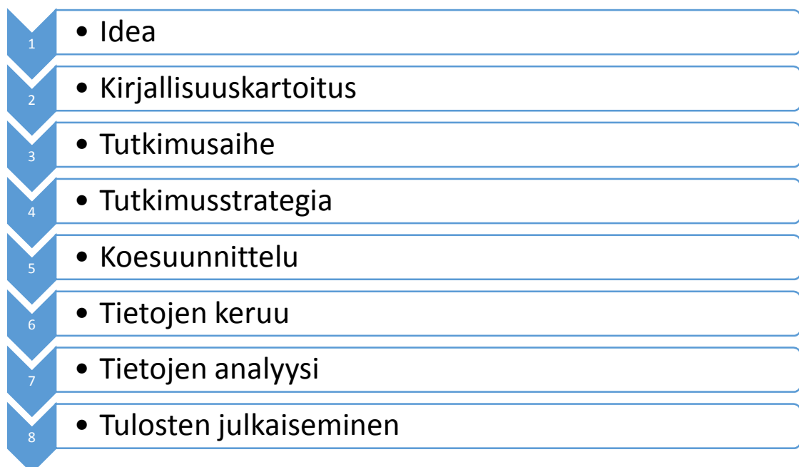
Kuvio 1. Jenkinsin malli (Järvinen & Järvinen 2004, 3)

Tutkimuksen prosessi (ks. kuvio 1) lähtee käyntiin nykytilanteen tarkastelusta ja ideasta tutkia ongelmaa. Aihetta koskevan teoriapohjan vahvistaminen on tarpeen, jotta tutkimusaihe voidaan rajata järkevästi. Järvisten (2004,4) mukaan Jenkins (1985) on halunnut tutkimusprosessissa painottaa, että teoriaa testaavissa tutkimushankkeissa tulisi ensiksi selvittää, mitä muut ovat tutkimusideasta aiemmin kirjoittaneet. Tutkimusprosessi etenee teorian keräämisen jälkeen tutkimusaineiston keruuseen ja teorian testaamiseen käytännössä.