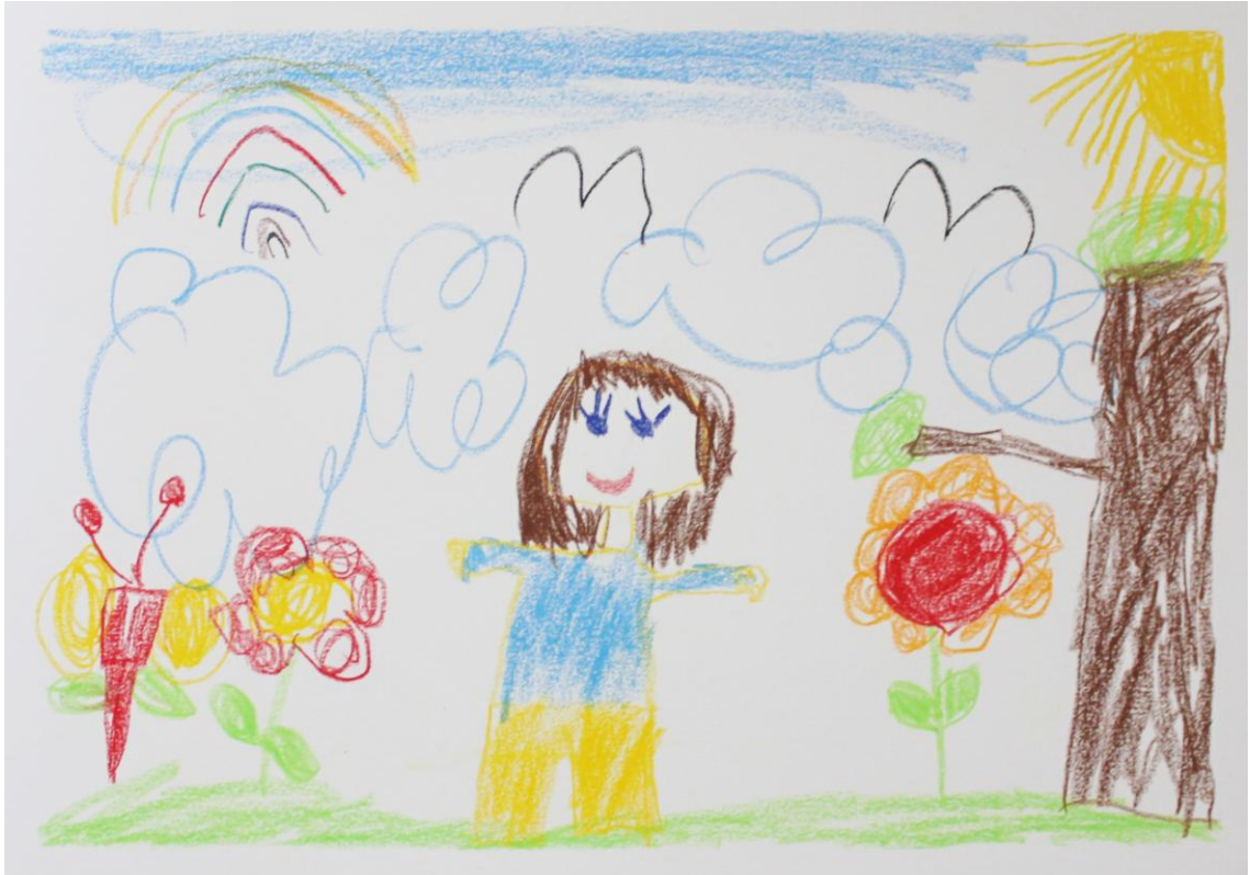
Kuva 7: "Kiva kaveri" (Lapsi 3)