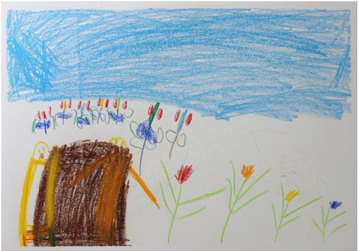
Kuva 2: "Hiikkalaatikossa ystävän kanssa" (Lapsi 4)

Sosiaalipedagogiikkaa voidaan ymmärtää tieteenä, oppialana tai oppiaineena. Ammattihenkilö, ammattiryhmä ja työyhteisö voivat omaksua sosiaalipedagogisen lähestymistavan, orientaation, työkuultuuriinsa. Sosiaalipedagoginen lähestymistapa asettaa painopisteen ryhmien ja yksilöiden sekä näiden suhteiden tarkasteluun ja arviointiin. Sosiaalipedagoginen lähestymistapa ei pitäydy yksilökohtaiseen kehityspsykologiseen tarkastelukulmaan, vaan se laajentaa katseensa aina yksilön/perheen/ryhmän sosiaaliseen ja kulttuuriseen ympäristöön eli kontekstiin – sekä lähiympäristöön että yhteiskunnalliseen ympäristöön. (Ranne 2008, 107.)