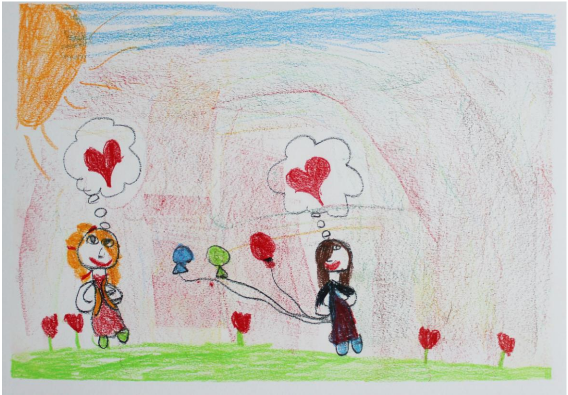
Kuva 1: ”Sateenkaaren ystävyys”(Lapsi 6)

Opinnäytetyö toteutui odotetulla tavalla ja olemme tyytyväisiä valmiiseen työhön. Opinnäytetyön tekeminen tuki ammatillista kasvuamme. Opimme paljon itse kuvataidemenetelmästä ja sen käytöstä, ryhmän ohjaamisesta sekä laajan työn suunnittelemisesta ja toteuttamisesta. Meille oli tärkeää tehdä tämä opinnäytetyö, sillä uskomme, että menetelmästä olisi paljon hyötyä kiusaamisen ennaltaehkäisemisessä.