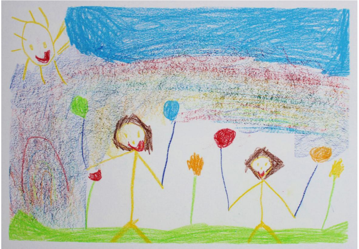
Kuva 14: "Ilmapallopäivä" (Lapsi 4)

Lasten kokemia asioita ystävyystyöistä olivat muun muassa mukava tunne sydämässä, lämmin ja kiva olo. Lapset kuuntelivat hyvin keskittyneesti satua ja sadun jälkeen olisivat ryhtyneet heti piirtämään aiheeseen liittyen. Lapsilta tuli paljon erilaisia kuvia ystävyystyöön liittyen ja se tuntui oleva aiheena mieluista.