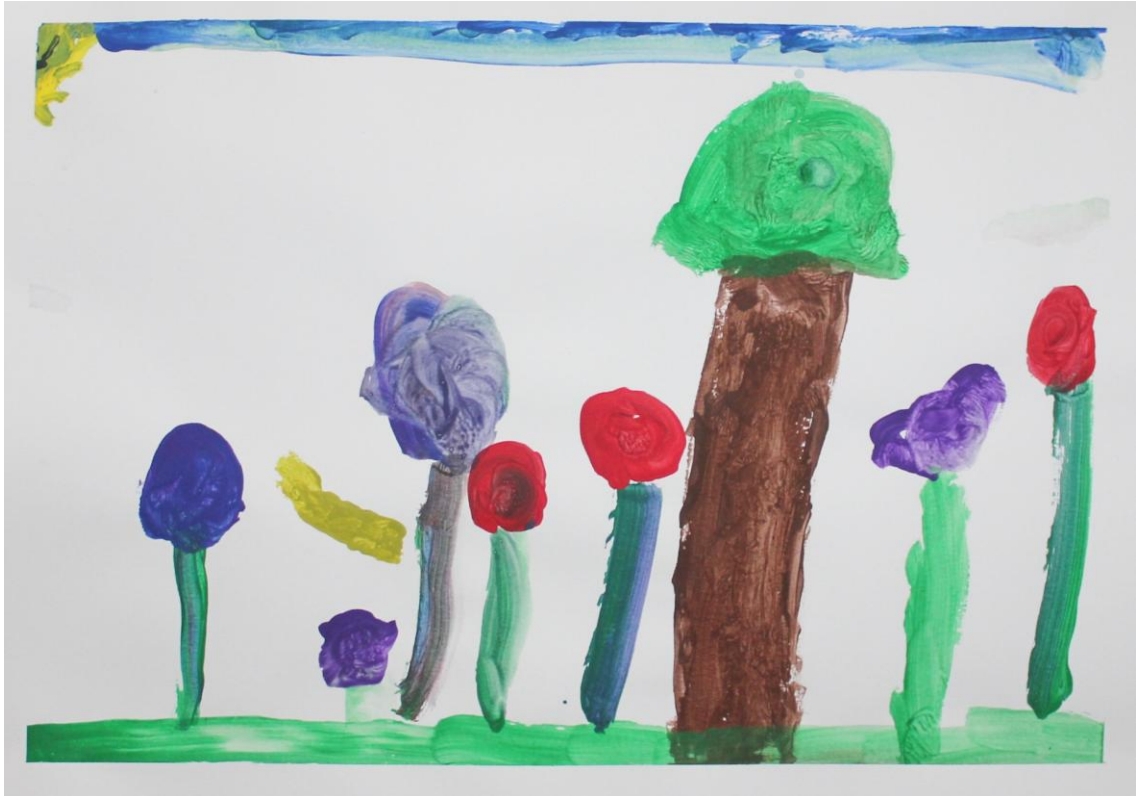
Kuva 11: "Autan äitiä ottaa kukkia" (Lapsi 5)