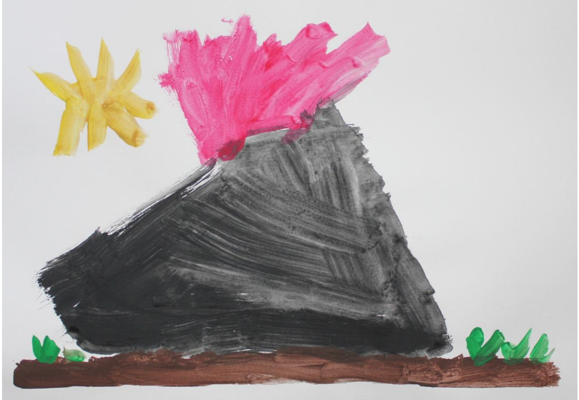
Kuva 3: "Paukku" (Lapsi 2)

työskentelyn, tutoroinnin tai yhteisten projektien avulla. Yhdessä voidaan keskustella, minkälainen on hyvä ystävä, millä tavalla voidaan auttaa muita ja mikä saa toiset ihmiset hyvälle tuulelle. (Aho & Laine 2002, 242–243.)