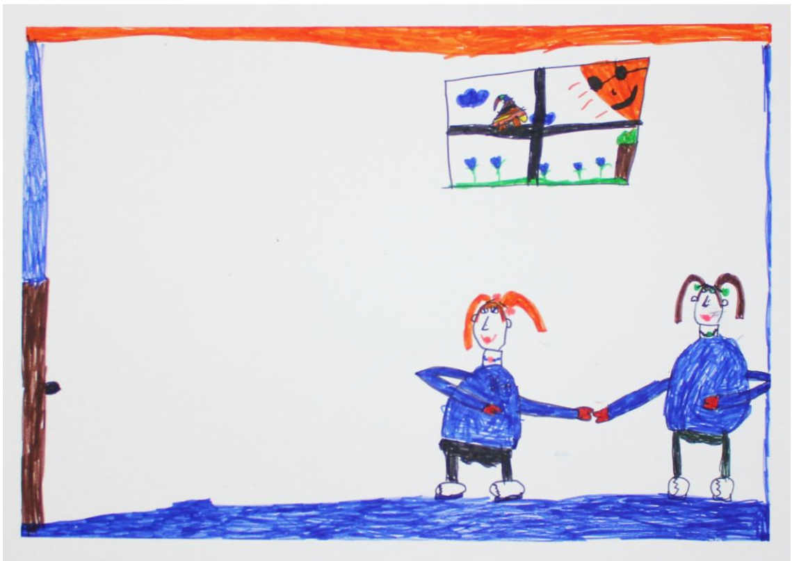
Kuva 12: ”Luisteluharkat” (Lapsi 6)

Lapset kuuntelivat satua hyvin ja tilanne oli hyvin rauhallinen. Kysyimme lapsilta, mitä he pitivät sadusta ja mikä oli sadun keskeinen sanoma, mihin sitten yksi lapsista totesi: ”Ettei tarvitse olla mikään kauhee hieno.” (Lapsi 6) Ymmärsimme, että lapsi yritti tarkoittaa tällä sitä, ettei tarvitse olla samanlainen kuin kaikki muut. Sadun jälkeen yksi lapsista tuli hieman huonovointiseksi ja joutui lähtemään kesken tuokion. Tämäkään ei kuitenkaan vaikuttanut erityisemmin meidän toimintaan tai muiden lasten työskentelyyn. Lapset olivat hieman hämmentyneitä vielä sadunkin jälkeen, mistä voisivat piirtää, mutta hetken aikaa mietittyään lapset saivat jonkin idean kuvan tekemiseen. Toimintatuokion lopussa lapset saivat jälleen vapaasti kertoa tekemistään töistä.