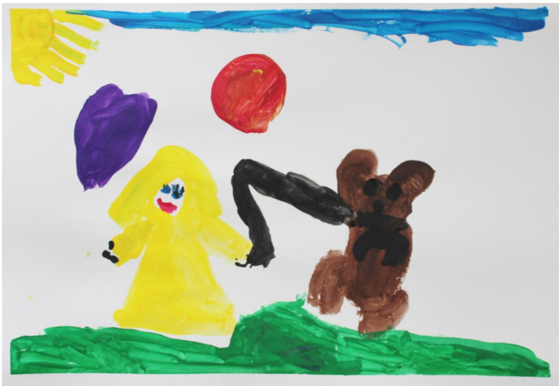
Kuva 10: ”Koira” (Lapsi 3)

Toimintatuokion aikana esiintyi myös pientä lasten välistä kehumista. Lapsi kehui toisen lapsen työn värejä. ”Vaau, toi on oikee tulen punainen!” (Lapsi 6) Lapset maalasivat hyvin konkreettisia tilanteita auttamisesta ja ne liittyivät joko perheeseen tai ystäviin. Toimintakerran lopussa kävimme vielä yhdessä läpi lasten tekemät työt ja lapset saivat vapaasti kertoa, mitä heidän kuvissaan oli.