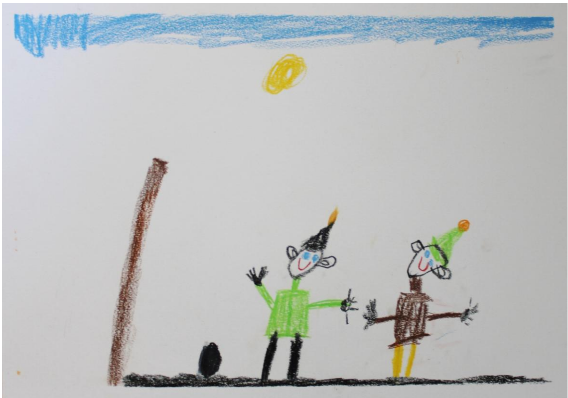
Kuva 6: "Kiva matsi" (Lapsi 2)

Toimintatuokion lopussa lähdimme kyselemään lapsilta heidän tekemistään kuvista. Lapset olivat aluksi hyvin innokkaita kertomaan, mutta vuoron saatuaan lapset olivat hiljaisia ja heidän oli hyvin vaikea kertoa tekemästään kuvasta. Saimme huomata, että lapset kertoivat enemmän kuvan tekemisen yhteydessä kuin vasta kuvan tekemisen jälkeen. Koska kertominen tuntui lapsista vaikealta, lähdimme kysellen ottamaan selvää lasten töistä. Tästä oli apua, sillä lasten oli helpompaa vastata meidän kysymyksiin kuin lähteä kertomaan vapaasti omasta työstään. Otimme kuitenkin myös huomioon lasten kommentit, joita he sanoivat kuvaa tehdessään ja nämä ovatkin mielestämme tärkeimpiä tietoja, mitä lapsi voi työstään antaa.