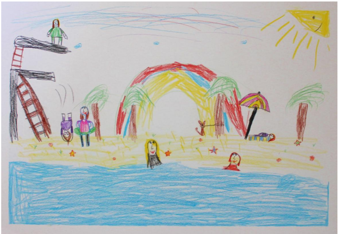
Kuva 8: ”Uimaretki” (Lapsi 6)

Toimintakerran aikana oli mielestämme turhan paljon tarpeetonta hälinää ja jouduimme muistuttamaan lapsia työnrauhan antamisesta. Kun lasten työt olivat valmiit, lapset saivat tämän jälkeen jälleen kertoa vapaasti omista töistään.