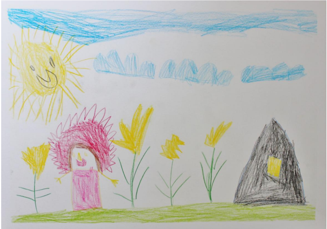
Kuva 9: "Telttailupäivä" (Lapsi 4)

Lasten oli helppoa kertoa, mistä tulevat onnelliseksi ja huomasimme, että aihe oli lapsista helppoa. Aiheen kautta nousikin lapsissa erilaisia ajatuksia onnellisuuteen liittyen.