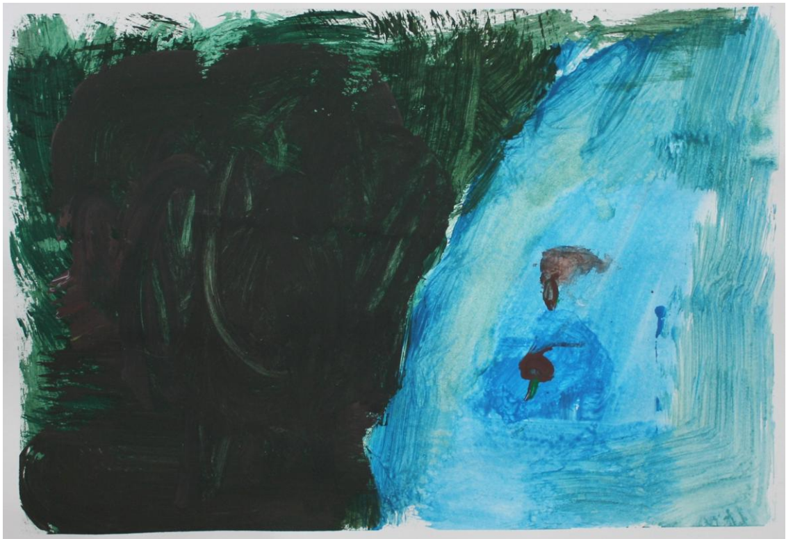
Kuva 4: ”Kalastusta”(Lapsi 1)

Maalaus oli aluksi hetken kankeaa. Lapset vaikuttivat hieman hiljaisilta vaikka puhe- liimmat heistä keskustelivatkin jonkin verran. Pienen miettimishetken jälkeen lapset selvästi saivat ideoita mistä maalata. Opinnäytetyön suunnitteluvaiheessa mietimme pitkään kuinka paljon pitäisi varata aikaa toimintatuokioille. Toimintatuokion aikana saimme huomata, ettei tunti ole liian vähän tuokioiden pitämiseen. Ilmoitimme lapsille puolessa välissä, että on vielä puolituntia aikaa tehdä työtä. Siihen yksi lapsi totesi yllättyneenä: ”Äh, puolisentuntia?” (Lapsi 2) Kysyimme häneltä että onko se paljon vai vähän, johon lapsi totesi: ”paljo” (Lapsi 2).