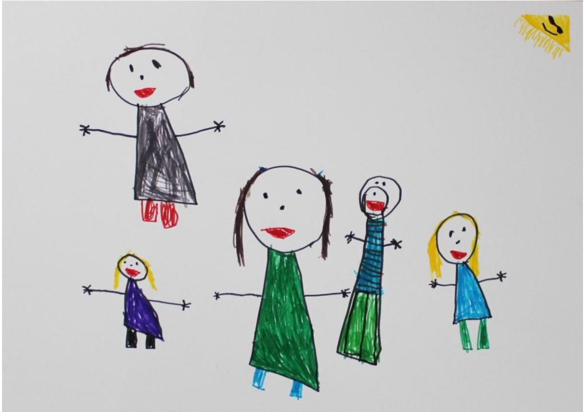
Kuva 13: "Meidän perhe" (Lapsi 5)

Meidän perhe-kuvassa lapsen kertomana: "Täs o mein koko perhe ja me ollaan pihal." (Lapsi 6)