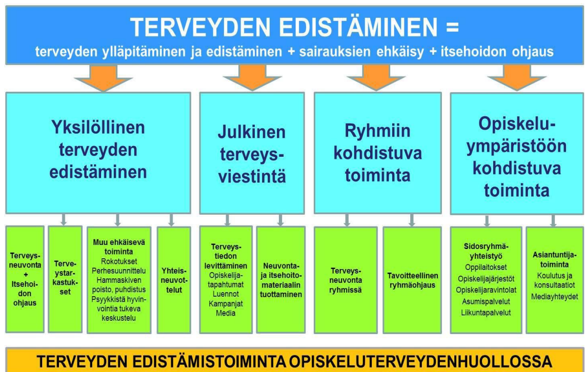
KAAVIO 1. YTHS:n terveyden edistämistoiminta (YTHS. 2015)

Oheisessa kaaviossa on kuvattu YTHS:n terveyden edistämistoiminta kokonaisuudessaan.