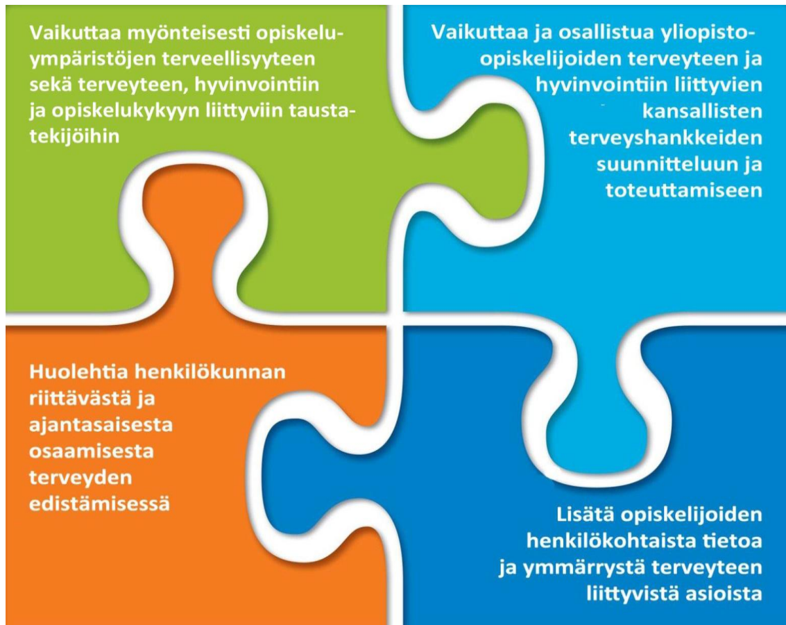
KAAVIO 1. YTHS:n terveyden edistämisen tavoitteet (YTHS. 2015)

Ylioppilaiden terveydenhoitosäätiön (YTHS) terveyden edistämistoiminnan tavoitteet kohdistuvat yksilöihin, yhteisöihin ja kansalliselle tasolle sekä henkilökunnan koulutukseen.