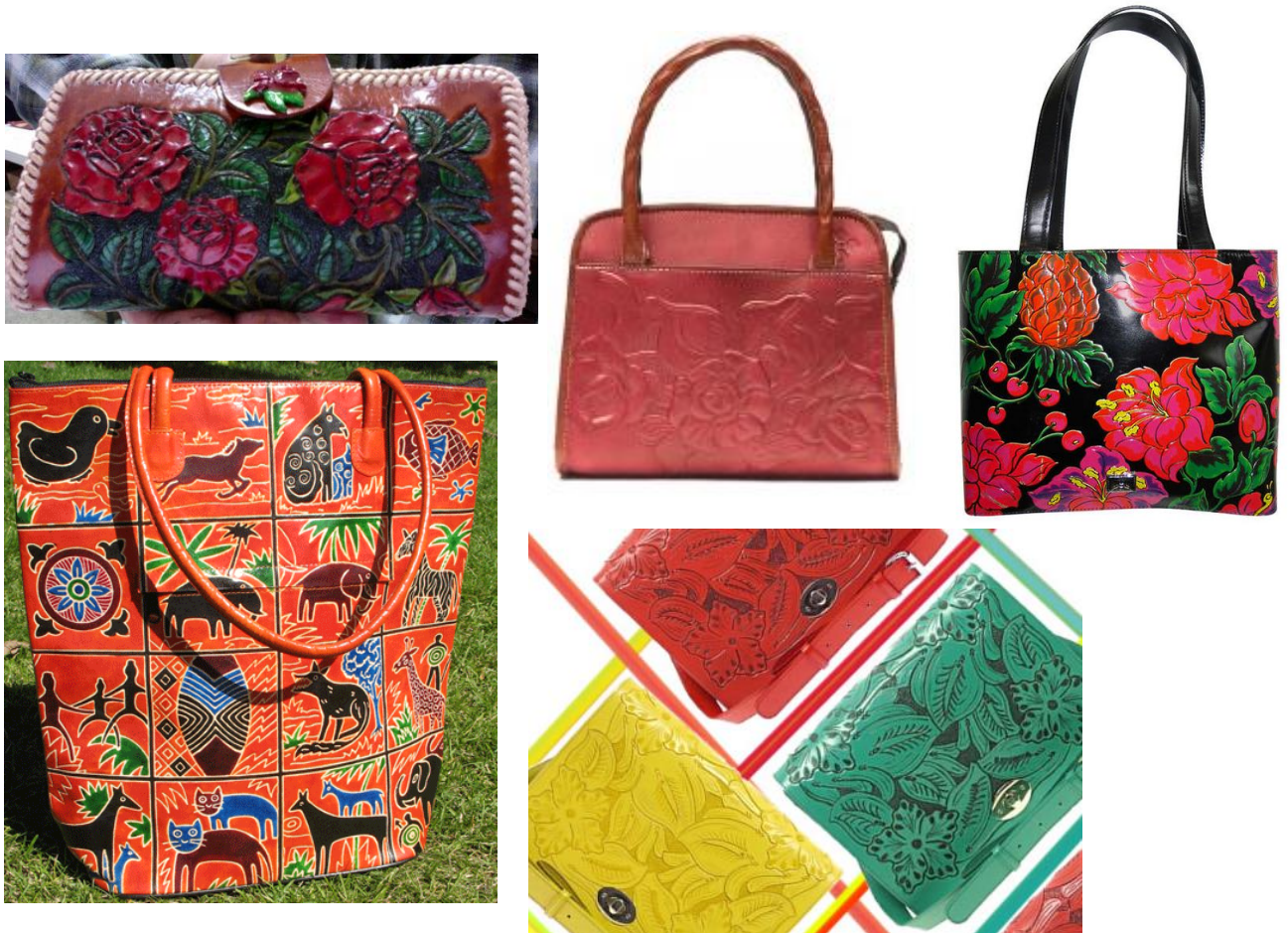
Kuva 2. Vastaavia laukkuja maailmalla. Ylhäältä vasemmalta: Delos Leather, Patricia Nash Cassini: Tooled Rose ja Moschino: Tooled leather Cherries and Flowers bag. Alhaalla vasemmalta: Madhya Kalikata Shilpangan: Shanti Leather bag ja ASOS Tooled Bright Leather Satchel: The Daily Bag.