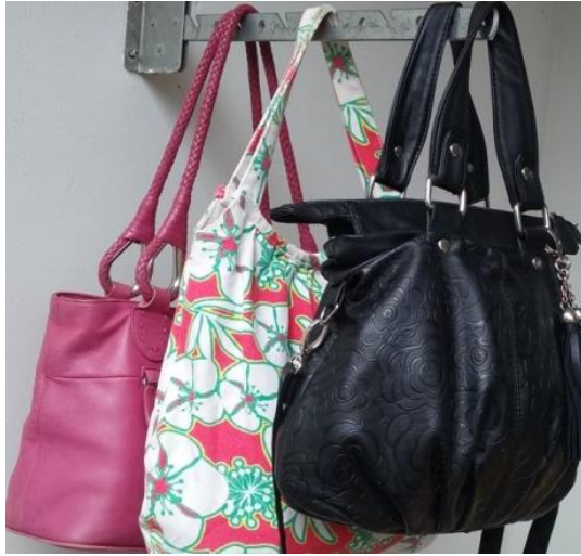
Kuva 3. Kolme lempilaukkuani.

on ihana ”pakotettu” pintakuviointi. Miinuspuolena on tylsä väri ja keino-nahkaisuus. Keskimmaisessa laukussa on naisellinen malli, kaunis kuvio ja useita eri värejä. Miinuspuolena on se, että laukku on kankainen. Taa-immainen laukku on herkullisen värinen ja aitoa kestävä nahkaa, mutta sen malli on tylsän kulmikas ja kaipaisin siihen enemmän naisellisuutta. Ruusu-unelmassa on kaikki nämä positiiviset piirteet.