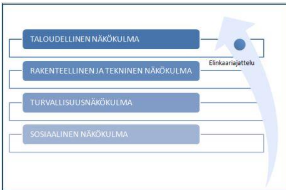
Kuvio 1. Strategisen suunnittelun näkökulmat ja elinkaariajattelu (alkuperäinen kuvio, Siitonen, H. 2010, 31.)

Suunnittelun kannalta on olennaista, että hankitaan kaikki olennainen tieto koskien taloyhtiön teknistä ja rakenteellista kuntoa sekä taloudellista tilannetta. Asukkaiden ja osakkaiden osallistuttaminen prosessiin viestinnän avulla on avainasemassa. Näkökulmien lisäksi täytyy huomioida kiinteistön omistajien ja asukkaidenkin elinkaari. Rakennuksen elinkaarella tarkoitetaan jaksoa maankäytön ja rakentamisen suunnittelusta aina rakennuksen purkuun ja purkutuotteiden lajitteluun saakka. Rakentamisen ja purun väliin mahtuu käyttöikä johon sisältyy lukuisia kunnossapitajaksoja, joilla pyritään lisäämään rakennuksen käyttöikää. (Elinkaaren suunnittelu, 20.12.2007.) Kuvio 1 osoittaa, mitkä näkökulmat otetaan huomioon strategiaa luotaessa.