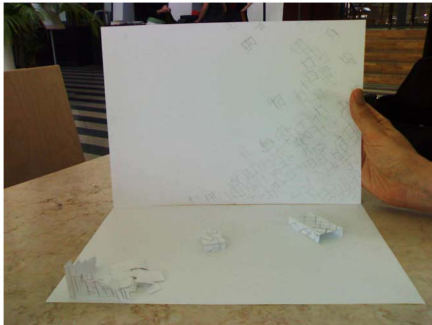
Ohjaaja esittelee pienoismallia lavasteeksi.