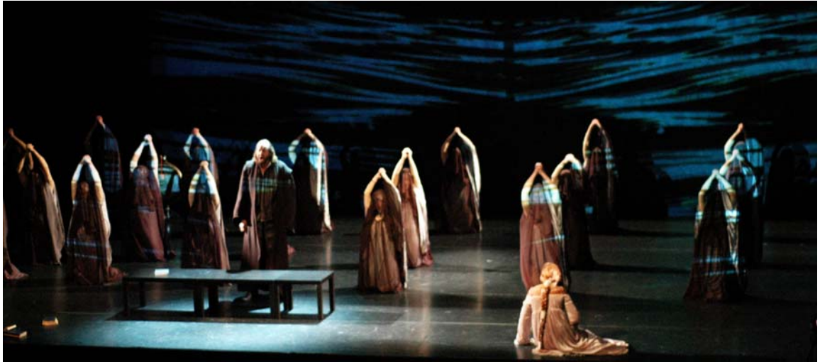
Stilisoitu animaationomainen vesi hukuttaa kuoron aaltoihinsa.