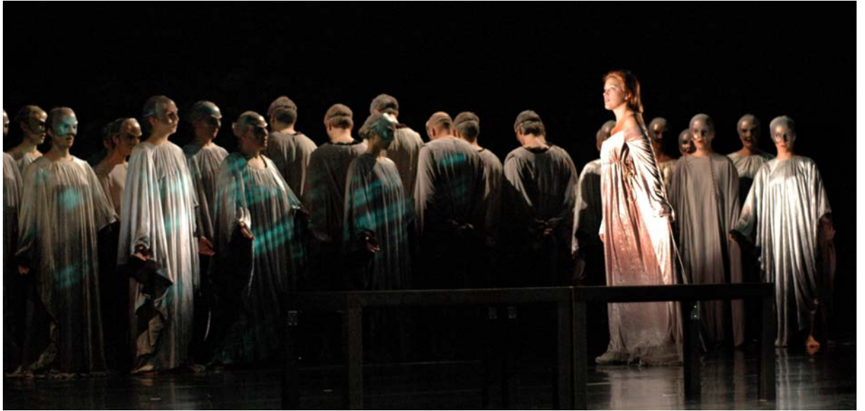
Kuoro kommentoi rakastuneen Héloïsen tunnekuohuja.