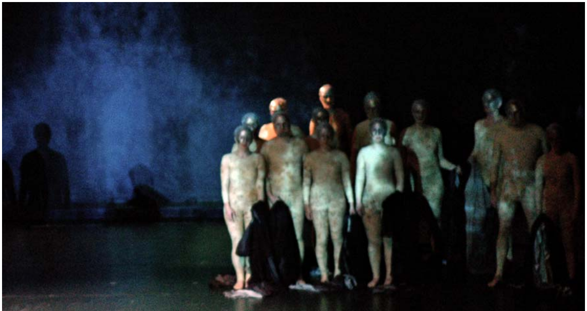
Rakastelukohtauksessa kuoro riisuu viittansa suihkulähteen veden pulputessa.