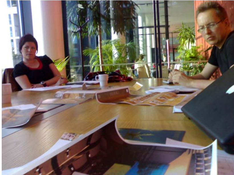
Ohjaaja silmäilee tekemääni havaintokuvaa salista tuotantopalaverissa elokuussa.