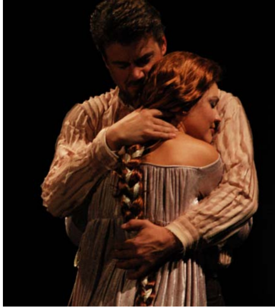
Rakastavaiset: opettaja ja hänen nuori oppilaansa.