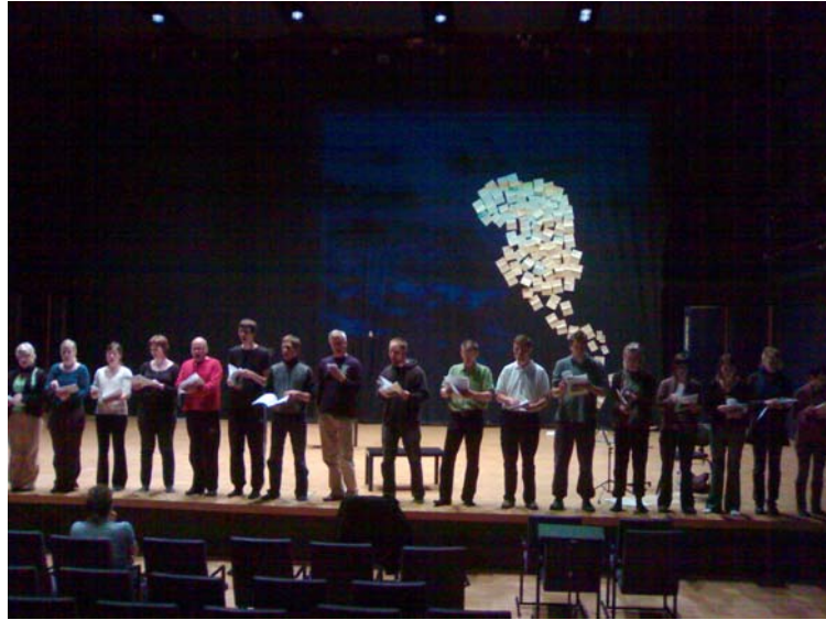
Kuoro harjoituksissa jolloin seinäpintaa on rakennettu vähän.

Sijoitin siis videotykit toistensa viereen niin, että saan koko lavan peittävän kuvan. Ratkaisin kuvan tylsyyden kääntämällä toisen videotykin kuvan peilikuvaksi. Kuvien vesi nousi näin näyttämön reunoilta ja kohosi näyttämön keskikohtaa kohti. Vaikutelma oli tehokas ja toimi.