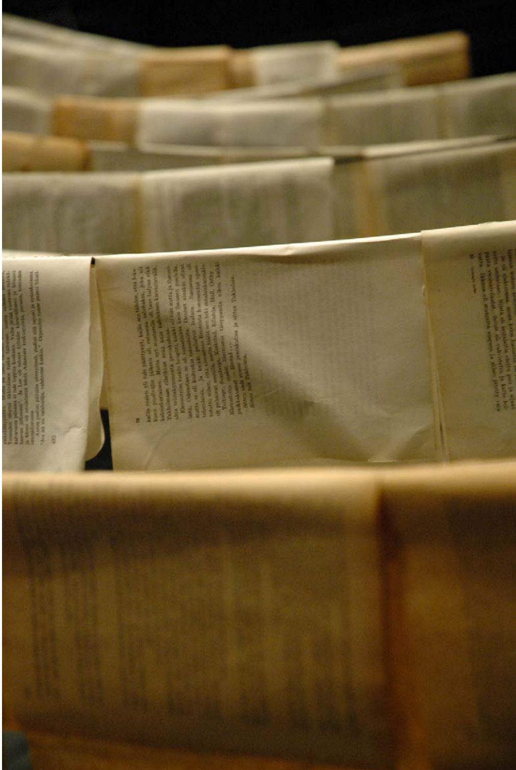
Lehdet kuivumassa palokyllästyksen jälkeen.