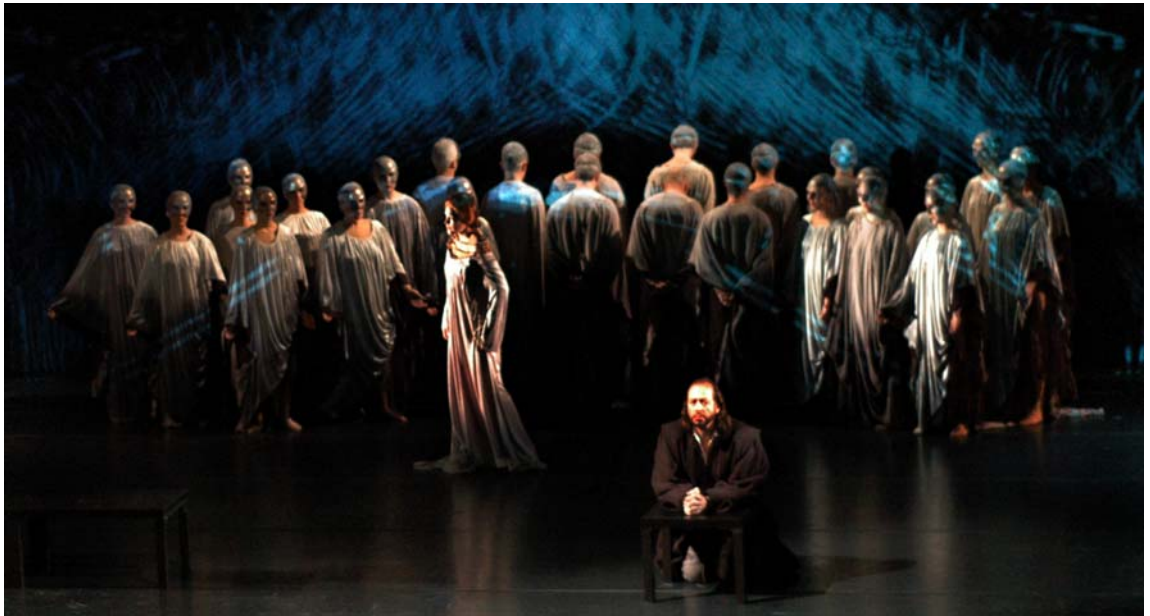
Fulbert on saanut tietoonsa rakkaussuhteen.