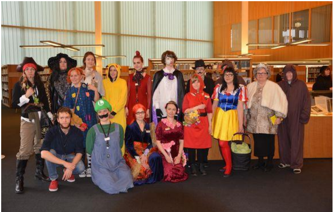
Kuva 4. Kirjalliset naamiaiset (Vaski-kirjastot 2014).

Lopullisia hyötyjä puntaroidessa vaakakuppi kallistui tämän projektin kohdalla Turun kaupunginkirjaston puoleen, joka tunsu saaneensa näkyvyyttä erityisesti Kysy kirjastonhoitaja -ohjelmallaan. Yle Turku puolestaan soi näkyvyyttä ainakin keväällä 2014 Turun kaupunginkirjastossa järjestetyille kirjallisille naamiaisille esimerkiksi ohjelmassa Radio lukee kirjan. Naamiaiset liittyivät vuoden Lukuviikko-tapahtumaan. Kuva alla välittää naamiaisten tunnelmaa.