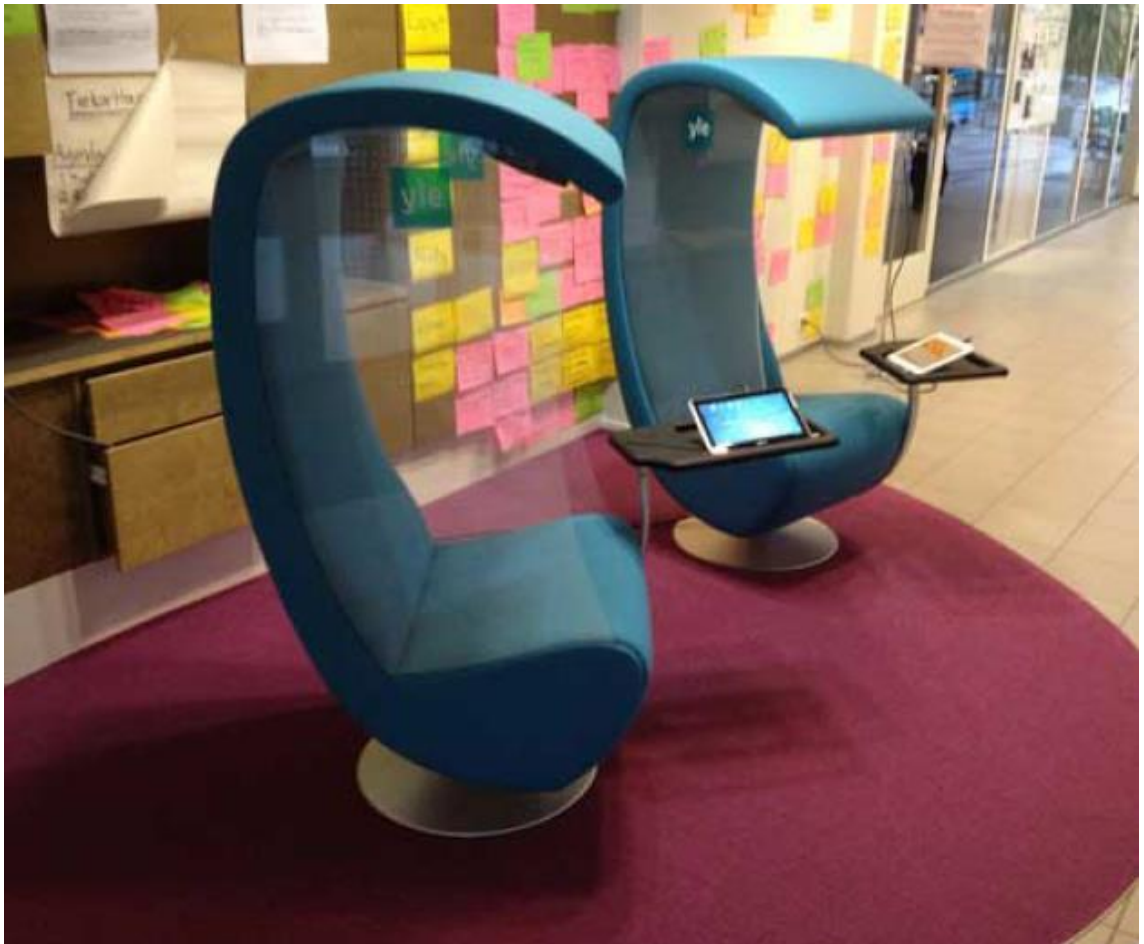
Kuva 3. Audiokustomoitu Silence-tuoli. Kuva on Turun kaupunginkirjaston sisäisessä pdf-muistiossa.

Silence-tuolin yksinkertaistettu malli olisi ollut pelkkä seisontapiste kannettavan tietokoneen käyttöä varten. Se ei olisi kuitenkaan tarjonnut tuolin kaltaista rentoutumishetkeä ja tuskin olisi koettu kirjaston käyttäjien keskuudessa yhtä puoleensavetäväksi kuin houkutteleva, istumaan ja omaan rauhaan päästävä tuoli. Silence-tuoli olisi edustanut uudenlaista palvelumuotoilua, ja asiakkaan kontaktirajapinta olisi monipuolistunut. Projektin toiminta-aikana tämä olennainen uusi toimintamalli jäi valitettavasti testaamatta. Seuraavalla sivulla on Turun kaupunginkirjaston sisäisessä projektisuunnitelmassa ollut Yle-tuolin kuva.