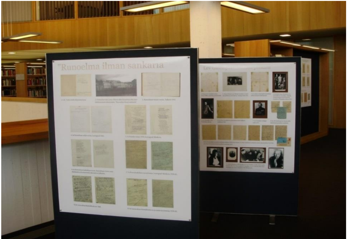
Kuva 1. Anna Ahmatova -aiheinen näyttely liittyi Radio lukee kirjan -ohjelman Venäjä-teemaan.

Opinnäytteen tekijä otti radio-ohjelman nauhoituspäivänä kuvia nauhoituksen teemaan liittyvästä aineistoesittelystä.