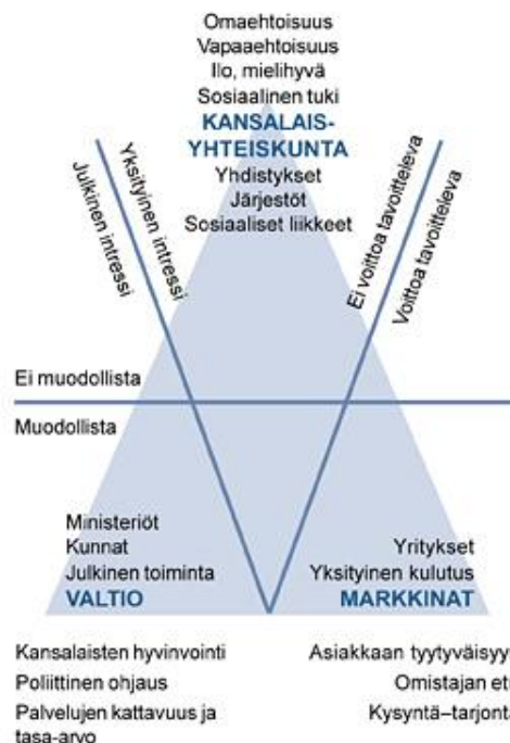
Kuva 1. Yhteiskunnan päätoimintalohkot (Kansalaisyhteiskunta 2015)

Kansalais- ja järjestötoiminta ovat luonnollinen osa kansalaisyhteiskuntaa ja volyymiltaan sekä merkitykseltään nämä muodostavat kansalaisyhteiskunnan ytimen. Aineksina kansalaistoiminnan määritelmässä ovat ihmisten aktiivinen toiminta itsestä ulospäin, yhdessä toimien yhteiseksi hyväksi, osana jotain suurempaa organisoitua toimintaa. (Harju 2003, 10–12.) Yhteiskuntakokonaisuus voidaan Suomessa jakaa kolmeen eri päälohkoon. Nämä ovat valtion johtama julkinen sektori, yrityksistä muodostuva yksityinen sektori sekä kansalaisyhteiskunta, joka muodostuu muun muassa yhdistyksistä ja järjestöistä.