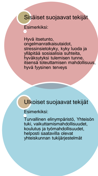
Kuvio 1. Mielenterveyttä suojaavat sisäiset ja ulkoiset tekijät (Heiskanen – Salonen – Sassi 2006).

ovat terveyteen, hyvinvointiin, turvallisuuden tunteeseen, toimintakykyyn ja elämänhallintaan haitallisesti vaikuttavia tekijöitä, jotka voivat myös lisätä riskiä sairastumiseen. (Heiskanen – Salonen – Sassi 2006: 20.)