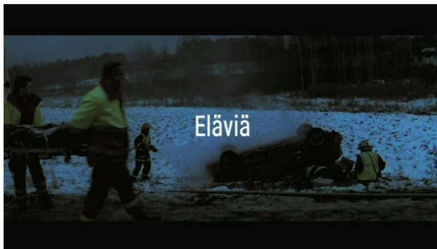
Kuva ensimmäisestä kohtauksesta. Kuva on kaapattu mainoksesta

Elävät-kampanjainos on mielestäni onnistunut valistusmainos. Opin tämän projektin osalta jälleen lisää filmikuvaamisesta ja eritoten filmin valottamisesta. Liikkuvasta autosta kuvaaminen oli myös ainutlaatuinen ja opettava kokemus. Ainut, hieman hampaankoloon jäänyt seikka, oli se että kaupalliset tavoitteet menivät taiteellisten valintojen ja kokonaisuuden edelle. Mielestäni Elävät -mainos olisi alkuperäisen kuvasuunnitelman mukaisena vielä voimakkaampi ja vaikuttavampi kokemus katsojalle.