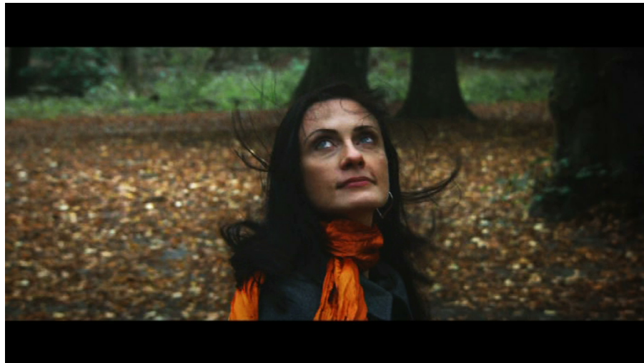
Kuva puistokohtauksesta Amsterdamista. Kuva on kaapattu mainoksesta.