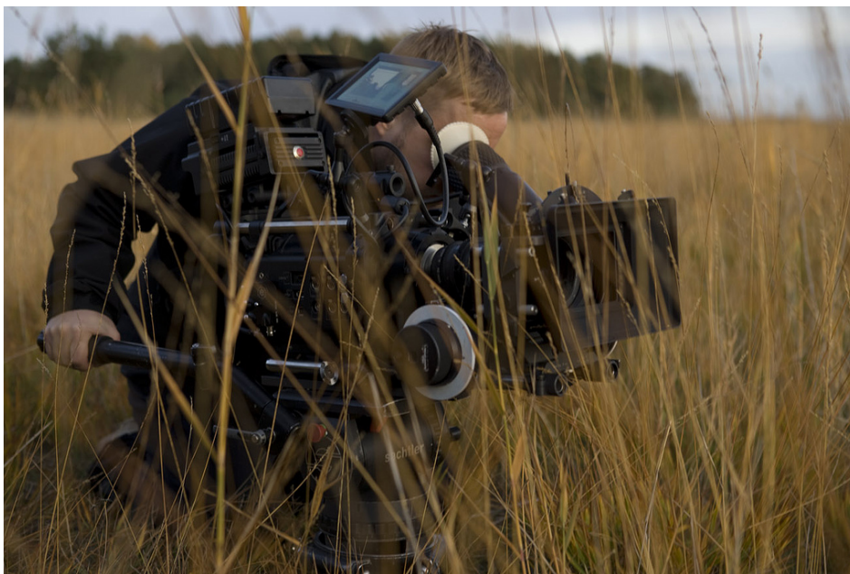
RED käynnissä Kalviikin kaislikossa.

Seuraava kohtausta kuvattiin Kalviikissa, meren rannalla. Sään puolesta ei voinut olla parempaa tuuria. Aurinko paistoi pienen pilvihunnun läpi koko päivän. Tämä kohtausta kuvattiin kokonaan ylinopeudella. Käytimme kameran linssin edessä yhteensä kuuden aukon vahvuisesti ND-filttereitä, jotta saimme pidettyä kameran aukon melko suurena. Kuvasimme myös oikeaa leijaa. Kova merituuli ja amatööri lennättäjät toivat haastetta näiden kuvien tekemiseen.