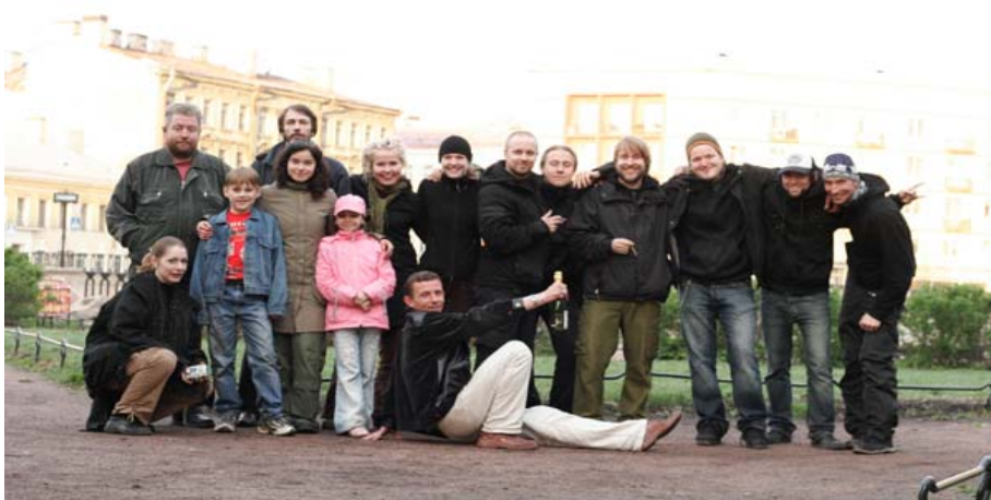
Pietarin työryhmä. Kuvaukset on ohi, aamu sarastaa ja juhlat voi alkaa!

Dokumentaarinen kuvaustyyli on saanut elokuvan valmistuttua monenlaista palautetta. Negatiivista palautetta on tullut kameran liiallisesta heilumisesta. Joissain kohtauksissa kameran operointi on melko hektistä ja rauhatonta. Kameraa ei kuitenkaan heilutettu kertaakaan tarkoituksella vaan sen rauhaton liikkuminen johtuu kuvaushetkellä impulsiivisesta, näyttelijöiden ja tapahtumien mukana elämisestä. Itse olen sitä mieltä että improvisaatio ja käsivaralta kuvaaminen palvelee visuaalisesti elokuvan kerrontaa ja on sen vuoksi onnistunut valinta.