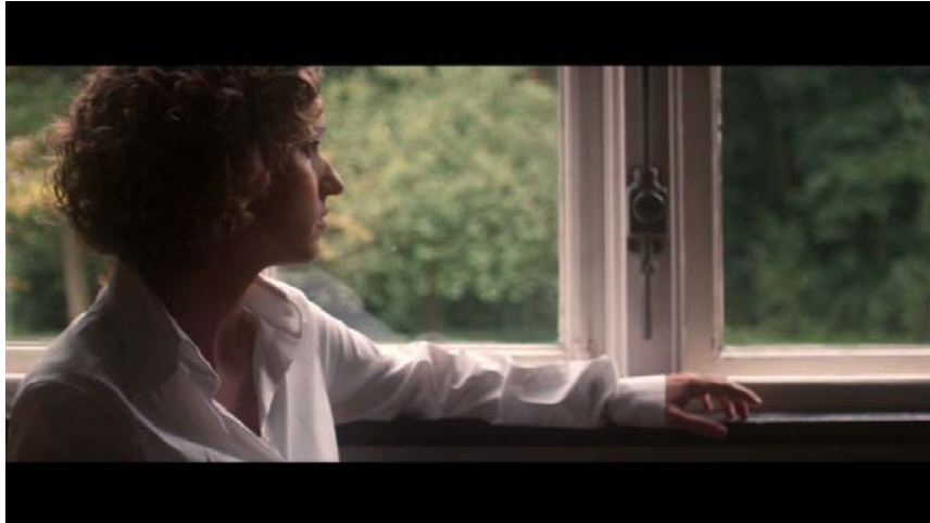
Kuva luokkahuonekohtauksesta Amsterdamista. Kuva on kaapattu mainoksesta.