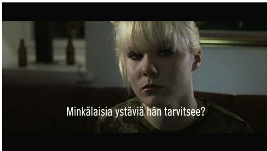
Kuva ensimmäisestä kohtauksesta. Kuva on kaapattu mainoksesta