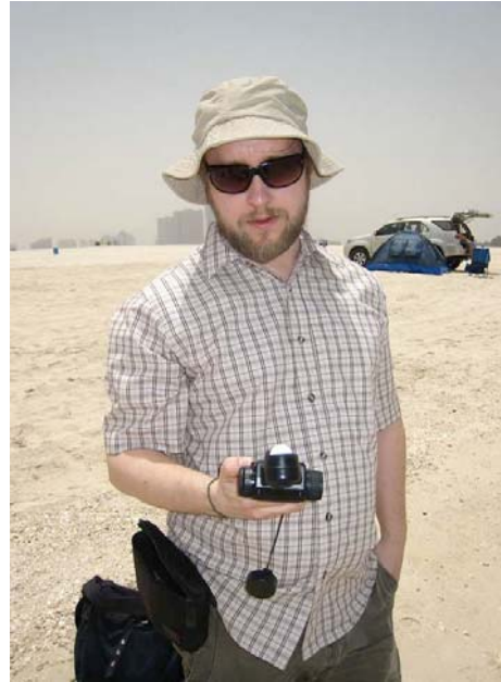
Minä ja todella pitkä 2. kamera-assistentti, huom. applebox jalkojeni alla.