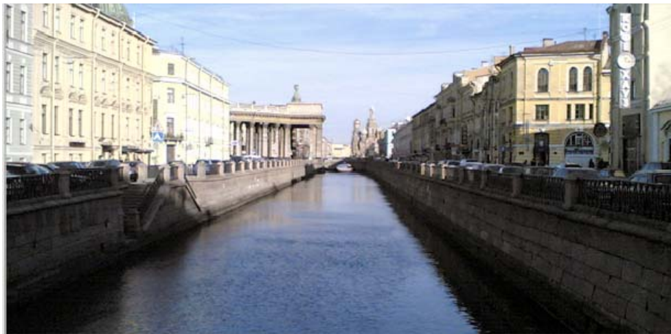
Näkymä Pietarista. Kanaaleja risteilee keskustassa useita.