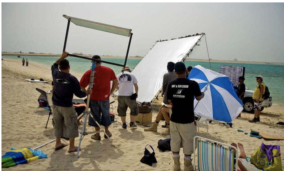
Valoryhmä pystyttää 12" butterfly raamia, ja shiny boardeja.

Toisen päivän aloitimme aikaisin aamulla. Saapuessamme rannalle, oli siellä jo täysi tohina päällä. Kalustoautoja ja ihmisiä oli valtava määrä. Työryhmässä oli väkeä paljon enemmän kuin olin kuvitellut. Tällaista järjestelyä en ole nähnyt koskaan ennen muualla kuin, Hollywood elokuvien making-of osuuksissa. Kakki toimi kuin isommassakin elokuva tuotannossa ja me olimme kuvaamassa musiikkivideota suomalaiselle artistille. Työryhmässä oli yhteensä noin 30 henkeä, mikä on Suomen mittakaavassa valtava määrä. Pelkästään catering-väkeä oli 6 henkeä ja tarjoilut sen mukaiset. Päivä aloitettiin kokin paikanpäällä valmistamalla munakkaalla.