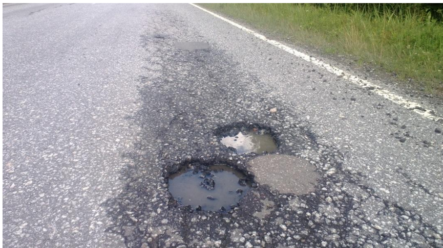
Kuva 3. Reikiintyminen. Johtuu jäätymisen, sulamisen veden ja liikenteen kuormituksen yhteisvaikutuksessa. (Liikennevirasto, 2014.)