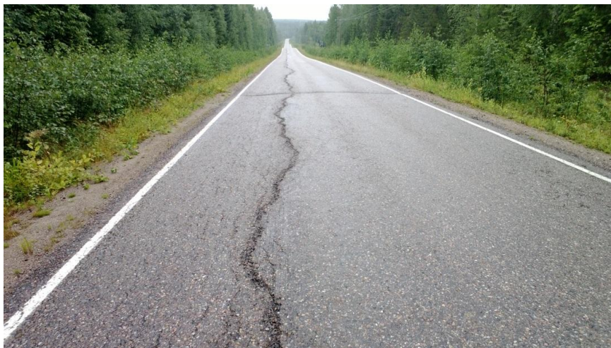
Kuva 4. Halkeamat. Johtuvat yleensä siitä että, routivan pohjamaan päälle on tehty liian ohuet rakennekerrokset. (Liikennevirasto, 2014.)