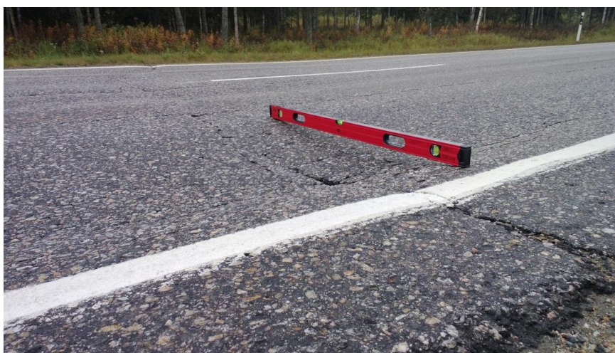
Kuva 5. Painumat ja kohomat. Johtuvat yleensä epätasaisesta jäätymisestä ja sulamisesta. (Liikennevirasto, 2014.)