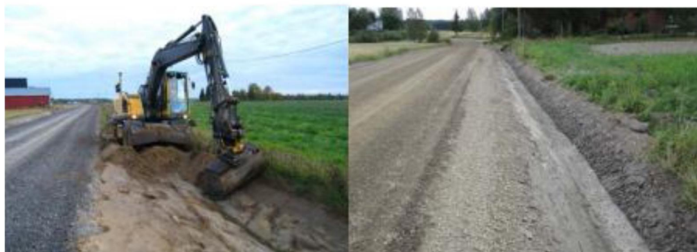
Kuva 7. Ojitus (Liikennevirasto, 2014.)

Ojien kunto vaikuttaa oleellisesti kuivatuksen toimintaan. Ojitus tehdään yleensä alkukesästä vuosittaisen ohjelmoinnin ja työnsuunnittelun mukaisesti. Ojituksia voidaan tehdä myös tarpeen mukaan myöhemmin. (Liikennevirasto, sorateiden kunnossapito 2014, 38.)