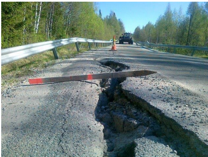
Kuva 6. Rakenteelliset puutteet. Esimerkiksi liian ohuet kerrokset, liian jyrkät luiskat tai liian kapea tie. (Liikennevirasto, 2014.)