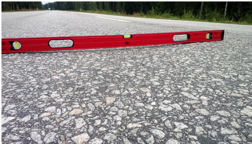
Kuva 2. Urautuminen. Johtuu useimmiten liikenteen kulutuksesta. (Liikennevirasto, 2014.)