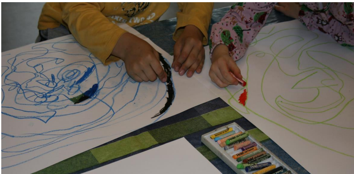
Kuva 2. Lapset värittävät viivoista muodostuneita aukkoja.

misessä, osa taas hieman arkaili isoja liikkeitä. Seuraavassa vaiheessa väritettiin viivoista paperille muodostuneita aukkoja tai kuvioita. Lapset löysivät teoksistaan mielenkiintoisia kuvioita ja jaksoivat värittää useampiakin (kuva 2). Sitteen väritetyt kuviot leikattiin irti osittain ohjaajan avustuksella ja sommiteltiin paperille, jonka värin lapset itse valitsivat. Näin syntyivät lasten omat abstraktit teokset. Kun lasten teoksia tarkasteltiin, lapset löysivät niistä monenlaisia hahmoja ja esineitä. Käytännön pulmana harjoituksessa huomasimme, että koska viivan tekemiseen valittiin isot paperit, että liike olisi kokonaisvaltaista, ne eivät sopineet yhteen värillisen paperin kanssa. Kun kuvioita sommiteltiin, eivät niistä kaikki tahtoneet mahtua papereille.