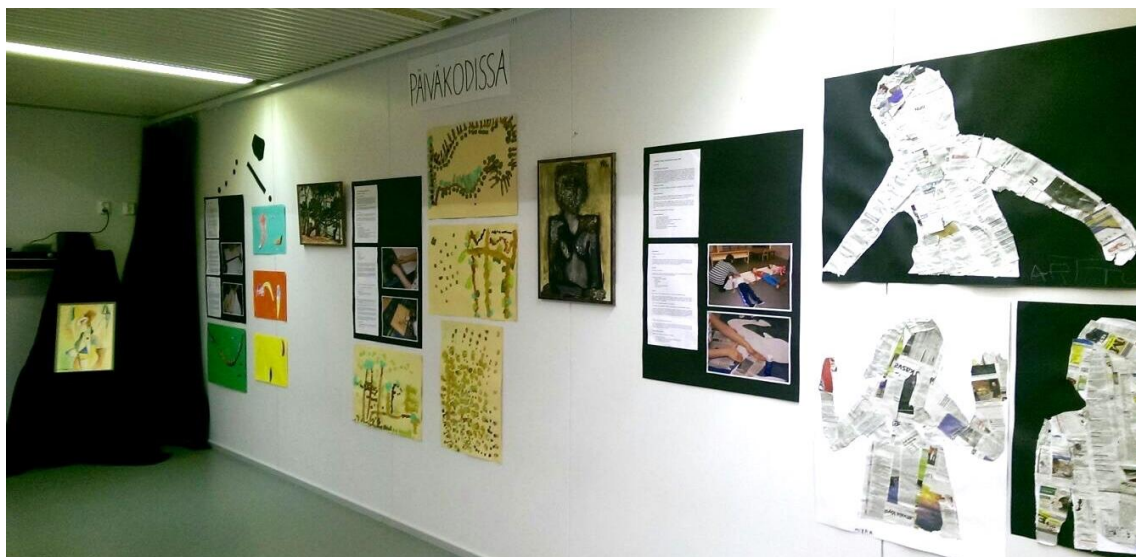
Kuva 3. Näyttely päiväkodissa.