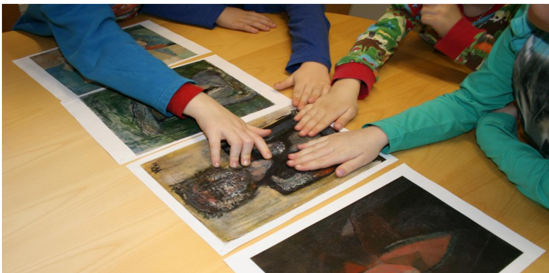
Kuva 1. Teosten valinta lasten kanssa.

muuten tarkoituksena oli keskustella mahdollisimman vapaasti lapsia kiinnostavista asioista. Lapset saivat nähdä teosvaihtoehdot teemoittain. Toinen meistä esitti kysymyksiä lapsille teoksiin liittyen, toinen kirjasi lasten näkemyksiä. Vaikka kiinnostuksen kohteet voivat muuttua, varsinkin lapsilla, ovat lasten mielipiteet yhtä arvokkaita kuin aikuisen, eikä tarkoitus ole etsiäkään yhtä ainoata totuutta (Turja 2004, 11). Teoksista valitsimme ne, jotka herättivät selkeästi eniten lasten mielenkiintoa ja keskustelua. Teokset digitoitiin taidemuseossa ja teetettiin Punamusta Oy:ssä.