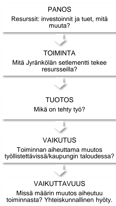
KUVIO 1. Tutkimusongelma vaikuttavuusketjuna

Tutkimusongelmaa havainnollistetaan myöhemmin, opinnäytetyön luvussa 2.4.3 tarkemmin esiteltävällä vaikuttavuusketjulla.