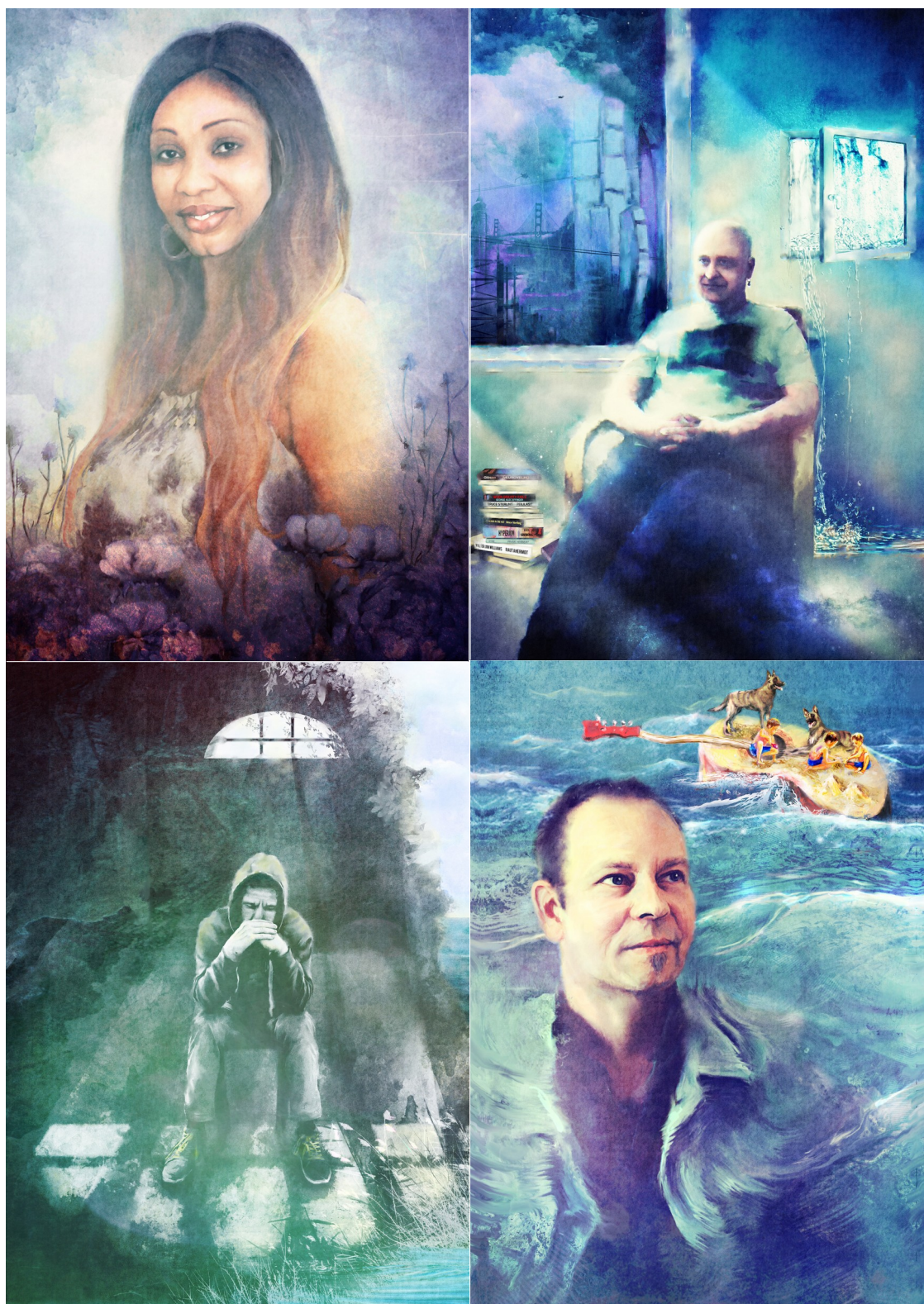
Kuva 6. Valmiita digimaalauksia.