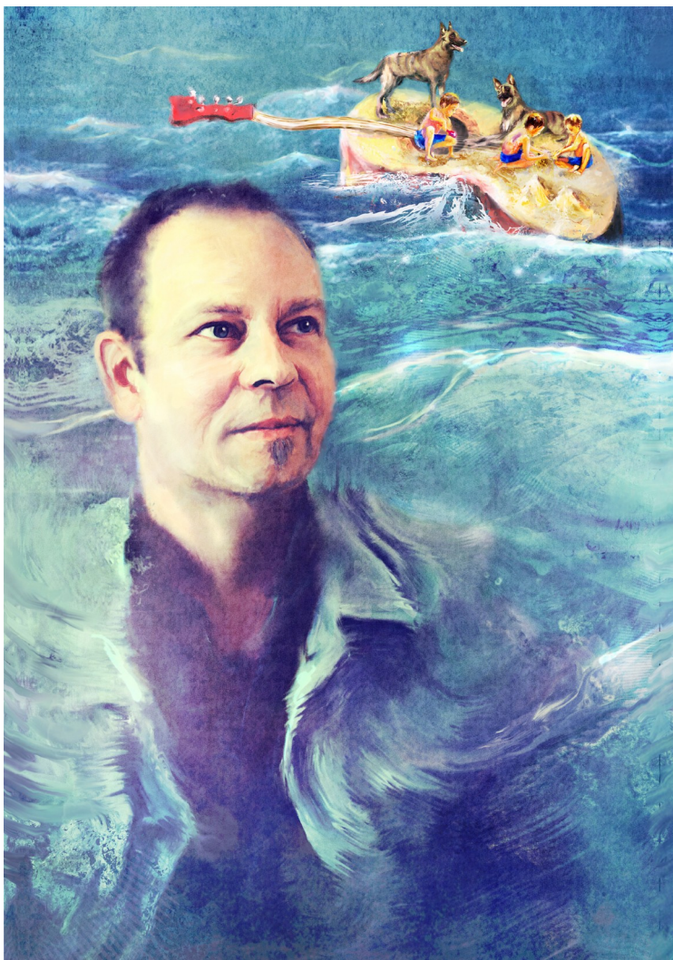
Kuva 5. Valmis digimaalaus.