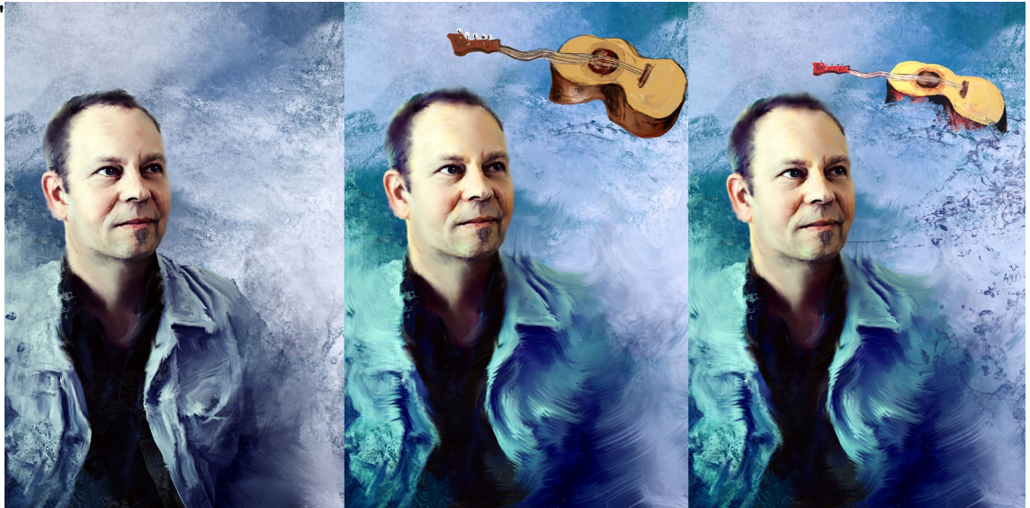
Kuva 4. Teoksen valmistuminen vaihe vaiheelta.