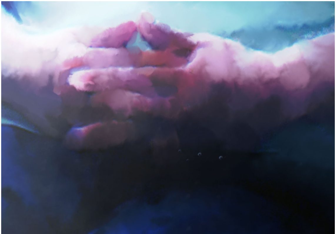
Kuva 3. Yksityiskohta keskeneräisessä vaiheessa.

netta erityisesti tehdessäni yksityiskohtia joissa pystyin vähän irrottautumaan omasta tavastani normaalisti tehdä kuvia. (kuva 3) Lopullisiin kuviin käytin vielä eri tekstuureja, sillä en halunnut kuvista liian siloisia. Tein monia eri versioita jokaisesta kuvasta ennen kuin tulin lopulliseen tulokseen. Työstin kuvia noin kolmen kuukauden ajan. (kuva 4, 5) Minulla kesti kuvien tekoon huomattavasti pidempi aika, kuin olin alun perin suunnitellut. Saatuani kuvat valmiiksi lähetin ne Joensuuhun Punamustalle painoon. Minulla oli neljä pystykuvaa ja kaksi vaakakuvaa osallistujien toiveiden mukaisesti. Kuvat tulostettiin suoraan Wiscom-levylle A2-kokoisina. Seuraavalla viikolla kuvat laitettiin esille Rediksen tiloihin. Kuvia saattoi käydä katsomassa tammikuun ajan, ja sen jälkeen ne luovutettiin osallistujille (kuva 6, 7).