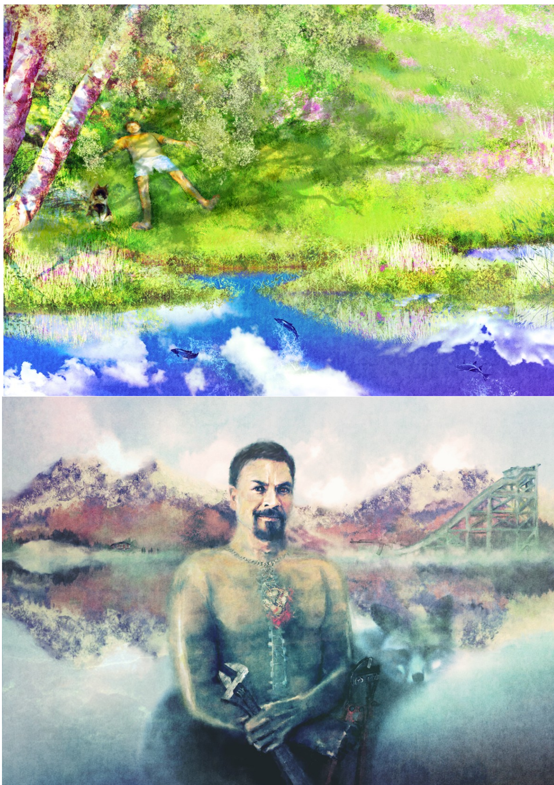
Kuva 7. Valmiita digimaalauksia.