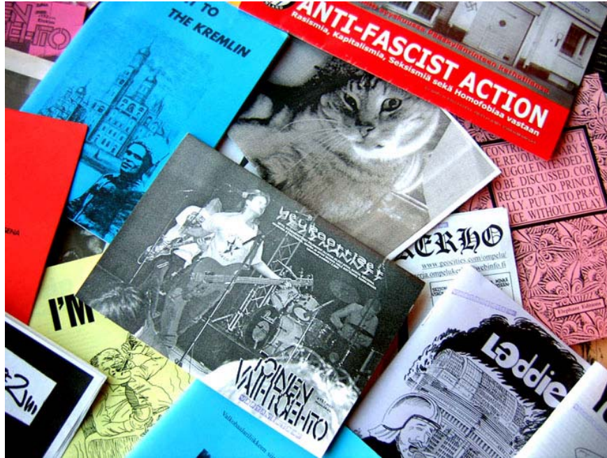
Pienlehtiä ja pamfletteja 1990-luvun lopulta.

1990-luvun suomalainen vaihtoehtoliike, josta liiketutkijoiden parissa käytetään nimitystä ympäristöprotestin neljäs aalto (Juppi ym. 2003, 9-10) kehittyi 1990-luvun alkuvuosikymmeninä. Sen taustalta, 1990-luvun alkuvuosilta, taas löytyy suhteellisen aktiivinen toimintajakso, jota leimasi anarkisti- ja antifasistiliike. Näiden juuret puolestaan voidaan johtaa 1980-luvun punk-liikkeeseen.