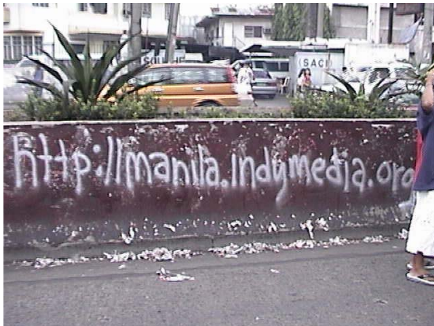
2000-luvun taitteen merkittävin vaihtoehtomedia lienee Independent Media Center, jolla on useita kymmeniä toimipisteitä eri puolilla maailmaa. Kuvassa Manilan Indymedia Filippiineillä mainostaa verkkosivujaan DIY-henkisellä kadunvarsikampanjalla.

Sitä valtamedian kohderyhmäajattelua VAI rikko ihan kymppillä ja toimi hyvin. Kun ei ollut mainostajia joille tarvitsisi sitä myydä mitään, niin kohderyhmää ei tarvitse pystyä esittämään yhtä selkeästi. H5)