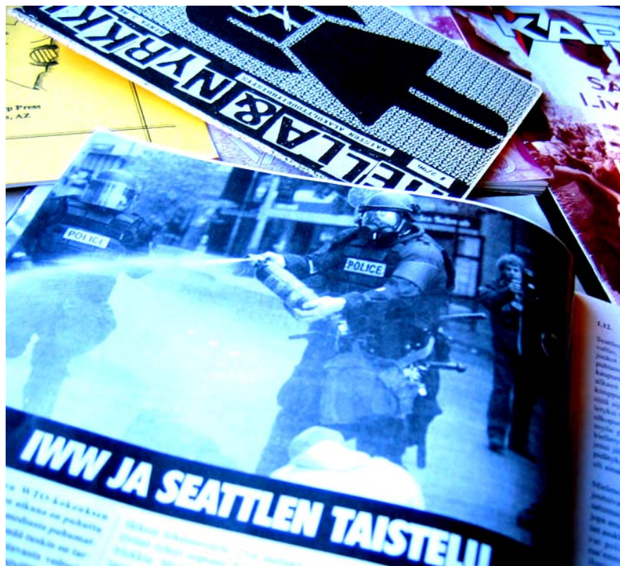
Globalisaatiokriittisen liikkeen toiminta ja kamppailut hallitsivat suomalaisten vaihtoehtolehtien otsikoita 2000-luvun taitteessa.

Omassa työssäni olen määritellyt vaihtoehtoiksi mediatuotteet jotka täyttävät vaihtoehtoisuuden kriteerit niin sisältönsä, tuotantoprosessinsa ja -organisaationsa kuin sosiaalisen kontekstinsa puolesta. Lisäksi pidän olennaisena sitä, että tekijät katsovat itse työskentelevänsä vaihtoehtomedian tai vaihtoehtoliikkeen median parissa.