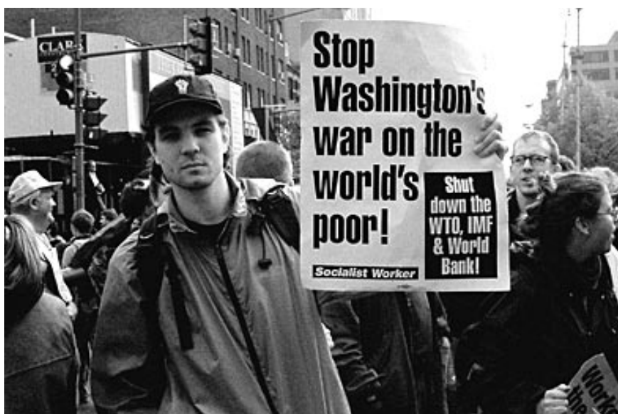
Protestit Maailmanpankkia, WTO:ta ja Maailman valuuttajärjestö IMF:aa vastaan keräsivät Yhdysvaltojen Seattlen kymmeniätuhansia mielenosoittajia vuonna 1999. Suurmielenosoitukset antoivat myös lisäyksen uudelle media-aktivismille.

Vaihtoehtomedioissa tämä muutos näkyi mm. valtakunnallisten tiedotuskanavien korvautumisella paikallisilla. Yhden valtakunnallisen Toimintakalenteri-lehden sijasta ryhdyttiin perustamaan paikallisia tiedotuskanavia, useimmiten sähköpostilistoja. Internetin kautta taas oltiin yhteydessä kansainvälisiin liikkeisiin ja otettiin osaa niiden projekteihin. Varsinainen globalisaatioaktivismi 11 ponnahti näkyviin vuoden 1999 Seattlen protestien 12 myötä. Tämän liikkeen näkyvin toimintakausi voidaan sijoittaa vuosiin 2000 ja 2001. Samaan ajanjaksoon osuu myös uudenlaisen media-aktivismin rantautuminen Suomeen.