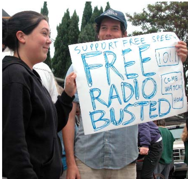
Media-aktivistit protestoivat paikallisen piraattiradion sulkemista vastaan Kaliforniassa lokakuussa 2004.

Vaikka enemmistö esimerkiksi suomalaisista medioista kutsuu itseään "sitoutumattomiksi" ja korostaa omaa objektiivisuuttaan, media-aktivistit muistuttavat, että tämä "objektiivisuus" merkitsee usein erilaisten kaupallisten etujen ajamista sekä niihin kiinteästi liittyvien valtarakenteiden tukemista.