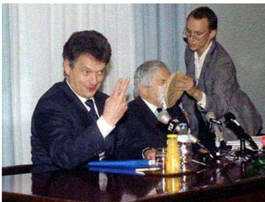
Näkyvyyttä omilla ehdoilla: Vaikuttavan tietotoimiston kautta myös valtamediaan levisi valokuva, jossa suomalaiset globalisaatioaktivistit heittävät kakulla Maailmanpankin pääjohtaja James D. Wolfensonia maaliskuussa 2001.