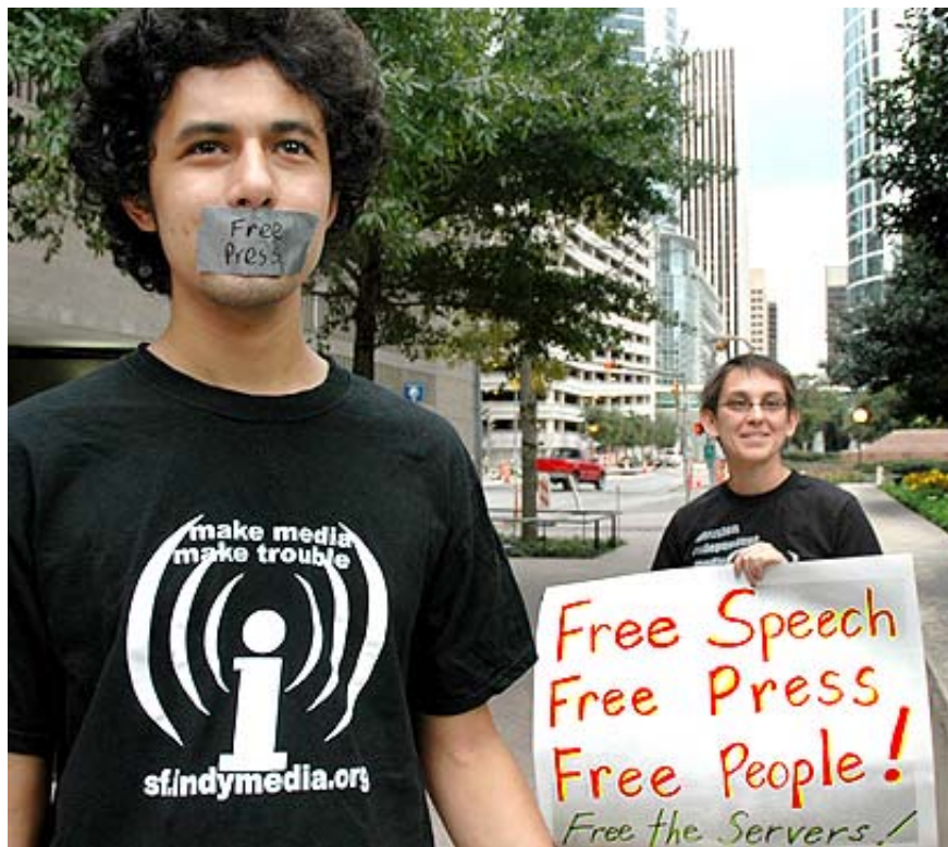
Make media, make trouble. Yhdysvaltalaiset indymedia-aktivistit osoittavat mieltään sananvapauden puolesta lokakuussa 2004.