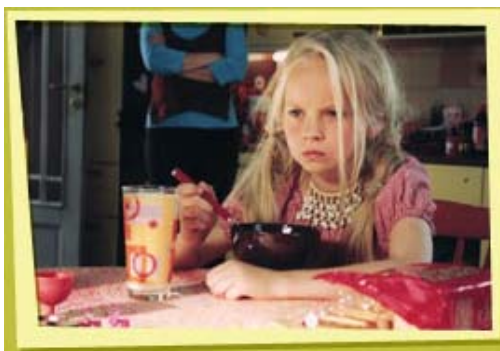
Kuva 5. Heinähattu on puhumaton.

Elokuvassa on kuitenkin käännekohta, jossa Heinähattu alkaa puhelakkoon ja muuttuu Vilttitossun kaltaiseksi. (Kuva 5.) Tätä korostaa se, että Heinähatun hiukset hapsottavat epäsiististi. Elokuvan lopussa kun Heinähattu lähtee kouluun hänellä ei enää ole punaisia vaatteita. Hän on saanut perheessään muutosta aikaan ja voi kasvaa koululaiseksi. Kasvun merkinä Vilttitossulla on hiukset siististi nutturilla pääläella.