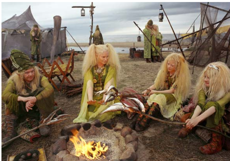
Kuva 11. Menninkäiset on häädetty omasta kylästään ja viettävät aikaa meren rannalla.

Milli Menninkäisen koti on sisustettu täyteläiseksi. (Kuva 12.) Tuvasta löytyy vain värejä, joita luonnosta löytyy. Päävärinä kuitenkin menninkäisille ominainen vihreä väri. Muutamia kirkkaita värejä on laitettu tuomaan eloisuutta muuten niin hämärään tupaan. Kattossa roikkuu kasveja muun muassa suuri keltainen auringonkukka, joka tuo keltaisuudellaan lämpöä sisälle mökkiin.