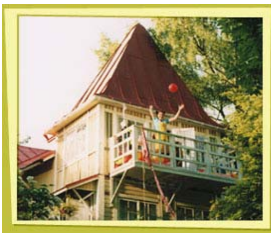
Kuva 6. Vesi-ilmapalloleikki parvekkeella.

Elokuvassa käydään myös Alibullenin neitien talon puutarhassa, joka on vastakohta Kattilakoskien pihamaalle. Kaikki on huolellisesti suunniteltu ja kukat kukkivat niille määrättyillä paikoilla. Kukkaloisto jatkuu sisälle Alibullenin neitien taloon, josta joka huoneesta löytyy kukka kuvioita. Sää vaihtuu tapahtumien mukaan. Kun kaikki ovat onnellisia, aurinko paistaa (kuva 6). Kun taas tytöt ovat kadoksissa, nousee kova tuuli ja pilvet valtaavat sinisen taivaan.