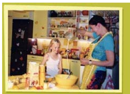
Kuva 7. Heinähattu ja äiti leipovat pullia.