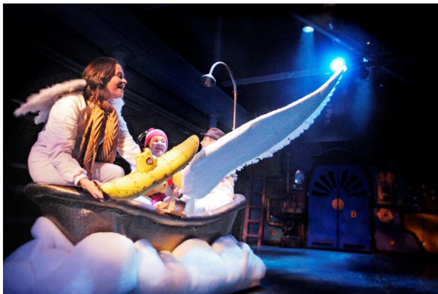
Kuva 2. Perhe enkeleinä kultaisessa ammeessa.

esityksessä katsoja ei pääse kyllästymään, sillä aina ilmestyi jotain uutta ja mielenkiintoista lavalle. Perhe lähti automatkalle vaaleansinisellä sarjakuvamaiseksi maalatulla autolla ja samaan pätyyn ilmestyi arvoituksellisesti laboratorio, jonka katolla linnunpesässä antennien ja pyykkinarun seassa lintutieteilijä Kuikka asui. Ensimmäisen kerran nähtiin enkelit työntämässä kolariautoa taivaaseen. Kolariauto ilmestyi, kun oli selvinnyt Ruun olevan orpo. Tunnelma oli hyvin raskas ja hieman hämmentävä. Lisää mielenkiintoisia kohtauksia oli, kun perhe lensi kultaisella kylpyammeella enkelinsiivet liehuen (kuva 2) taivaspätyyn portista sisään. Kultainen amme kuvasti hyvin taivaallista valoa, jonka perhe oli saavuttanut enkeleiksi muuttuessaan. Haikean mielen ja monen katsojan kyyneliin sai Reea ilmestyen enkelinä pilvenpäällä leijuen.