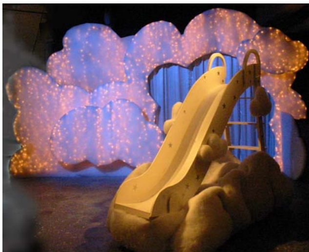
Kuva 4. Enkelien liukumäki ja taustalla taivaspääty.