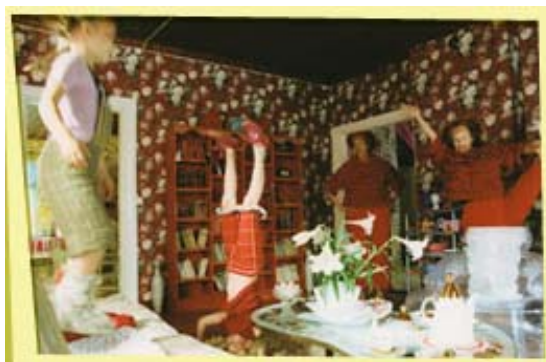
Kuva 9. Voimisteluhetki Alibullenin neitien olohuoneessa.

Alibullenin neitien olohuone on täyteläisen koristeellinen vaaleanpunaisine buffiverhoineen. Huoneessa katseen vangitsee iso kukallinen tummanpunapohjainen tapetti (kuva 9). Olohuoneessa on paljon erilaisia tavaroita, jotka ovat vielä eri tyyllisiä; muovinen puhallettava nojatuoli, barokkityylinen sohva, lasihyllykkö ja yksinkertainen punainen kirjahylly, joka toimii hyvin elokuvassakin kiipeilytelineenä. Hyllyköt ovat vielä täynnä pieniä esineitä. Huone tarjoaa hyvän ilmapiirin ideoiden syntymiselle, mutta siellä niitä ei pysty loppuun saakka viemään. Heinähatun ja Vilttitossun olohuone on myös lämminsävyinen. Oranssi sohva kertoo elinvoimasta, jota talosta löytyy. Elokuvassa olohuoneessa tapahtuvia kohtauksia tukee oranssisävyisyys. Auktoriteetti: vanhemmat käskvät Heinähattua nukkumaan, voima: Vilttitossu kerää kaiken huomion loukkaannuttuaan, viehätysvoima: vanhemmat viettävät yhteistä aikaa.