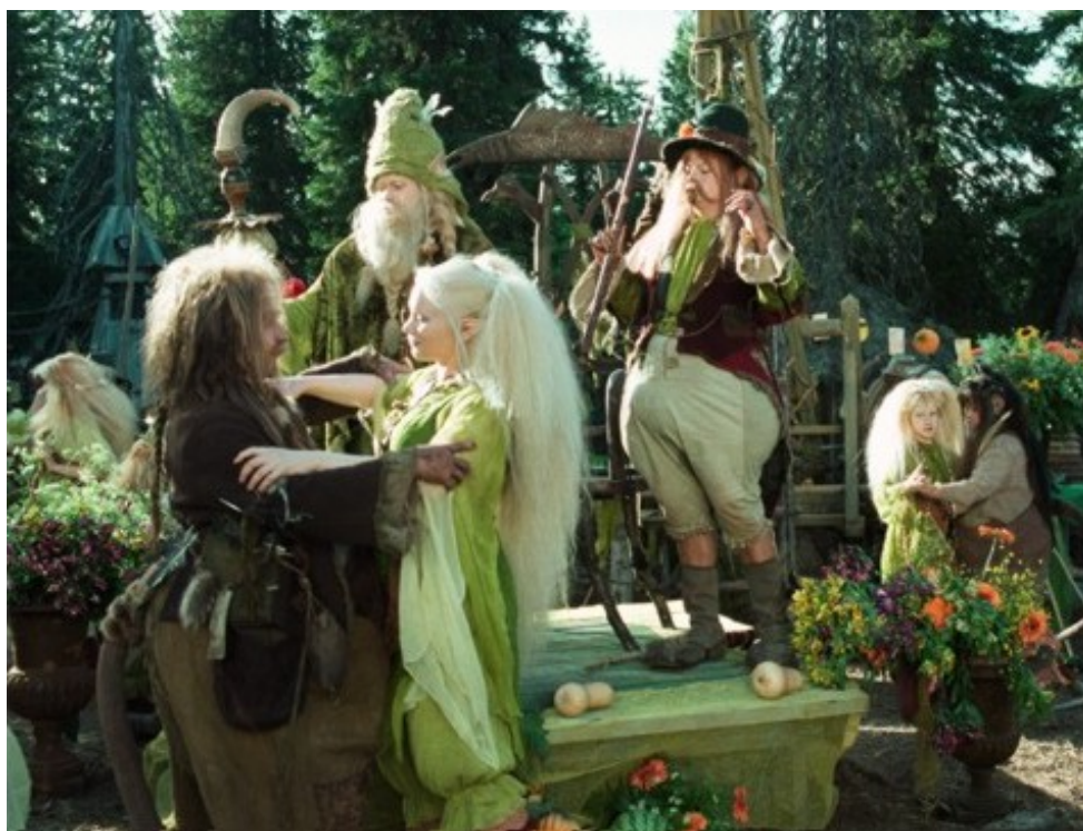
Kuva 13. Hyvä voittaa pahan ja menninkäistenkylään saapuu jälleen rauha.

Fantasia elokuva Rölliä on saatu upeasti näyttämään aidolta ympäristöltä käyttämällä vain luonnon omia värejä. Elokuvan värimaailmaa hallitseva metsänvihreä tuo pelottaviin kohtauksiin turvallista varmuutta. Metsä elää väritykseltään ja niin myös ovat eläväisiä röllit ja menninkäiset. Lavastus ja puvustus tukevat tarinaa metsäneläjästä.