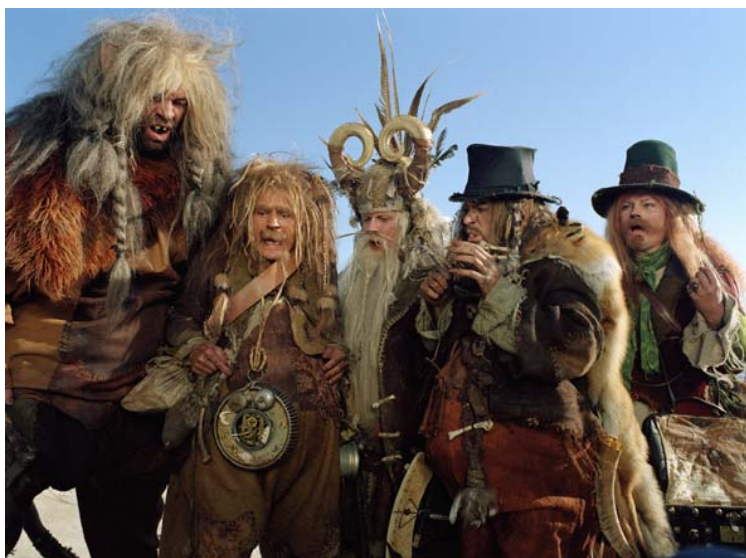
Kuva 10. Rölli-heimo saapuu uuteen maahan.

Röllit eivät pidä mistään kauniista. He haluavat olla hirmuisia. (Kuva 10.) Ruskea voittoiset maanläheiset puvut korostavat tätä luonnetta oivallisesti. Risuiset hiukset ja parrat kertovat, että röllit pitävät enemmän hölmöilemisestä kuin järjestelmällisestä työnteosta. Tarinassa ei kerrota, mistä röllit ovat lähtöisin. Röllit ilmestyvät mereltä hämyisen usvan keskellä salaperäisesti meloen. Tunnelma on mystinen ja harmaan sinertävä usva saa olon kylmäksi. Rantauduttuaan uuteen maahan alkaa aurinko paistaa ja tuntemattoman maan kullan hohtoinen hiekkaranta tuntuu kotoisalta.