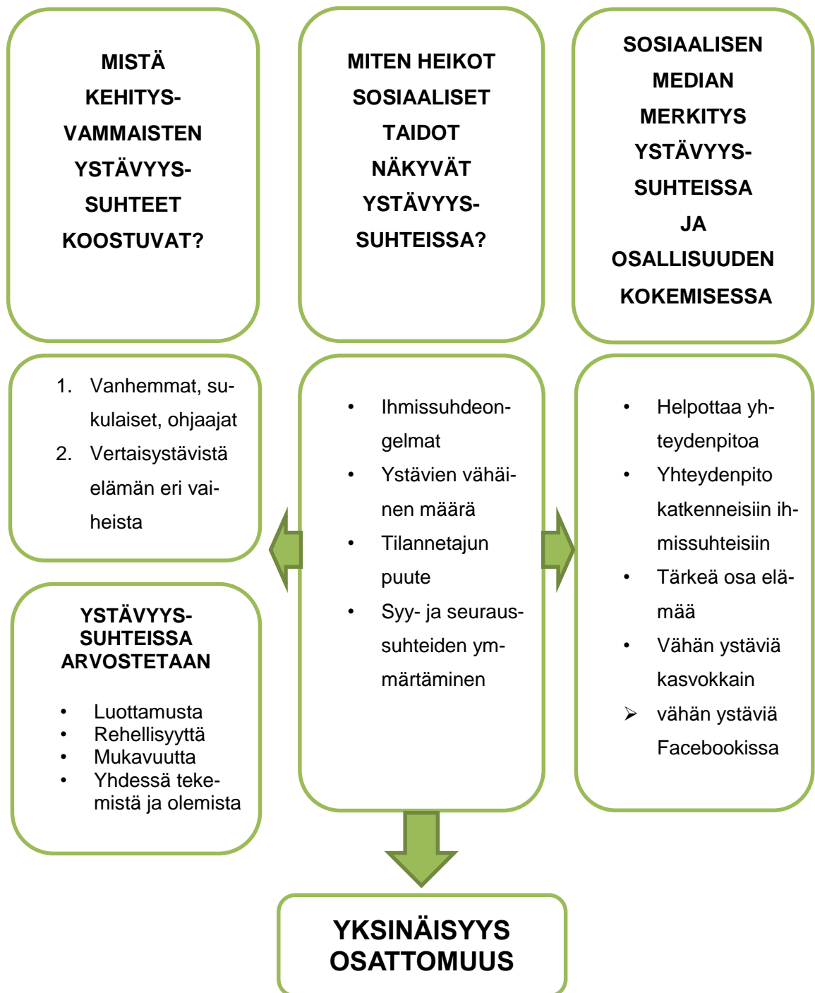
Kuvio 2. Keskeisimmät tutkimustulokset