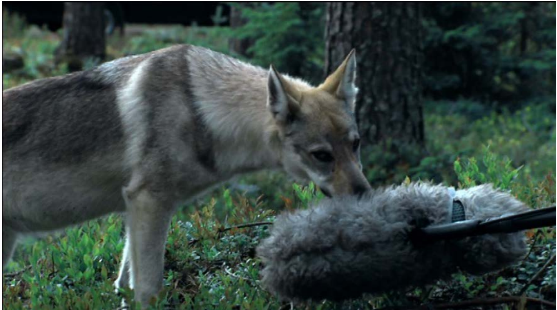
KUVA 2. Koulutettu susi tutkii mikrofonia. (Villi katse 2006)

Kun uutta eläintä lähestytään ensimmäistä kertaa, kannattaa asettaa itsensä eläimen silmien tasolle. Kun ihminen on samalla korkeudella eläimen kanssa, tämä ei tunne itseään uhatuksi. Silmien korkeudella pysyttely ja muu alistuva käyttäytyminen eläimen seurassa on tärkeää eteenkin, jos eläin vaikuttaa vetäytyväiseltä ja pelokkaalta. Lisäksi, puhuminen matalalla ja rauhallisella äänensävyllä voi helpottaa eläimen lähestymistä. Näillä keinoin saadaan eläin luottamaan kuvaajaan. (Hess 2014.) Tutustumisvaiheessa kannattaa myös tarkkailla sitä, miten eläin käyttäytyy omistajaansa kohtaan, sillä se heijastaa niitä kuvausmahdollisuuksia ja potentiaalia, mitä eläimessä on. Eläinten videokuvaaminen on kuitenkin paljon vaativampaa, kuin ihmisten, joten kuvauksiin kannattaa varata paljon aikaa ja ylimääräisiä muistikortteja. (Walker 2009, 38.)