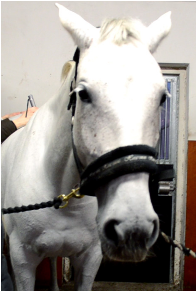
KUVA 3. Ärtynyt hevonen luimistaa korviaan.

Kannattaa myös seurata hevosen hännän liikkeitä. Kun hevosen häntä on koholla, tämä voi hyvin ja on aktiivisella tuulella, mutta jos häntä riippuu alhaalla, hevonen on joko hyvin väsynyt tai kokee kipua. Suuttuessaan hevonen saattaa heiluttaa häntäänsä vimmatusti puolelta toiselle. (Morris 1988, 29–31.) Muita ärtymyksen tai suuttumuksen merkkejä voivat olla muun muassa maan kuopiminen kaviolla tai silmän valkuaisten näyttäminen. Hevosen omistajan kannattaa olla lähes poikkeuksetta läsnä kuvauksissa, sillä tutun ihmisen läsnäolo lievittää hevosen stressiä. Eteenkin, jos hevoset ovat kuvaajalle vieraita eläimiä, omistaja pystyy ohjeistamaan kuvaajaa kuvaustilanteessa. (Hess 2014.)