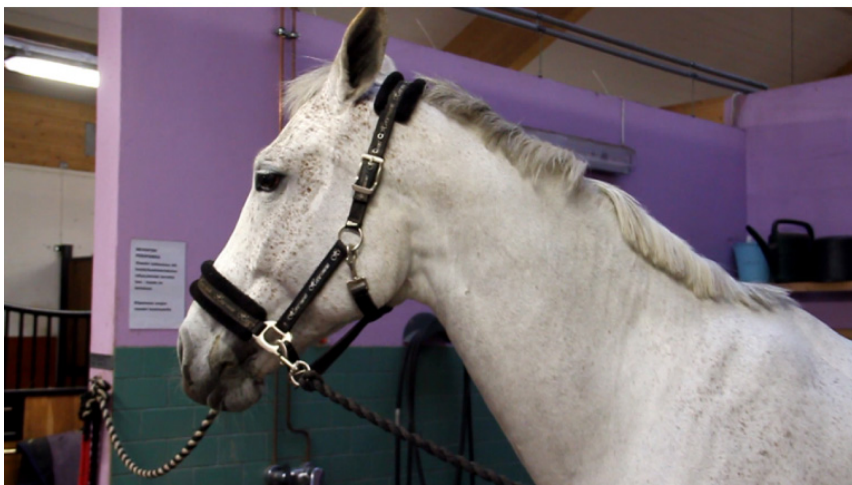
KUVA 4. Yllä liian tiivis kuvakoko hevosesta, alla oikea kuvakoko, jossa myös hevosen korvat näkyvät.

Tarkkaa käsikirjoitusta en kuitenkaan tehnyt tulevia kuvauksia varten. Kirjoitin itselleni ylös pelkästään listan hevosen toivotuista reaktioista, sekä muista asioista, jotka halusin saada kuvattua. Kuten Hess (2014) toteaa, turhan tarkkaa käsikirjoitusta ei kannatakaan tehdä, sillä suunnitelmat voivat muuttua milloin tahansa, ja silloin täytyy pystyä joustamaan.