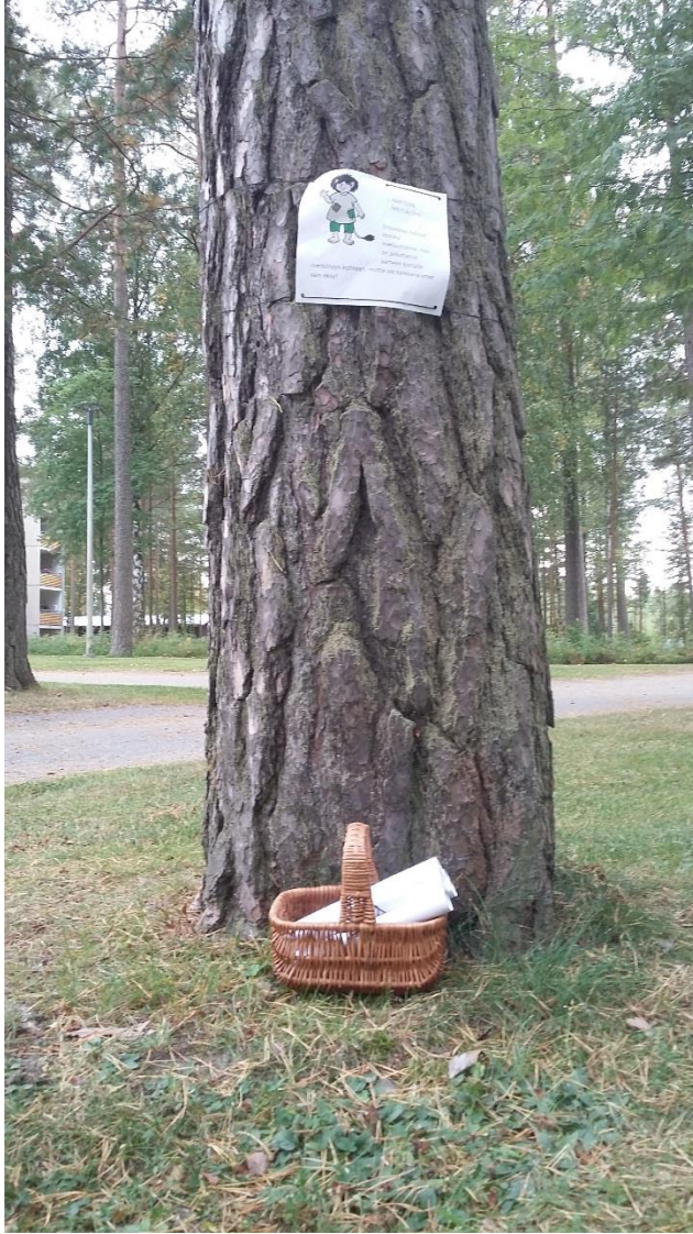
KUVA 3. Aarteen metsästys.

Diapeikko oli jättänyt perheille aarteeksi makkaraa ja vaahtokarkkeja, joita menimme grillaamaan kotaan kahvin ja mehun kanssa ( Kuva 4 ). Kodalla vuorovaikutus oli vapaa- muotoisempaa ja tunnelma kodalla oli rento. Lapset tutkiskelivat metsää omatoimisesti ja ihmettelivät luontoa.