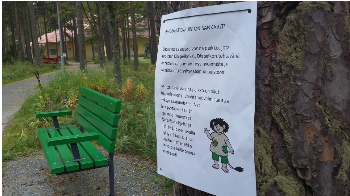
KUVA 1. Tehtävärata.

tarinaan ja joitakin tarinan peikko jopa hieman pelotti. Myös vanhemmat eläytyivät tarinaan lasten mukana. Puistossa ollessamme lapset kyselivät ja etsiskelivät peikkoa turvautuen ohjaajiin ja vanhempiin.