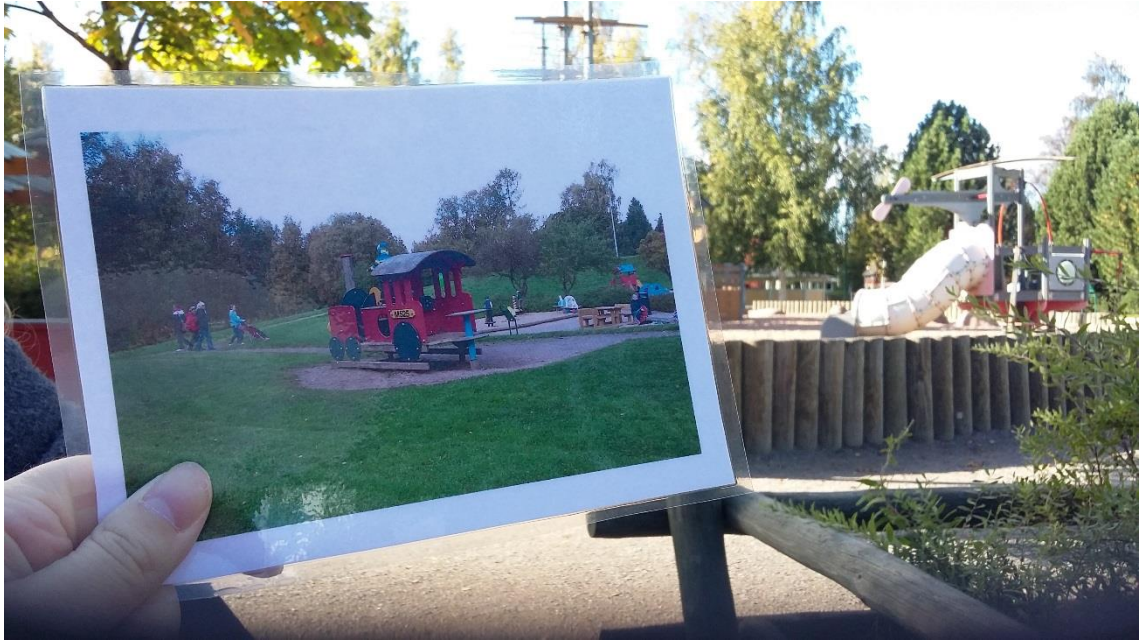
KUVA 5. Kuvasuunnistusta Pellehermannin puistossa.

Ohjaajina halusimme antaa vanhemmille ja lapsille täyden vastuun rastien löytämiseen joten vetäydyimme hieman sivummalle tarkkailemaan, miten suunnistus eteni. Alussa lapset olivat erittäin sitoutuneita toimintaan ja vanhemmat opastivat heitä mielenkiinnolla. Kuvasuunnistusrata oli kuitenkin melko pitkä ja puoleessa välissä suunnistusta lasten mielenkiinto siirtyi suunnistuksesta puistossa oleviin leikkivälineisiin. Vanhemmat kuitenkin kannustivat lapsia jatkamaan radan loppuun asti. Tuntui että vanhemmat olivat vähintään yhtä kiinnostuneita suunnistuksesta kuin lapset ehkä jopa enemmänkin.