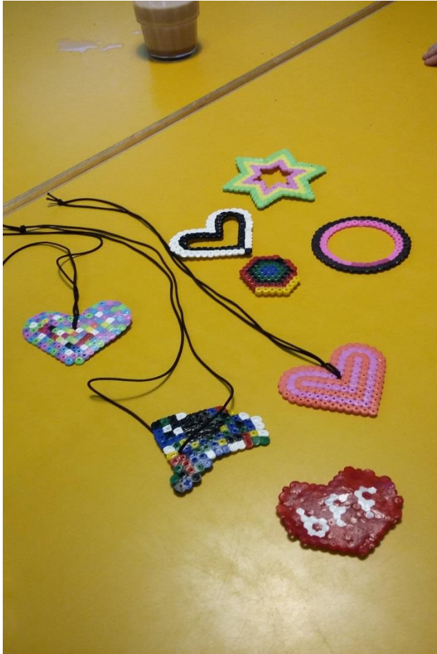
KUVA 7. Hamahelmiaskarteluja.

Magneettien ja korujen tekemisessä vierähti nopeasti sille varaamamme aika. Olimme taas järjestäneet kokoontumisen loppuun eväitä, joita menimme yhdessä syömään Porin Esikon tenavatupaan. Järjestimme tällä kertaa eväiden syömistä niin, että laitoimme lapset keskenään syömään omaan pöytään ja vanhemmat omaan. Halusimme tällä tavoin katsoa, miten lapset sekä vanhemmat ovat vuorovaikutuksessa keskenään.