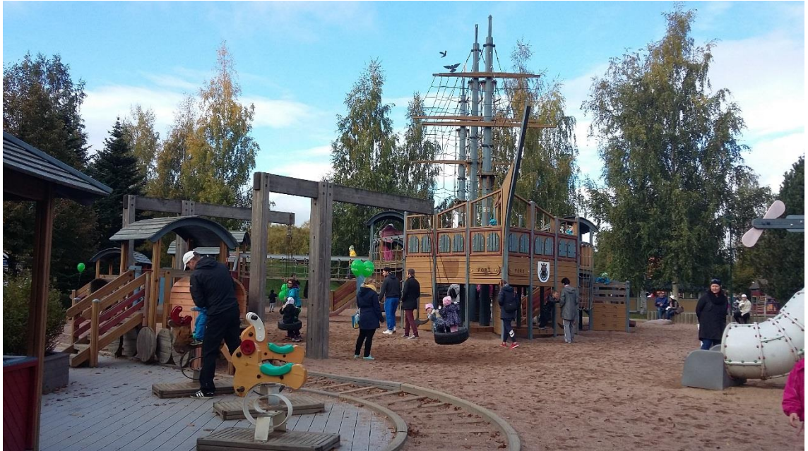
KUVA 6. Merirosvolaiva Pellehermannin puistossa.

Viimeisellä rastilla oli kuva taukopaikasta, jonne olimme vieneet eväitä. Menimme porukalla taukopaikalle ja söimme yhdessä eväät. Eväiden syönnin jälkeen vanhemmat jäivät juttelemaan keskenään taukopaikalle ja me ohjaajat menimme leikkimään lasten kanssa puistoon. Hetken ajan kuluttua pyysimme myös lasten vanhemmat mukaan leikkeihin.