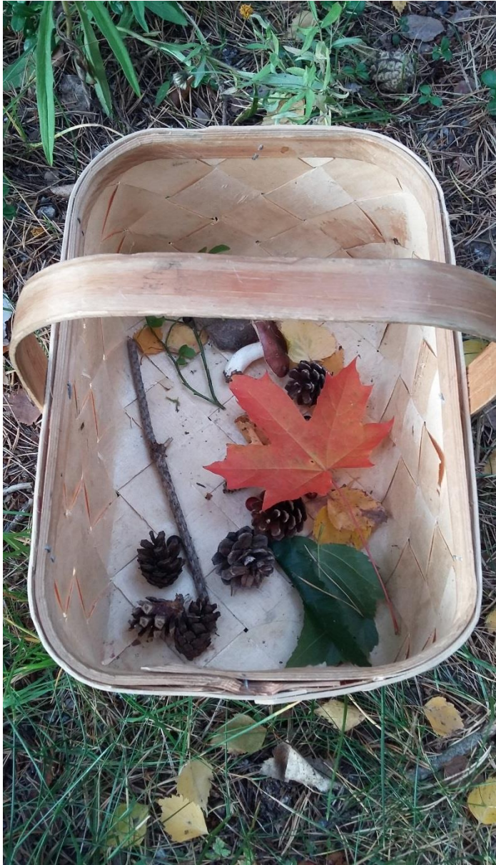
KUVA 2. Etsi luonnosta –tehtävä.

Toisella rastilla peikon tehtävänä oli esterata. Esterata koostui erilaisista liikunnallisista ja motoriikkaa vaativista tehtävistä. Esteinä olivat esimerkiksi tasapainoilulauta ja hämähäkinseitti. Liikunnallisten ja motoristen tehtävien avulla pyrimme tuomaan lasta ja vanhempaa lähemmäksi toisiaan. Esteillä lapset pyysivät aikuisen apua, jos este osoittautui liian mutkikkaaksi. Useimman lapsen mielestä esterata oli mieluisin rasti.