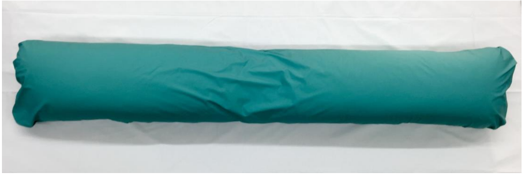
KUVA 6. Mega18040 iso ash-tyyny yleiskäyttöön, koko 40 x 180 cm