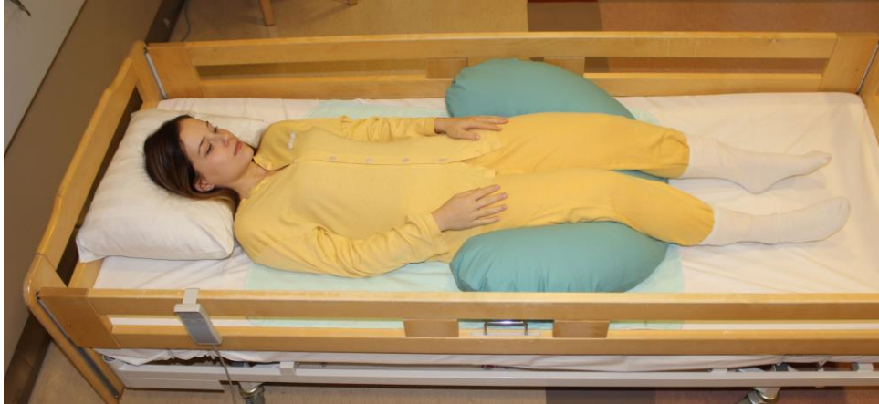
KUVA 8. Selinmakuu

Selinmakuuasennossa käytetään niskan alla tyynyä tukemassa kaularangan notkoa. Tyynyä ei laiteta hartioiden alle. Polvien alla yliojentumista ehkäisee tyyny. (Kukkonen & Piirainen 1990, 72.)