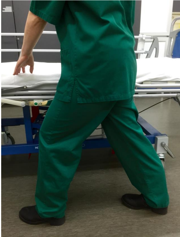
KUVA 12. Käyntiasento

Käyntiasennossa hoitajalla on paras tasapaino, alaraajoissa lonkkien, polvien ja varpaiden tulisi olla samaan suuntaan. Käännettäessä potilasta liukulakanan avulla kyljelleen, hoitajan paino siirtyy takana olevalle jalalle hänen nojattessaan taaksepäin. Hartiat tulee pitää alhaalla, jotta vältetään yläraajojen koukistuminen. Potilasta autetaan leveällä kämmenotteella sieltä, mihin liike tuntuu juuttuvan. Taakan pienemiseen auttaa kun hoitajan ja potilaan painopisteet ovat lähellä toisiaan. (Tamminen-Peter & Wikström 2013, 82 - 84, 90 - 91.)