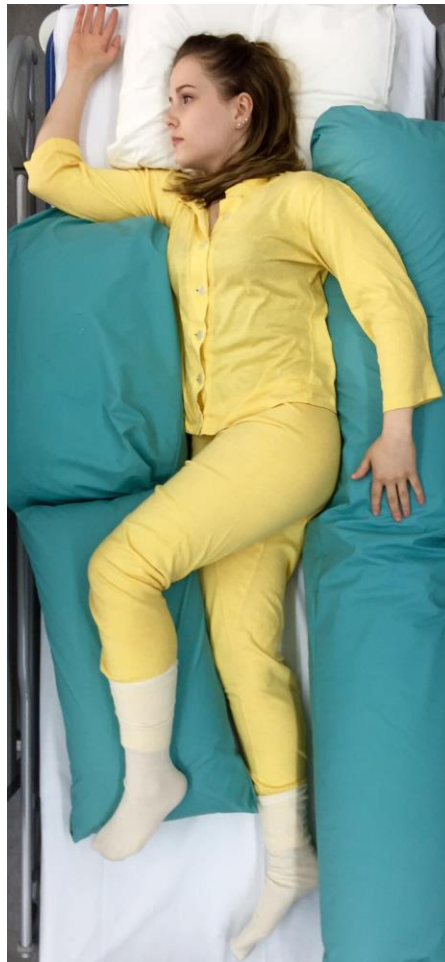
KUVA 9. Kylkimakuu

Kylkimakuulla selän suora asento tuetaan ja taaksepäin kallistuminen ehkäistään selän taakse aseteltavien tyynyjen avulla. Päällimmäinen jalka ja käsi koukistetaan eteenpäin ja niiden alle laitetaan tyyny. Alimmainen käsi loitonnetaan olkapään alueen vaurioiden ehkäisemiseksi. (Iivanainen ym. 2012, 116.)