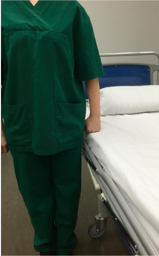
KUVA 11. Sängyn oikea korkeus ergonomista työasentoa varten.

Asentohoitoa toteutettaessa hoitajien tulee kiinnittää huomiota asennonvaihtotekniikkaan. Oman fyysisen kunnon ylläpitäminen ja oman kehon hallinta auttavat ehkäisemään loukkaantumisia. Asennonvaihdon toteuttaminen on hyvä suunnitella etukäteen, jotta se toteutuisi mahdollisimman turvallisesti sekä potilaalle että hoitajille. Potilaan omat voimavarat otetaan huomioon ja tuetaan näin jäljellä olevaa toimintakykyä sekä edistetään kuntoutumista. Samalla myös hoitajan taakka vähenee. Asentohoidossa tulee välttää kurkottelua ja kumartelua, selkä tulee pitää mahdollisimman pystyssä asennossa jalkojen yläpuolella. (Tamminen-Peter & Wikström 2013, 82 - 84, 90 - 91.)