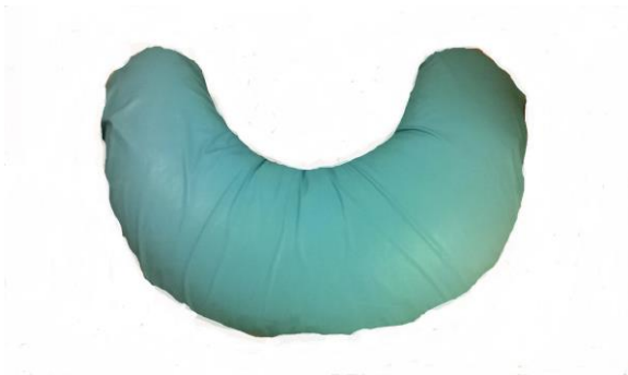
KUVA 7. MegaQ kaarityyny kylki- asentohoitoon sekä ylä- ja alaraajojen asentohoitoon, koko 27 x 80 cm

Tyynyjä apuna käyttäen potilas tuetaan mahdollisimman tasapainoiseen asentoon, jossa hänen on mahdollisuus saada aistimuksia luonnollisesta ja toimivasta asennosta (Kukkonen & Piirainen 1990, 70 - 71).