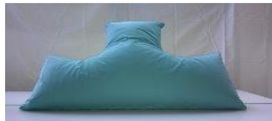
KUVA 5. MegaT alaraajoille estämään koukistumista, koko 80 x 60 x 32 cm