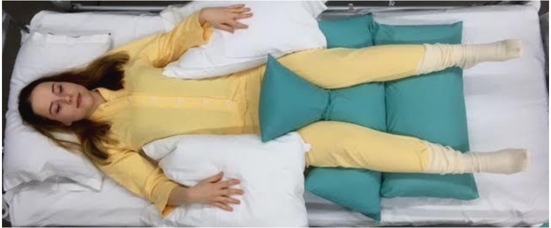
KUVA 10. Psoas-asento

Psoas-asennossa lonkankoukistajalihakset lepäävät ja kuormitus lanneselän alueella pienenee. Asento mahdollistaa lihaksien rentoutumisen ja siksi se on hyvä pitkään vuodelevossa olleelle potilaalle. (Rautava-Nurmi ym. 2015, 175.)