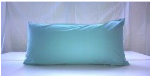
KUVA 4. Mega7040 yleiskäyttöön, koko 70 x 40 cm

Asennon tukemista helpottamaan voi käyttää asentohoitotyynyjä (kuvat 4 - 7), joiden avulla myös ehkäistään ylimääräistä painetta ja parannetaan verenkiertoa (Kukkonen & Piirainen 1990, 70 - 71).