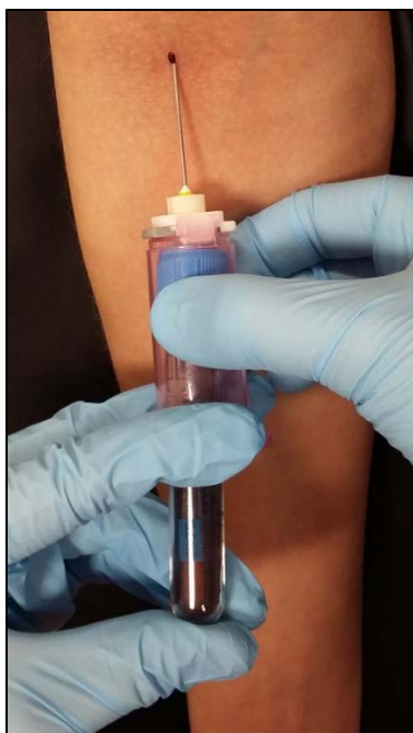
KUVA 4. Hyvä ote ja putken laittaminen paikalleen holkkiin