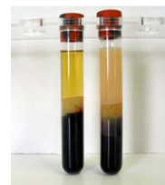
KUVA 7. Lipemia (Capital Health 2015.)