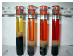
KUVA 6. Hemolyysi (Capital Health 2015.)