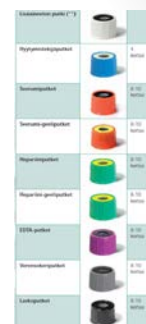
KUVA 2. Putkijärjestys (Mekalasi 2013.)