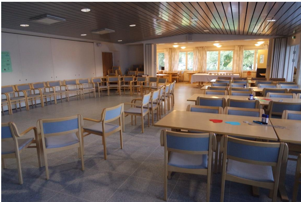
KUVA 2. Seurakuntasali valmiina ottamaan seniorit ja juniorit vastaan