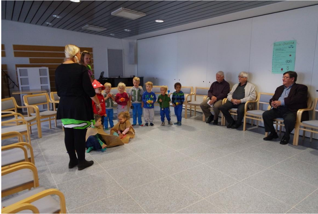
KUVA 5. Lasten peikkoesitys senioreille

Esityksestä siirryttiin suoraan askartelemaan nimilappuja, joihin olimme tehneet jo aihiot valmiiksi. Askarteluaihiot olivat osittain valmiina, koska toiminnallisen tuokion aika oli rajallinen. Seniorit saivat tehdä itselleen nimilapun sekä auttaa lapsia tekemään samanlaisen myös. Nimilappu oli sydämen muotoinen pahvi, johon olimme tehneet reiät valmiiksi naruja varten. Seniorit auttoivat narun kiinnittämisessä ja lapsen nimen kirjoittamisessa. Kukin lapsi ja seniori sai myös liimata omaan nimilappuunsa kaksi enkelikiiltokuvaa. Nimilapuista tuli hienoja, ja yhdessä tekeminen heti aluksi aktivoi senioreita toimimaan. Askartelussa kaikki pääsivät osallistumaan ja jokaisella seniorilla oli tekemistä.