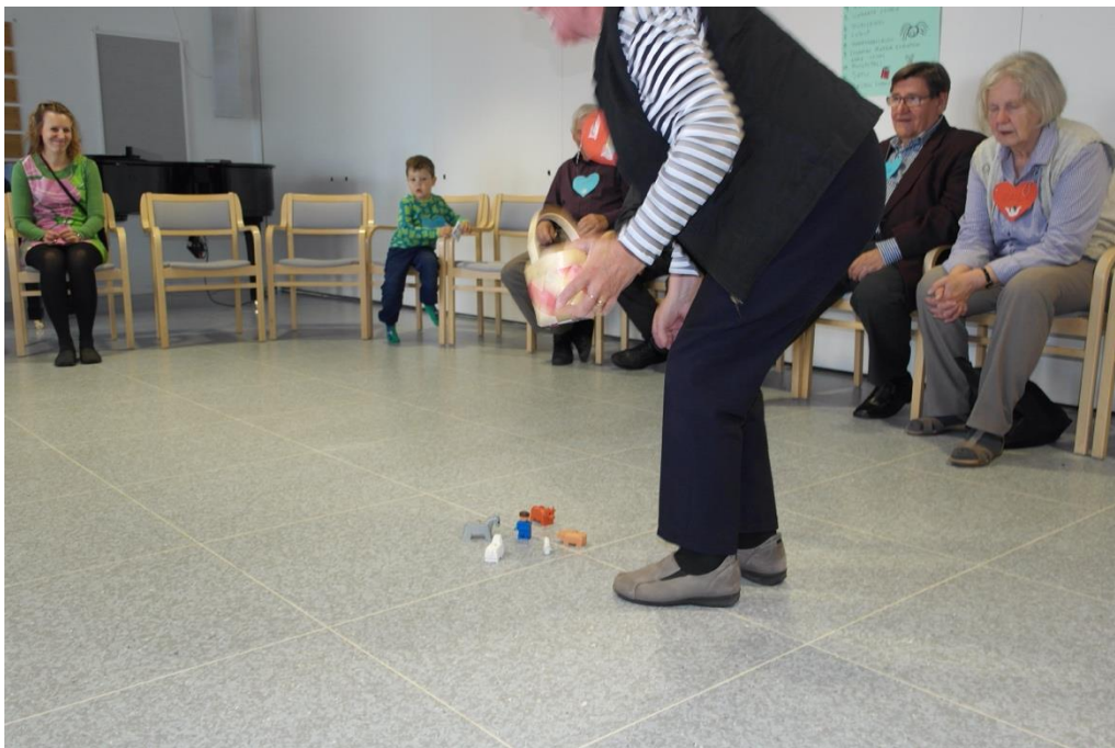
KUVA 11. Tässä käynnistyy muistipeli

Juontaja oli koko ajan pitänyt huolta ajan kulusta ja muistipelin aikana hän huomasi ajan olevan jo loppumaisillaan ja arveli myös lasten olevan jo väsyneitä. Ohjelmassa olisi vielä ollut satu, joka yhteisellä päätöksellä kuitenkin jätettiin välistä ja siirryttiin lasten loppulauluun sekä kerhorukoukseen. Seniorit seurasivat lauluesitystä ja osallistuivat rukoukseen laittamalla kätet ristiin. Kerhorukouksena oli "Pienet suuret ihmiset", joka sopi päivän teemaan. Tämän jälkeen pyysimme senioreita odottamaan sen aikaa, kun lapset täyttivät palautekyselyn. Lapset täyttivät kyselyn yhdessä meidän ja lastenohjaajien kanssa ja saivat sen jälkeen tikkarit kotiin vietäväksi. Lasten lähtiessä seniorit vielä kiittivät heitä yhteisestä tuokiosta. Tämän jälkeen yksi senioreista tokaisi suureen ääneen, että heillä oli ollut todella hauskaa, ja toivoi samanlaista tuokiota jo seuraavaksi tiistaiksi. Myös muut seniorit olivat samaa mieltä ja kommentin sanonut seniori vielä lausui, että "tällaista lisää"!