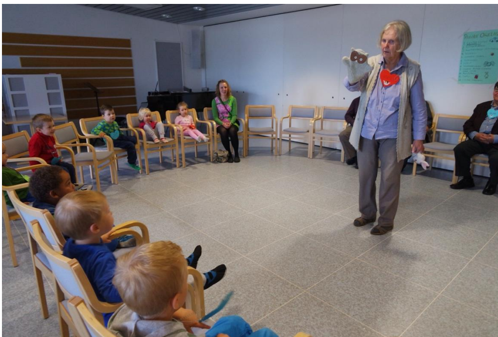
KUVA 7. Juontajana toiminut seniori esittelee käsinukkeaan

Leikkituokion jälkeen ehdotimme, että olisiko nyt hyvä kohta pitää lapsien evästäuko ja seniorit saisivat nauttia kahvinsa. Siirtyminen pöytiin sujui hyvin ja seniorit ja lapset sekoittuivat luontevasti. Lapset jaksoivat hyvin odottaa niin kauan, että kaikki olivat saaneet syömisensä pöytään ja päästiin yhdessä lausumaan ruokarukous lastenohjaajien johdolla. Kahvihetken aikana pöydistä kuului mukavaa puheensorinaa ja seniorit olivat auliisti auttamassa lapsia heti, kun he tarvitsivat apua. Ruokailun aikana myös ujoimmat seniorit uskaltautuivat vihdoinkin haikertumaan aktiivisesti lasten seuraan. Ruokailussa apukäsinä olivat myös lastenohjaajat. Kahvituksesta vastasimme me ja diakoniatyöntekijä, mikä mahdollisti sen, että Leskien Kahvilan seniorit saivat keskittyä lasten kanssa seurusteluun.