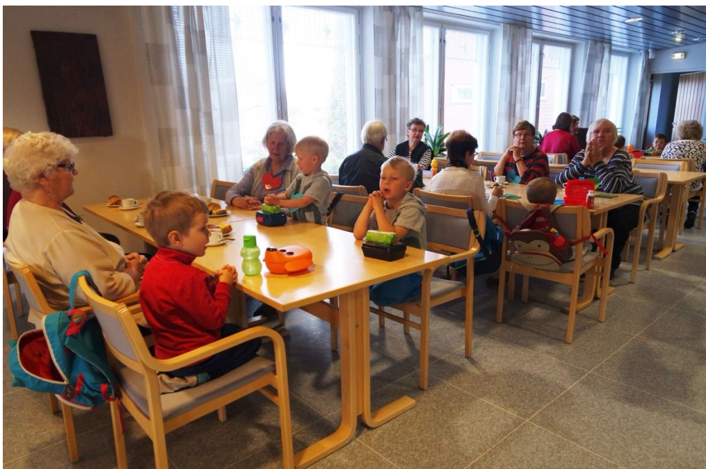
KUVA 8. Yhteinen ruokarukous ennen eväitä ja kahvihetkeä

Lasten eväiden syönnin jälkeen lapset saivat lattialle perhekerhon leluja, joilla he saivat leikkiä hetken vapaasti. Seniorit menivät istumaan omille paikoilleen piiriin ja katselivat hetken lasten leikkiä. Vapaan leikin jälkeen varalla ollut juontaja otti ohjat käsiinsä ja sai lapset keräämään lelut lattialta koriin pienen kilpailun avulla. Vapaa leikkihetki oli lapsille hyvä ruokailun jälkeen, jolloin ei tarvinnut istua ja keskittyä, vaan sai tehdä vapaasti mitä halusi. Lapset olivat koko toiminnallisen tuokion hyvin rauhallisia ja juoksentelevia lapsia ei nähty ollenkaan. Seuraavaksi lapset ja seniorit lähtivät kaikille tuttuun Piiri pieni pyörä -leikkiin, johon meillä oli taustamusiikkia. Lapset ja seniorit sekoittuivat piirissä mukavasti ja kaikilla tuntui olevan hyvin hauskaa, kun ”kädet sanoivat lip-lap-lap ja jalat sanoivat kip-kap-kap”. Lastenohjaajilla oli iso rooli laululeikeissä, sillä he osasivat hyvin laulujen koreografiat. Kahden tunnin mittaiseen suunnittelukertaan oli mahdotonta mahduttaa leikkien opettelua, mutta toiminnallisessa tuokiossa kaikki sujui hyvin ja he oppivat toinen toisiltaan. Opettelu olisi varmasti lisännyt paineita senioreille, ja oli mukava nähdä miten leikit palautuivat mieleen muistin sopukoista.