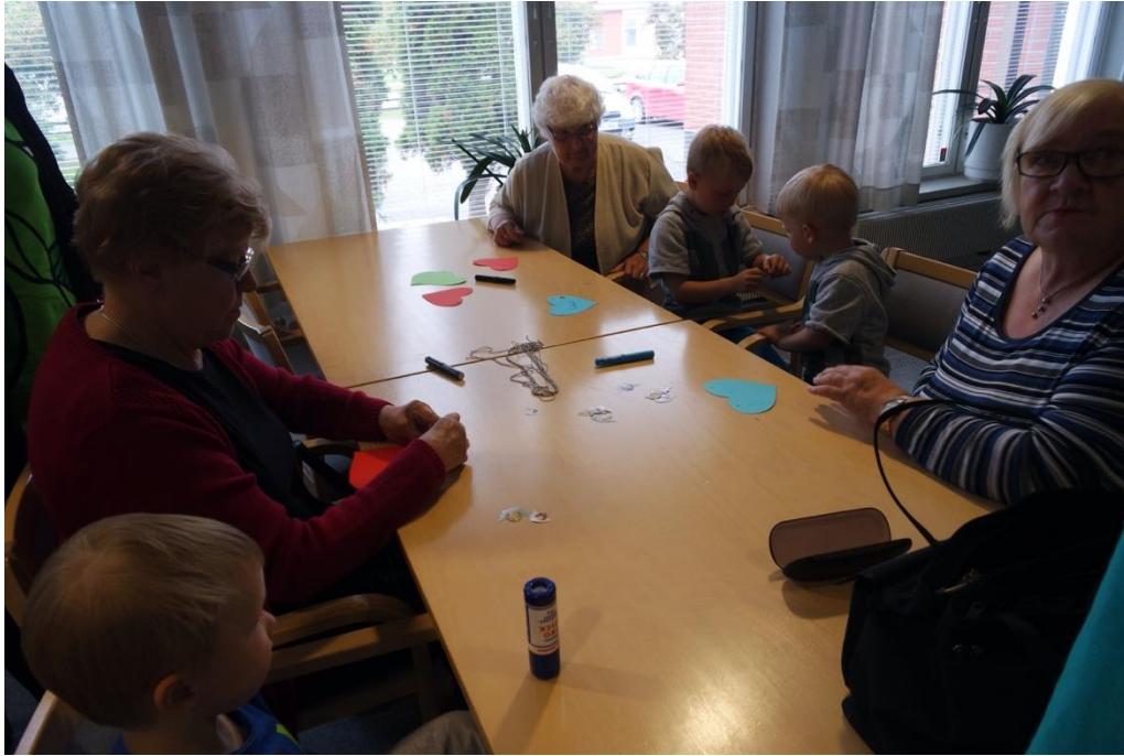
KUVA 6. Nimilappujen askartelua senioreiden avustamana

Huutokilpailun jälkeen juontajana toiminut seniori otti tuomansa käsinuket esille ja alkoi esitellä niitä luontevasti lapsille. Tässä kohtaa poikettiin vähän suunnitelmasta ohjelmasta, mikä saattoi hämmentää muita senioreita. Muut eivät oikein osanneet tulla mukaan käsinukkeleikkiin, vaan seurasivat sivusta. Tässä kohtaa myös lapset innostuivat matkimaan erilaisia eläinten ääniä käsinukkejen avustuksella. Käsinuket saivat seniorit spontaanisti aloittamaan laulun Pupujussikat.