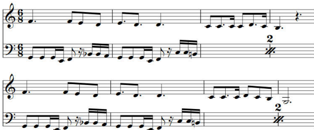
Kuva 8 - Breeders-kappaleen basso- ja kitarariffit

Otin kappaleen nimen samannimiseltä 90-lukulaiselta rock-bändiltä, jonka kappale "Saints" toimi jonkinlaisena alitajuisena inspiraationa kappaletta tehdessä (The Breeders, 1993). "Breeders" pohjautuu vahvaan bassoriffiin, jonka soittamista kitara ja piano vuorottelevat.