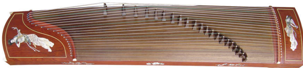
Kuva 6 – guzheng (www.supertimbre.com)

Tämä kappale on improvisoitu teos kiinalaisella guzheng-perinnesoittimella (sitä voisi kuvailla kiinalaiseksi kanteleeksi). Soittimen hankin vieraillessani Shanghaissa. Guzhengissa on hyvin tunnistettava ”kiinalainen” soundi, joka vahvistui entisestään viritettyäni soittimen kiinalaisessa perinnesuikissa usein hyödynnettyyn pentatoniseen asteikkoon. Tanssijat soittivat kellojen ääniä improvisaationi päälle. Aivan kaikissa esityksissä en mielestäni onnistunut luomaan hyväkuuloista äänimaailmaa, mikä sai minut miettimään olisiko tämäkin kappale pitänyt kirjoittaa ylös.