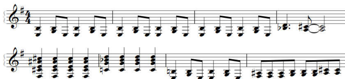
Kuva 3 - Ilotrio -kitarariffi

Tanssijoiden liikehdintä toi mieleeni John Travoltan ja Uma Thurmanin tanssikohtauksen elokuvassa Pulp Fiction. Tästä sain idean tehdä kappaleesta surf rockia Dick Dale -tyylisillä kitarasooloilla, erityisesti hänen coveroimansa ”Miserlou” -kappaleen hengessä (Dick Dale And The Del-Tones, 1962). Kappaleen pohjana toimii kitarariffi, joka jankkaa pientä terssiä. Rakastan riffien rakentamista pienen terssin varaan, mielestäni se on kaikista intensiivisin intervalli. Piano soittaa kitarariffin päälle bluesasteikkoon pohjautuvaa melodiaa oktaaveissa. Tässä ja monissa muissakin kappaleissa piano hoitaa bassorekisterin. Kappaleessa esiintyy lyhyt pianosoolo ja kaksi pidempää kitarasooloa. Näiden soolojen soittaminen oli tyydyttävää, sillä en ole koskaan pitänyt itseäni kovin kummoisena soolokitaristina.