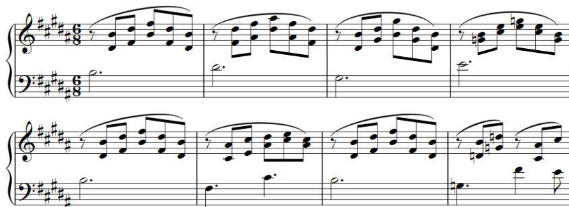
Kuva 7 - Soittorasia-kappaleen alkusoinnut

Tämä kappale on sävelletty pianolle, rumuille, huilulle, klarinetille ja soittorasiaille (jota esityksissä emuloi syntikka). Sirpa Möksy halusi kappaleen kuulostavan kuin soittorasialla soitettuna. Kappaleen alun sointuarpeggiot ovat vahvasti Franz Schubertin Ave Maria -kappaleen inspiroimia.