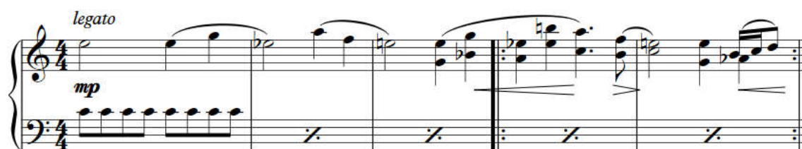
Kuva 5 - Unibiisin päätteema

Tämä kappale perustuu teemaan, johon törmäsin muutama vuosi sitten leikkiessäni kitaralla bändini treeniksellä. Taustalla on lähes koko ajan C-urkupiste samalla kun teema vaihtelee C-duurin ja -mollin välillä. Jostain syystä se tuo mieleeni klassiset Super Mario -pelit.