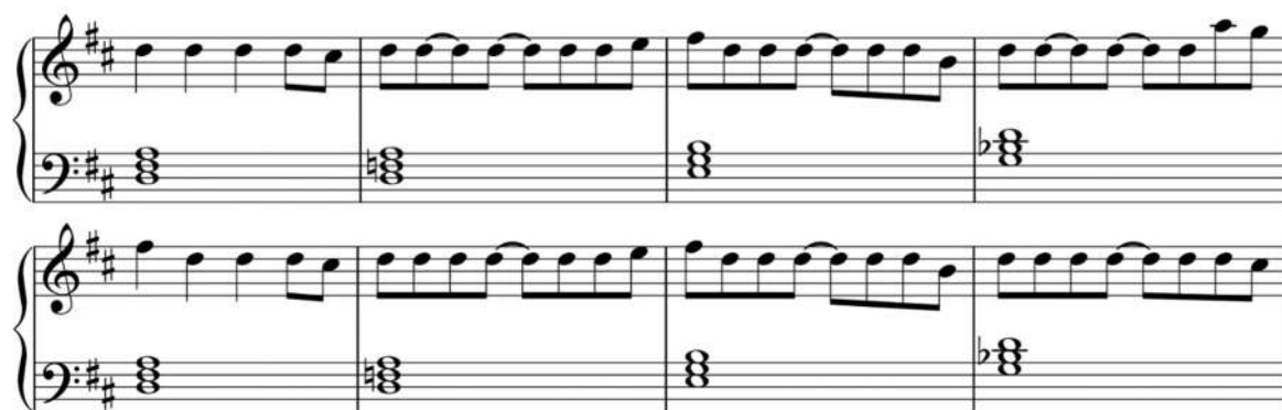
Kuva 12 - "Karnevaalin" kovasti pitämäni, simppele pianosoolo

Kappaleen lopun aloittaa kovasti pitämäni pianosoolo pelkkien rumpujen tukemana. Sen mukaan liittyvät yksitellen puhaltimet, samalla kun piano madaltaa melodiaansa oktaavi kerrallaan. Kitara ottaa melodian itselleen ja sooloilee sitä muunnellen hetken aikaa. Pidän tällaisesta pienestä muuntelusta ja leikittelystä. Kitara tapaa myös hieman Radioheadin "A National Anthem" -kappaletta (Radiohead, 2000). Lopussa kappale palaa aiempaan Pixies-riffiin ja kasvaa lopettaen "Unibiisin" teemaan koko bändin soittamana.