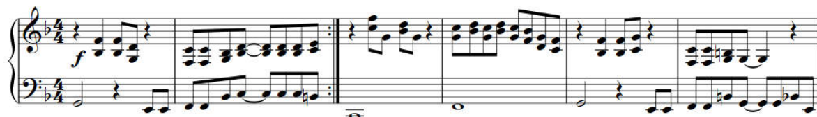
Kuva 2 - Kun päivänvarjo aukeaa - pianoriffi

Kappale alkaa pianolla, jonka melodia vaihtelee G- ja B-lyydisten asteikoiden välillä. Pianon seuraan liittyvät puhaltimet omalla kivalla melodiallaan. Alkuhempeyden jälkeen rummut aloittavat nopean kompmin, jonka kanssa piano ja kitara soittavat Sonic Youthin ”Teen Age Riot” -kappaleen inspiroivaa riffiä (Sonic Youth, 1988). Tämän päälle tulevat taas puhaltimet omalla melodiallaan, jota varioiden kappale toistuu noin minuutin ajan.