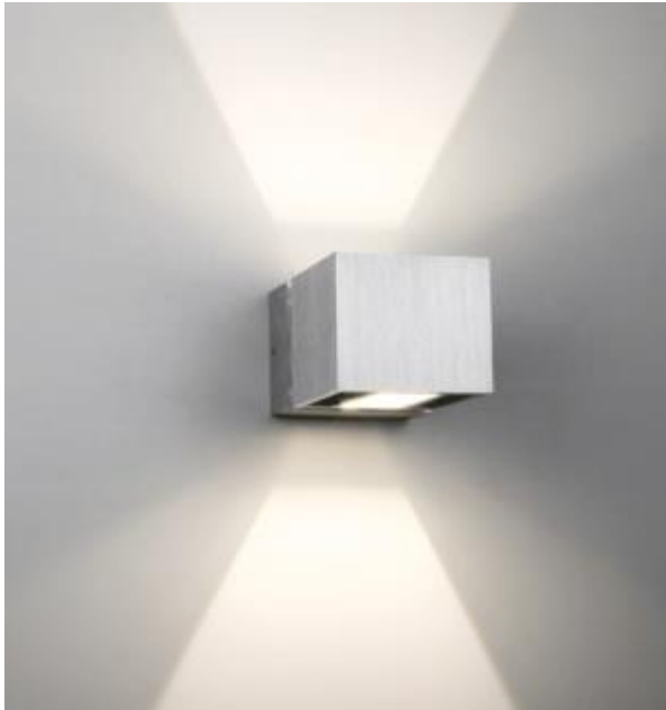
Kuva 4 Seinävalaistus, joka valaisee seinää pinnan myötäisesti, korostaen mahdollisia pinnan epätasaisuuksia [23.]

Tämän takia on tärkeää rakentaa laadukkaasti niin, että yritetään katsoa laatua asiakkaan silmin. Ei pidä unohtaa kuitenkaan RYL:in laatuvaatimuksia, vaan soveltaa niitä niin, että ne sopivat sekä yrityksen omiin että asiakkaan vaatimuksiin.