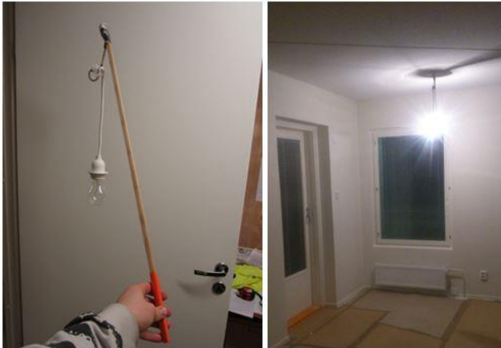
Kuva 2 As Oy Helsingin Loggian työmaan tarkastustilaisuuteen räätälöidyt kattovalot, helpottamaan asuntojen tarkastamista talven pimeydessä [20.]

Ensimmäisen tarkastustilaisuuden tarkoituksena on se, että asiakas pääsee tarkastamaan asuntonsa mahdollisten virheiden tai puutteiden varalta, työmaa on kuitenkin tässä vaiheessa tehnyt jo omat tarkastukset ja korjaukset. Kun asiakas saapuu tilaisuuteen, annetaan hänelle tarkastuslomake, jonka hän täyttää jos hän löytää virheitä tai puutteita asunnostaan, huonekohtaisesti. Tällöin asiakkaan listaamat virheet jäävät dokumentoiduksi työmaalle, joka korjaa kyseiset virheet ennen toista tarkastustilaisuutta. YIT:n asuinkerrostalokohde Asunto Osakeyhtiö Helsingin Loggia luovutettiin tammi-kuussa 2016 ja tarkastustilaisuudessa sekä käytönopastuksessa työmaalla asiakkaille annettiin tarkastuslomakkeen lisäksi mukaan myös kattovalo (Kuva 2), jota pystyy helposti siirtämään huoneesta toiseen. Tarkastustilaisuus oli talvella, joten asunnoissa oli pimeää, lukuun ottamatta keittiötä ja kylpyhuonetta, joissa on omat kiinteät valot. Kätevä ja hauska kattovaloviritelmä helpotti asiakkaita tarkastamaan asuntonsa, jos heillä ei ollut mukanaan omaa taskulamppua tai muuta valoa.