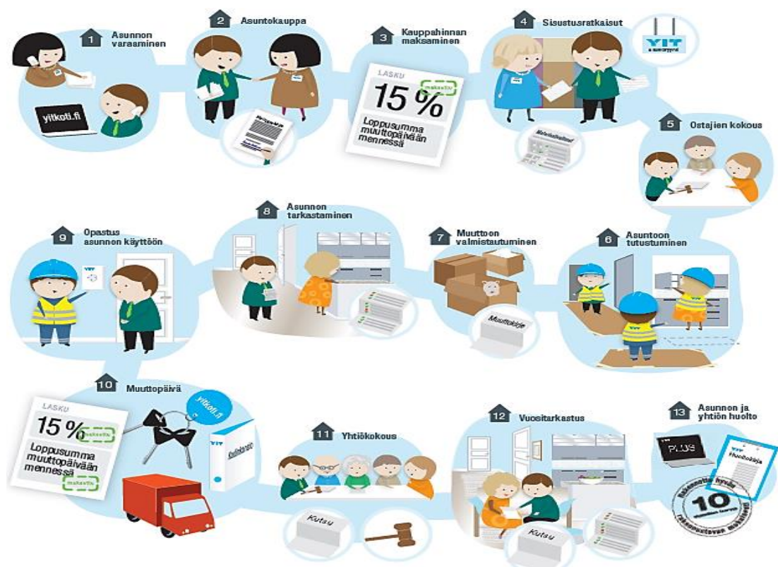
Kuva 1 Uuden asunnon askeleet, YIT:n infograafi (muokattu alkuperäisestä lähteestä) [18.]

Asiakkaan ostaessaan itselleen asunnon YIT:ltä, sen ollessa vielä rakentamisvaiheessa, kuuluu siihen kuvan 1 mukaiset askeleet. Nämä askeleet pätevät silloin kun asiakkaana on uuden kodin asukas tai asunnon ostanut henkilösijoittaja. Sijoittaja yrityksillä on yleensä hieman erilaiset käytännöt asuntojen tarkastuksiin.