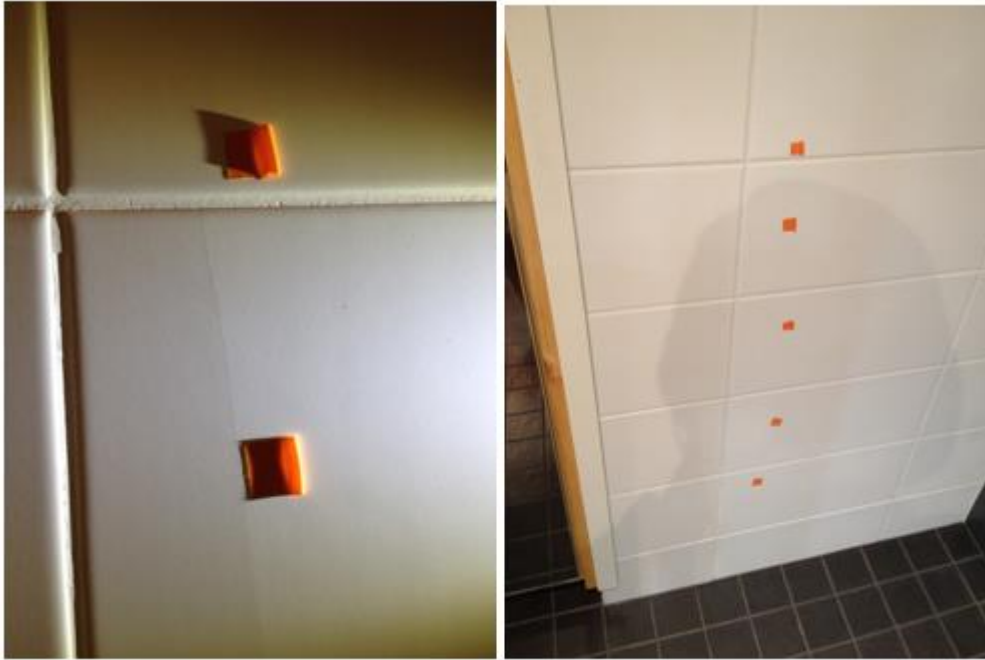
Kuva 5 Kylpyhuoneen seinälaatoista viisi on haljennut ja teipit virhekohtilla helpottaa asentajaa löytämään korjattavat virheet helpommin

Itselleluovutuksessa tarkoituksena on, että kyseisen työn suorittanut urakoitsija tarkastaa ensin itse omat työnsä ja korjaa mahdolliset virheet ja puutteet. Tämän jälkeen pääurakoitsija tekee omat tarkastuksensa ja merkitsee mahdolliset virheet ja puutteet teipillä pelipaikalle (kuvassa 5 on havainnollistavat valokuvat virheen merkkauksesta työmaalla) ja kirjaa omaan listaansa, sekä jaottelee ne niille urakoitsijoille, jotka ovat vastuussa niiden korjaamisesta. Esimerkki Excel-taulukko (Taulukko 2), jossa eriteltyinä työmaan porras, asunto, huoneet, havaittu virhe/puute, vastuu-urakoitsija, puutteen havaitsemispäivämäärä sekä merkintä jos virhe tai puute on korjattu. Taulukossa on etuna se, että pysyy hyvin perillä, mitä korjauksia on tehty ja mitä on tekemättä, koska jokaisen listassa olevan sarakkeen pystyy suodattamaan niin, että jäljelle jää esim. haluttu urakoitsija ja heidän korjaamattomat puutteensa.