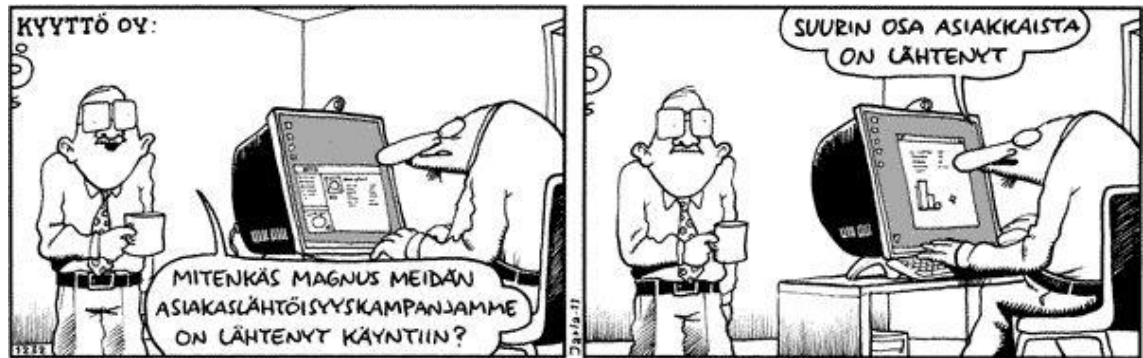
Kuva 6 Fingerpori 21.2.2011 [24.]

Asiakslähtöisyydellä tarkoitetaan sitä, että luodaan yrityksen toimintakulttuuri sellaiseksi, että pyritään selvittämään asiakkaiden tarpeita sekä tyydyttämään ne parhaimmalla mahdollisella tavalla. Rakennusalalla kilpailu asiakkaista on kovaa, koska markkinoilla on niin paljon tarjottavaa ja tämän takia asiakkaistakin on tullut vaativampia ja heillä on suuremmat odotukset lopputuotetta kohtaan. Asiakkaat siis odottavat, että heidän henkilökohtaisia tarpeitaan huomioidaan yhä enemmän ja tämän takia on tärkeää oppia tuntemaan omat asiakkaat. Ajattelutapaa olisi tämän takia hyvä muuttaa asiakkaalle tuotettavasta lopputuotteesta, asiakkaan kanssa yhteistyössä tuotettavaksi lopputuotteeksi. [6, s. 29.]