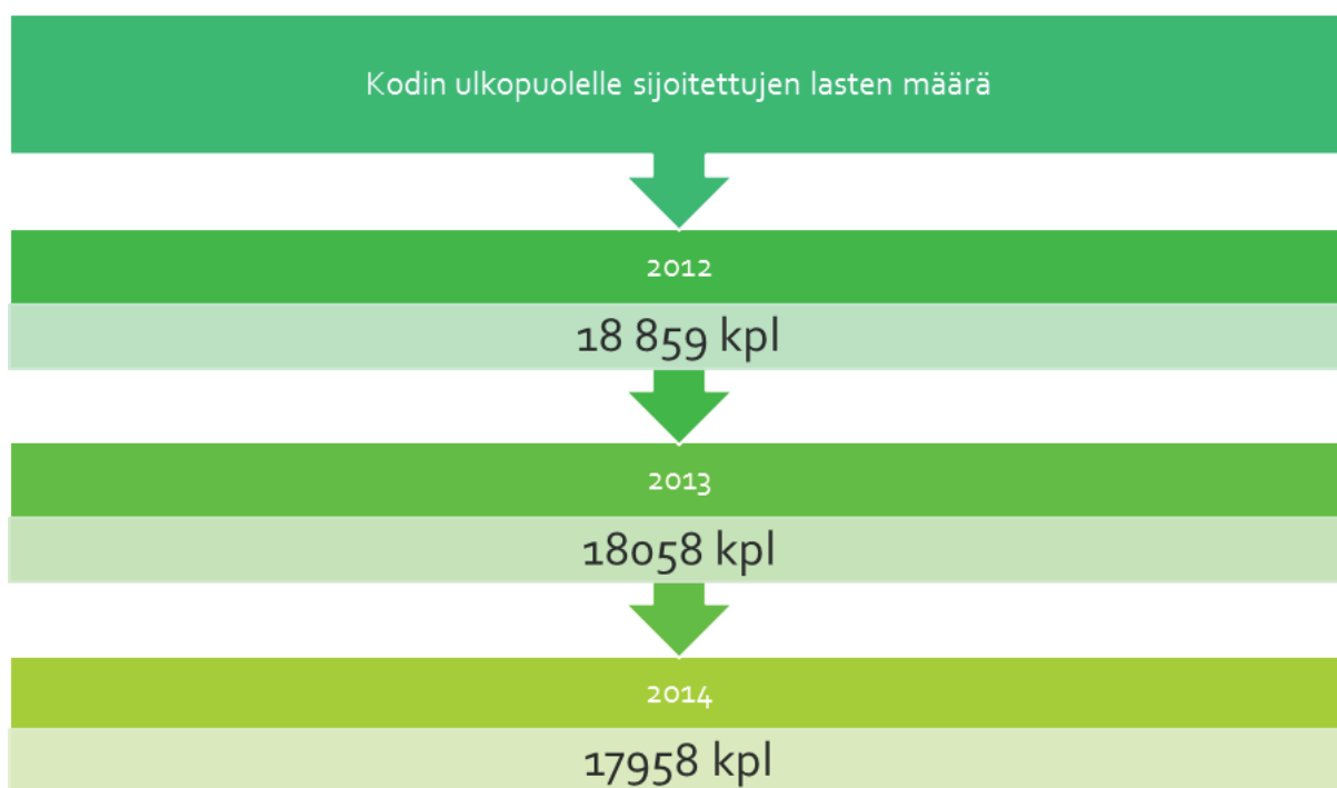
Kuva 1: Sijoituksen tilastot (THL 2015)

0-17 –vuotiaiden lasten sijoitusten lukumäärä pysyy korkeana vuodesta toiseen. Viimeisimpien tilastotietojen mukaan kodin ulkopuolelle sijoitettuja lapsia ja nuoria vuonna 2012 oli koko maassa 18 859 kpl, vuonna 2013 18058 kpl ja vuonna 2014 17958 kpl. (Taulukko 1.) Kiireellisten sijoitusten osuus näistä oli reilu 12000 kpl jokaisena vuotena. Eniten kodin ulkopuolelle sijoitettuja lapsia vuonna 2012 - 2014 oli Suomen isoissa kaupungeissa kuten Helsingissä, Vantaalla ja Tampereella. Koko maassa perhehoito ja laitoshuolto olivat yleisimmät sijoituspaikat lapsille ja nuorille. (THL 2015)