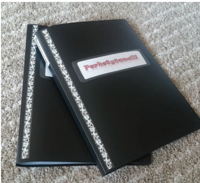
Kuva 3: Perhetyönmalli-kansio

Perhetyönmalli on selkeä ja konkreettinen ohjeistus perhetyötä tekevälle työntekijälle. Kansista (Kuva 1.) on helppo etsiä tutustumisvaiheeseen, työskentelyvaiheeseen sekä lopetusvaiheeseen sopiva menetelmä tai kopioitava lomake. Perhetyönmalli löytyy kokonaisuudessaan liitteenä työn lopusta. Perhetyönmalli-kansio on myös ohuempi kuin muut hyllyssä olevat, joten sen huomaa helposti nopeallakin silmäyksellä. Kansion tavoitteena on yhtenäistää työntekijöiden toimintatapaa ja perehdyttää uusia työntekijöitä, sijaisia sekä harjoittelijoita perhetyön erilaisiin menetelmiin. Perhetyönmalli-kansio myös avaa edellämainittuja eri vaiheita lähdekirjallisuuden avulla.