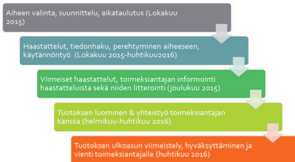
Kuva 2: Opinnäytetyön aikataulu

Lopullisen kehittämistyön eli perhetyömallin palautuksen jälkeen en ehtinyt saamaan kunnollista ja lopullista palautetta ennen opinnäytetyön palautuspäivää. Toimeksiantajani kuitenkin kommentoi tuotostani hyväksi, eikä haitannut ettei malli ollut täydellinen ja siitä puuttui viimeinen toivottu lisäys, takaisin kotiin muuttamisesta. Odotan saavani toimeksiantajaltani kattavan palautteen myöhemmin.