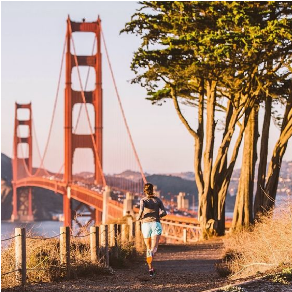
Figur 5. Bild 3 med bildtexten: "Finish what you started. #justdoit. Tomorrow, the hills have no chance. 25,000 women take to the streets of San Francisco for more than just jewelry. #werunsf." (Nike 2016)

Bilden porträtterar en kvinna som joggar längs med en grusväg invid en kanal. Att det är en kvinna härleds jag till utifrån kroppsform och frisyr. Att hon joggar sluter jag mig till tack vare träningskläderna hon bär och kroppsställningen som indikerar aktivitet och rörelse. I bilden syns torrt gräs och stora träd vid sidan om stigen och kvinnan springer i riktning mot en roströd, vältrafikerad hängbro. Landskapet är bergigt och vidsträckt och det formas av kullar. I bakgrunden kan också någon slags bebyggelse urskiljas. Fordonens storlek i förhållande till bron berättar att bron är väldigt stor och kvinnans storlek i