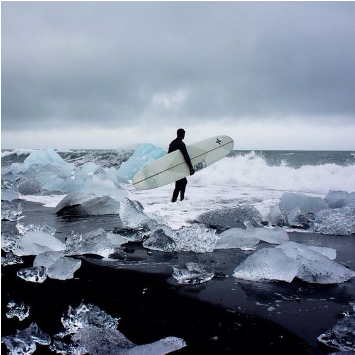
Figur 4. Bild 2 med bildtexten: "It's not always sunshine and sand. #justdoit" (Nike 2016)

Bilden avbildar en person iklädd vådräkt som står med en surfbräda under armen på väg ut mot ett brusande hav. Runt personen ligger isflak och himlen är grå och molnig. Av kroppsbyggnaden att döma är personen ifråga en man. Också den kulturella uppfattningen att surfing är vanligare bland av män, inverkar på tolkningen att personen är av manligt kön. Bilden är tagen då mannen tar ett steg ut mot havet och kan således ses som ett fruset ögonblick av en pågående handling. Kroppsställningen, surfbrädet och vågorna indikerar att mannen är på väg ut för att surfa. Jag sluter mig till att det är kallt, eftersom mannen bär vådräkt och är omringad av is. Den huvudsakliga färgen i bilden är blå – en färg som