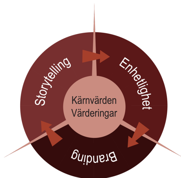
Figur 8. En illustration av förhållandet mellan storytelling, enhetlighet och branding

undermedvetet behov, arketytiska drag och emotionella kopplingar, vilket gör att det föds en berättelse. Eftersom alla dessa narrativa drag (utveckling, arketyt och emotionell koppling) är synliga i det gemensamma budskapet av varje bild kan man konstatera att de narrativa dragen är precis vad som utgör korrelationen och vad som skapar enhetlighet. De facto, kan man påstå att storytelling är själva enhetligheten, eftersom det är den faktor som sammanväver varje enskild del till en förenad helhet, dvs. den exakta definitionen av enhetlighet som begrepp (se kapitel 2.5.2). Dessutom framhöll Walter & Gioglio (2014 s. 137) att visuell storytelling innebär att presentera delar av en övergripande helhet (se kapitel 2.5.1), vilket återigen är precis vad enhetlighet beskrivs som och vad som bevisligen sker i Nikes bildflöde. Vi kan se en omedelbar likhet mellan enhetlighet och storytelling och således förstå att och varför storytelling blir svaret på frågan om enhetlighet. Eftersom enhetlighet även medför ett visst igenkännande – som i sin tur är kännetecknande för branding, och att branding innebär att skapa och leverera ett enhetligt budskap (se kapitel 2.5.2), kan man ytterligare dra ett likhetstecken mellan branding och storytelling. Storytelling, enhetlighet och branding föder vart och ett det andra och symbiosen av varje element kan presenteras som ett kretslopp som i sin helhet byggs upp kring kärnvärden och värderingar (se figur 3).