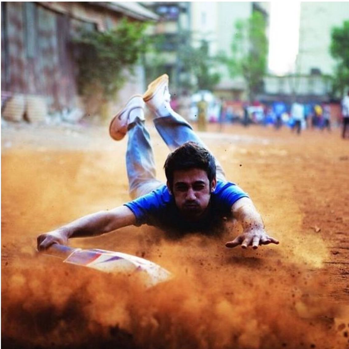
Figur 7. Bild 5 med bildtexten: "If you want to play the game everywhere, play it anywhere. #justdoit In Mumbai, not much gets in the way of cricket. If you're not letting anything stop you, tag your photos with #justdoit and you could be featured on our Instagram channel. Your move. खेलना हैं हर जगह तो खेलो कहीं भी #justdoit" (Nike 2016)