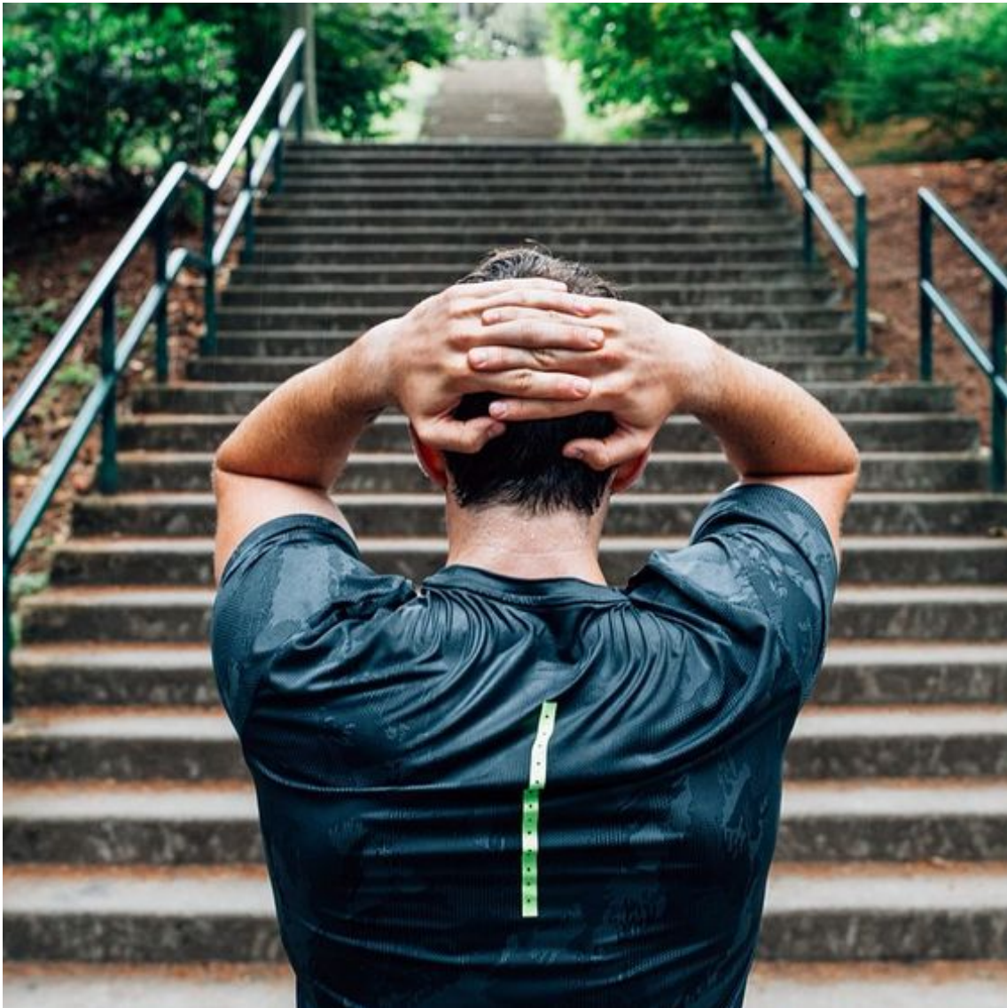
Figur 3. Bild 1 med bildtexten: “You can quit. Or you can quit complaining. Find your fast at Nike.com/Zoom” (Nike 2016)

Bilden porträtterar en ung/medelålders man iklädd träningskläder som står med händerna knäppta bakom huvudet framför en lång trappa i en park. Att personen ifråga är man och att han är ung/medelålders sluter jag mig till utifrån kroppsbyggnad, muskulatur och frisyr. Min vardagliga erfarenhet av världen gör att jag uppfattar grönska i form av buskar, gräs, små markväxter och fallna löv kring en stentrappa med räcken som indikatorer av ett grönområde i en stad, vilket gör att jag tolkar den avbildade omgivningen som en park. Mannens hår och t-skjorta är blöta. I.o.m. att han bär träningskläder avläser jag det som