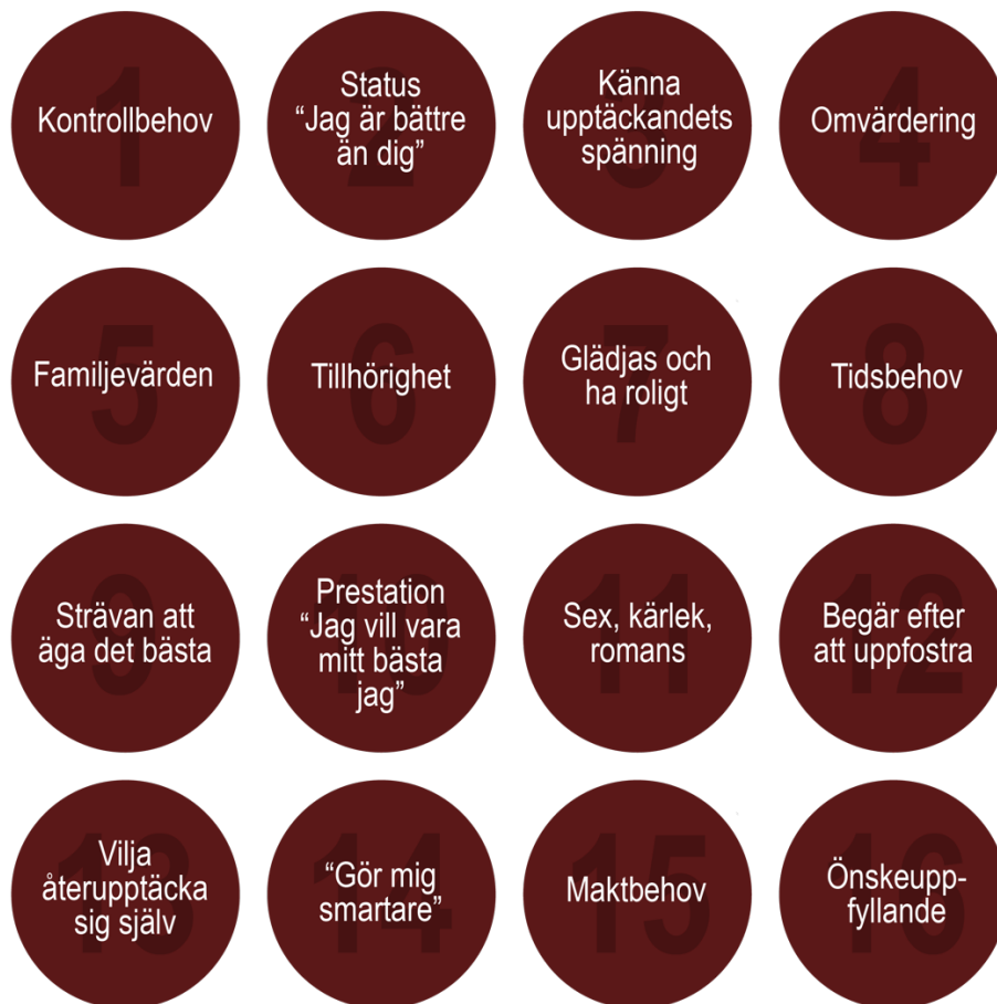
Figur 2. Presentation av de 16 emotionella behoven, s.k. "hot buttons" hos en konsument baserat på Feig & Moss teori (2015, refererad i Stribley 2015)

Stribley (2015) understryker vikten av att ett företag vet vilka känslor varumärket skall rikta sig till och att marknadsföringsbudskapen bör utlösa känslor som är i linje med varumärket. Utöver begär föreslår Baranowski (2014) också att en del av branding i själva verket handlar om att "äga" ett ord i publikens undermedvetna. Ett ord som relaterar till publikens ambitioner och som företaget förkroppsligar och gör till sitt eget på ett sätt som inget annat företag kan. Han använder Volvo och "säkerhet" och Nike och "prestation" som exempel. Känslomässig koppling som ord kan frambringa är betydelsefullt i varumärkesbyggande och storytelling är ett viktigt hjälpmedel för att kommunicera känsla. Dr. Peter Noel Murray (2013) hävdar att en förståelse för konsumenters köpbeteende måste bygga på kunskap om mänskliga känslor och det inflytande de har på vårt beslutsfattande. Vad kommer till känsla menar Stribley (2015) att text i kombination med bild ofta blir det mest kraftfulla och inflytelserika tillvägagångssättet.