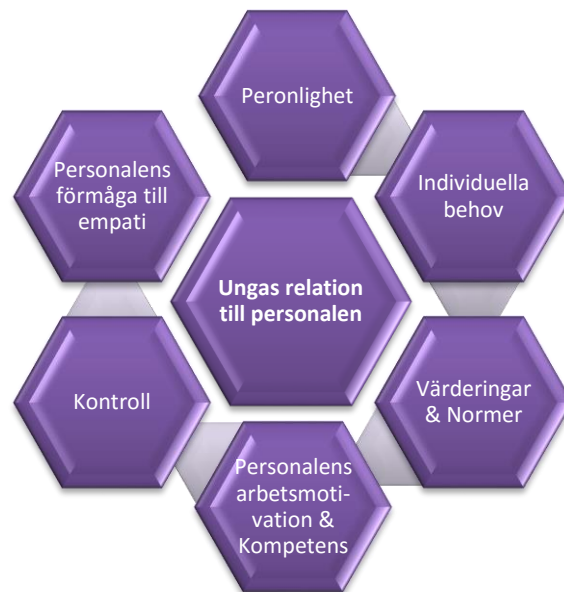
Figur 3. Faktorer som påverkar ungas upplevelser av deras relation till personalen

underkategorier; (1) goda och varma relationer mellan de unga och personalen, (2) neutrala relationer mellan de unga och personalen och (3) relationer mellan de unga och personalen som präglas av misstro.