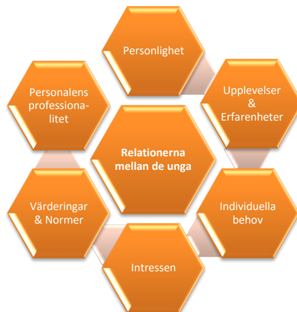
Figur 4. Faktorer som påverkar relationerna mellan de unga

Resultaten visade att de ungas relationer till varandra var beroende av deras personlighet, upplevelser och erfarenheter, individuella behov, intressen, värderingar och normer, samt personalens professionalitet. Dessa relationer har jag delat i tre olika underkategorier; (1) goda och varma relationer mellan de unga, (2) neutrala relationer mellan de unga och (3) relationer mellan de unga som präglas av misstro.