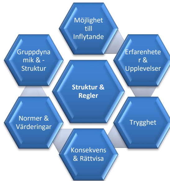
Figur 2. Faktorer som påverkar ungas upplevelser av anstaltens struktur och regler