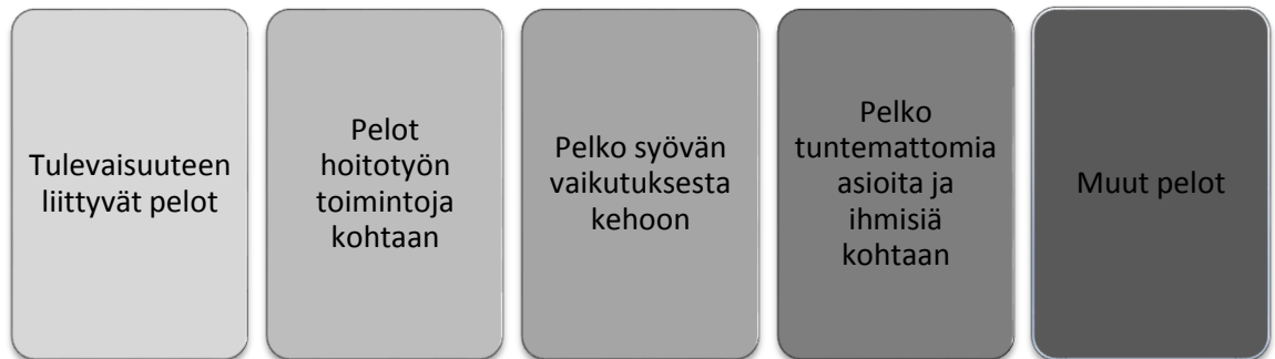
Kuvio 4. Syöpää sairastavan lapsen pelon osa-alueet