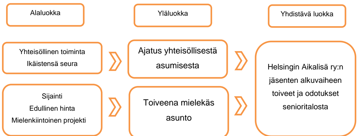
Kuvio 1. Esimerkki luokittelusta

Alkuvaiheen toiveiden ja odotusten taustalla oli ajatus yhteisöllisestä asumisesta sekä mielekkään asunnon saamisesta.