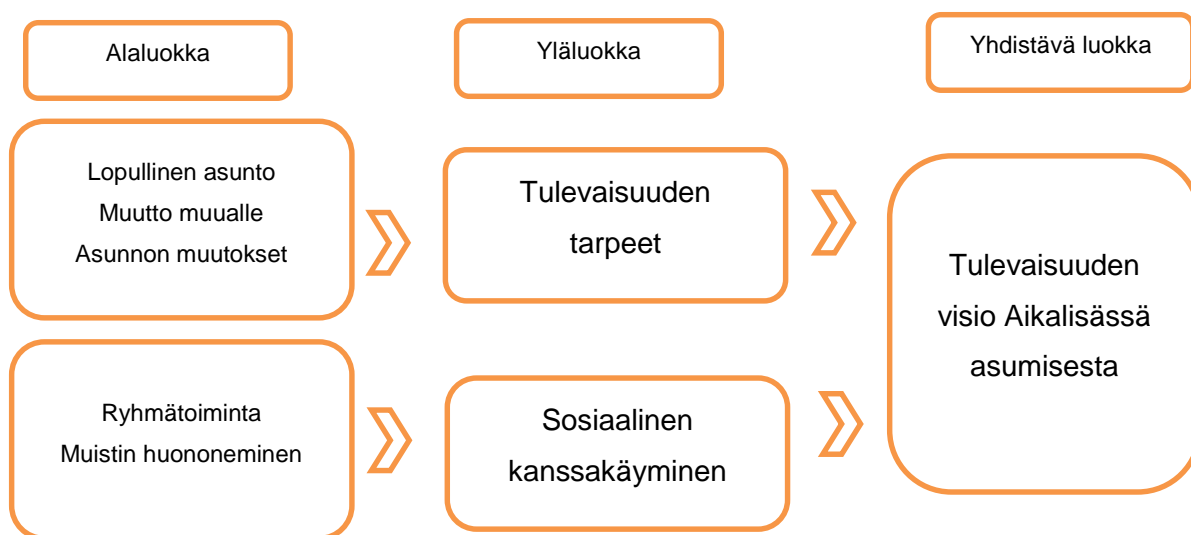
Kuvio 3. Esimerkki luokittelusta

Haastateltavilta kysyttiin heidän ajatuksiaan ja tuntemuksiaan, siitä minkälaisena he näkevät asumisjärjestelynsä noin 10–15 vuoden kuluttua. Lisäksi tiedusteltiin, ovatko he jollain tavalla valmistautuneet siihen jo rakennusvaiheessa ja vaatiiko se mahdollisesti joitain lisäjärjestelyjä tulevaisuudessa.