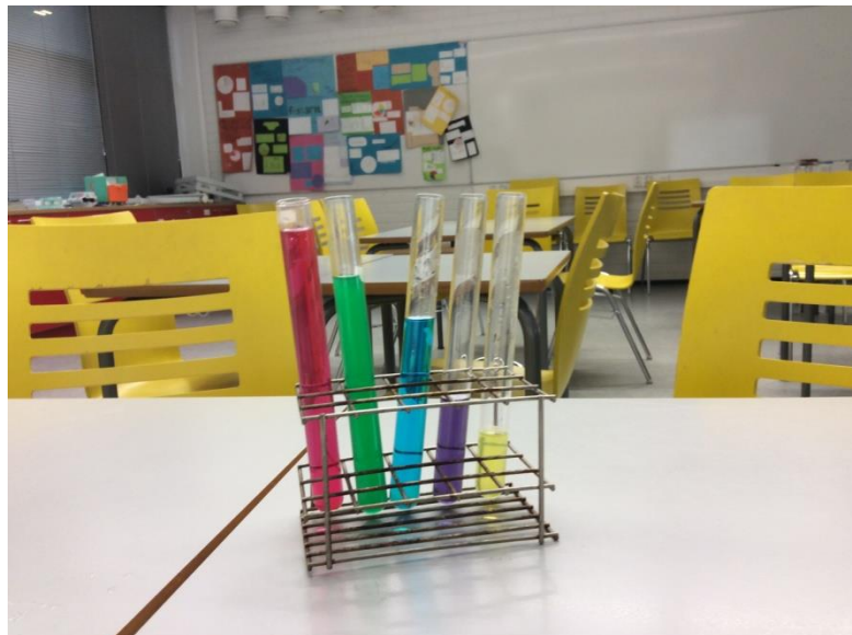
Kuvio 5. Elintarvikeväreillä sekoitetut nesteet koeputkissa.

merkata teipillä tarkasti kohdat 1/5 , 2/5 , 3/5 , 4/5 ja 5/5 . Tällöin mitasta 5/5 olisi syntynyt tilanne, jossa koko koeputki olisi ollut täynnä nestettä. Korjasin ohjetta niin, että koeputken pituudesta vähennetään yksi senttimetri ja jaetaan loppuosa eli 15 senttimetriä viiteen yhtä suureen osaan. Tällöin mittaaminenkin helpottui, koska 15:5 = 3 senttimetriä ja näin ollen saatiin jako osumaan senttimetreissä tasan.