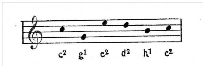
Kuvio 2. Viisi eri yläsävelsarjan nuottia

Nyt suhdelukuina esiintyvät luvut 3 ja 5 ja näiden kerrannaiset 9 ja 15. Sijoitetaan jäljelle jääneet sävelet sellaisiin oktaavialoihin, että ne ovat mahdollisimman lähekkäin.