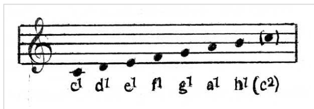
Kuvio 4. Diatoninen sävelasteikko

Keskusryhmän johtava sävel on perussävel c. Muissa ryhmissä on johtoasema niillä sävelillä, joiden suhdeluvut ovat mahdollisimman yksinkertaiset suhteessa perussäveleen. Tällaisia säveliä ovat toisen ryhmä g ja kolmannen f, joiden suhdeluvut ovat g (3/1 tai 3/2) ja f (1/3 tai 3/4). Suhdeluvut saadaan sen perusteella, verrataanko säveltä alpuoliseen vai yläpuoliseen c-säveleen. Koska taulukon ryhmiin sisältyy kaksi yhteistä säveltä (c ja g), saadaan kantasäveliä yhteensä seitsemän. Asteittain sijoitettuna samaan oktaavialaan saadaan 7-sävelinen asteikko, joka muodostaa melodisen sävelkulun perussävelistön.