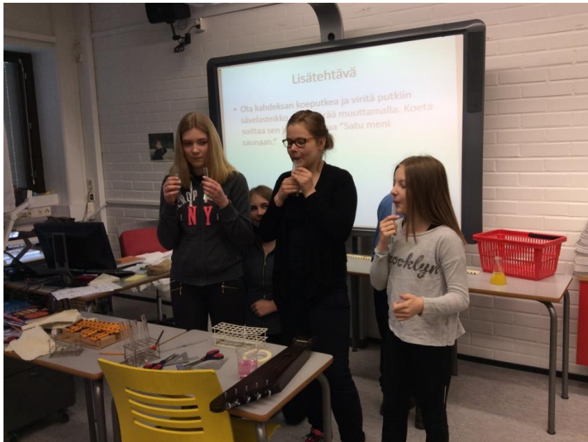
Kuvio 8. Oppilaat virittivät koeputkensa ”Satu meni saunaan sopiviksi.”

Tunnilla oli lisätehtävä nopeille ja musiikkia enemmän tunteville oppilaille. Ohjeena oli virittää viiteen koeputkeen sävelasteikko kvintin välille ja soittaa sen jälkeen laulu ”Satu meni saunaan.” Yksi tyttöryhmä suoritti tehtävän hienosti ja sain sen videoitua talteen. Ehkä viritys olisi voinut olla hieman parempi, mutta ruokailu kutsui oppilaita ja tunti oli lopussa, joten he halusivat siirtyä syömään tunnilta.