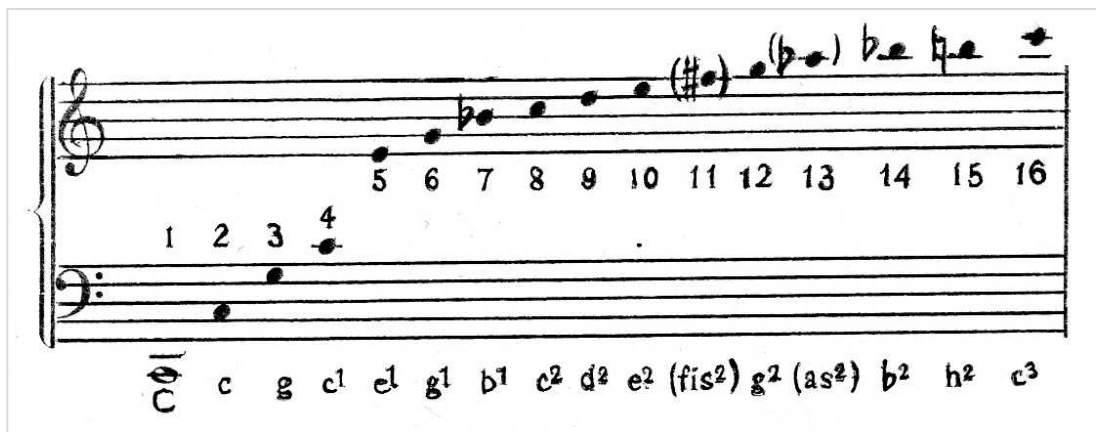
Kuvio 1. Suuren oktaavialan C-sävelen yläsävelsarja

Tutkitaan kanta- ja johtosävelen suhteita yläsävelsarjan avulla. Taajuuden matemaattiset suhteet havainnollistavat myös itse sävelten tonaalisia suhteita. Kuten edellisessä luvussa Pythagoraan soitinkokeilujen perusteella on ilmennyt, että yksinkertaisimmat lukusuhteet viittaavat konsonoiviin intervaleihin, myös yläsävelten suhtautuminen pohjasäveleen perustuu tähän johtopäätökseen. Tarkastellaan esimerkiksi suuren oktaavialan C-sävelen yläsävelsarjaa ja merkitään kunkin nuotin kohdalle sitä edustava taajuuden luku. Suhdelukujen ymmärtämiseksi riittää sarjan ulottuminen 16. yläsäveleen asti.