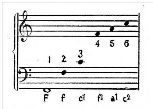
Kuvio 3. Suuren oktaavian f-sävelen yläsävelsarja

Luvuista yksikään ei sovellu kantasäveleksi pohjasävel c:lle, ja ne muuttuvat yhä monimutkaisemmiksi verrattuna edellä saatuihin lukuihin. Johtosäveliä niistä saadaan vain valikoimalla. Kuitenkin kantasävelien määrää voidaan lisätä toisen sävelen yläsävelsarjan avulla, jossa c ei esiinny pohjasävelenä. Tämän sarjan pohjasävel on f, jossa c esiintyy lähimpänä itsenäisenä yläsävelenä.