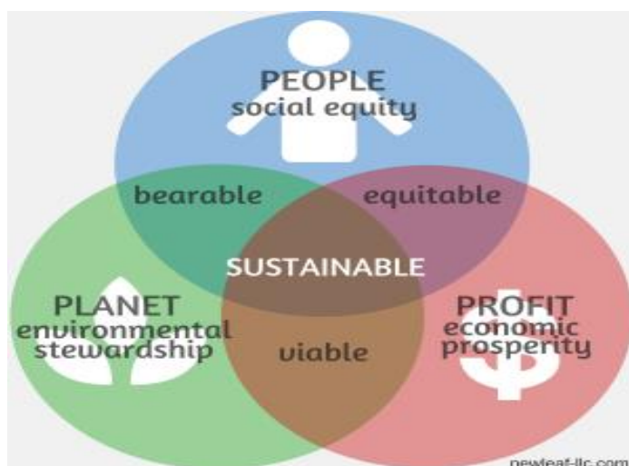
Kuva 1: Tripple Bottom Line (Triple Bottom Line 2015)

Sosiaaliseen vastuuseen on lisätty osio sidosryhmävuorovaikutuksesta. Sidosryhmät ovat yksi yhteiskuntavastuun kulmakivistä ja siksi tärkeä huomion kohde. Ehkä parhaiten sidosryhmätoiminta voidaan sijoittaa sosiaalisen vastuun aihepiireihin, mutta se vaikuttaa samalla taloudellisen- ja ympäristövuastuun aihealueissa. Siksi se on tässä opinnäytetyössä sosiaalisen vastuun mukana.