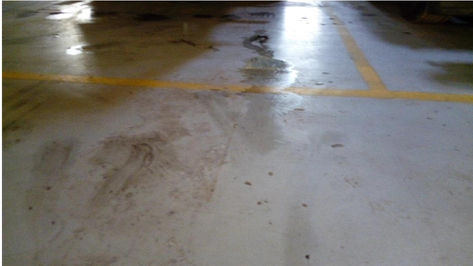
Kuvio 9. Työtila.