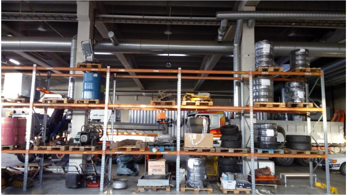
Kuvio 6. Tavarahyllykkö.

Kuviossa 6 on opinnäytetyön tekijän ottama kuva tehtaantien toisen hallin sisällä olevasta tavarahyllyköstä. Tavarahyllykkö oli kiinnitetty lattiaan pulteilla, mikä oli vähintäänkin tarpeellinen hyllyn pystyssä pysymisen edellytys. Henkilökunnan haastattelussa selvisi, ettei tätä hyllykköä ole ollenkaan tarkastettu ja että sen sidonta lattiaan olisi puutteellinen. Tavarahyllyköstä puuttui suojaverkko, joka estää tavarantoiminnan hyllyn toiselle puolelle. Verkko on hyvinkin oleellinen silloin, kun hyllykköön tuodaan tavaraa trukilla. Tällöin irtoesineet saattavat pudota hyllyn väärälle puolelle ja myös mahdollista, että trukinkuljettaja työntää tavarantoiminnan hyllyn lävitse, kun verkkoa ei ole. Hyllykössä oli myös huonosti ja kokonaan sitomattomia esineitä, mikä oli mielestäni suurin ja vakavin riski tässä hyllykössä.