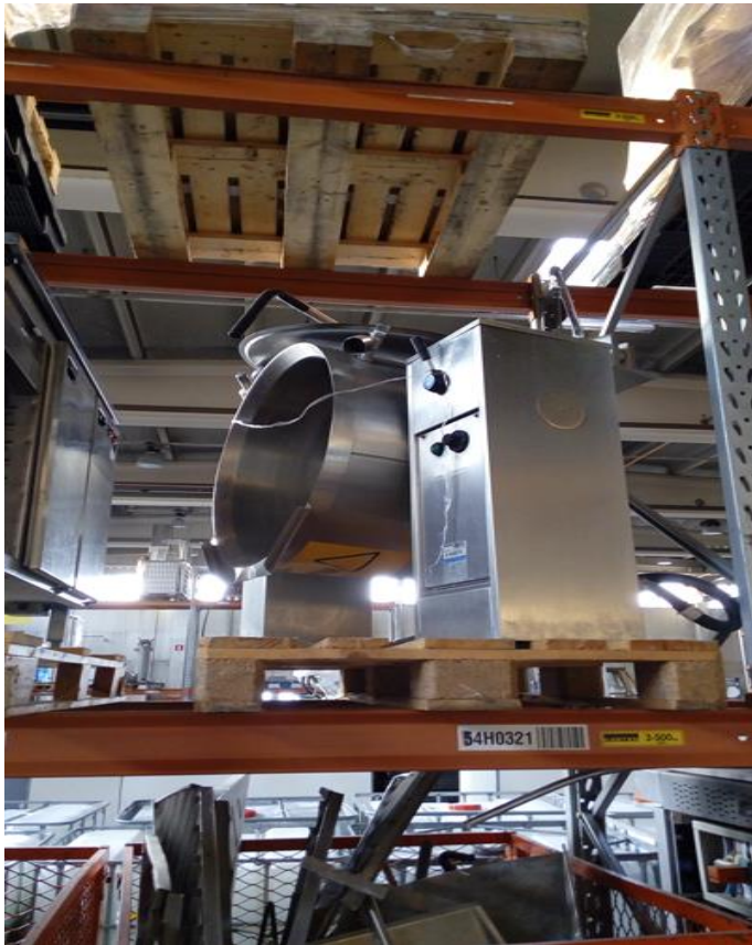
Kuvio 7. Hyllytavara.

Kuviossa 7 on kuvattu painava ja sitomaton tavara hyllykössä. Riski tavaran putoamisesta on suuri vasta, kun tavaraa aletaan siirtämään hyllyköstä pois.