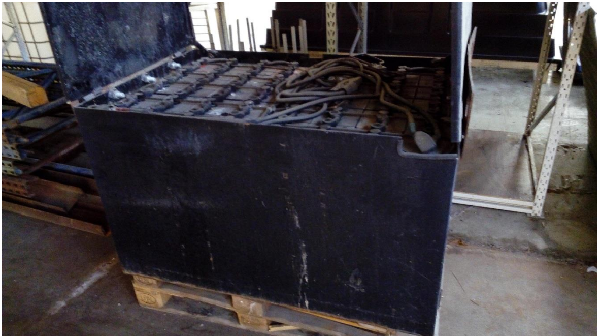
Kuvio 10. Sähkötrukin akku.

Tehtaantien tiloissa havaittiin isokokoinen (noin 2 m 2 ) musta pakkaus, kuvioon 10 havainnollistettu. Tarkemman tutkimisen ja henkilökunnan selvittelyiden jälkeen tämä osoittautui sähkökäyttöisen trukin vanhaksi akuksi. Näin suuri määrä lyijyakkuja avonaisessa astiassa voidaan luokitella jonkin asteiseksi pommiksi. Lyijyaku on todella räjähdysherkkä ja vanhetessaan siitä purkaantuu vaarallisia ja palamisherkkiä kaasuja. Tämä kyseinen akkupatteristo sijaitsi keskellä suurta työhallia, jossa opiskelijat ja opettajat työskentelevät päivittäin.