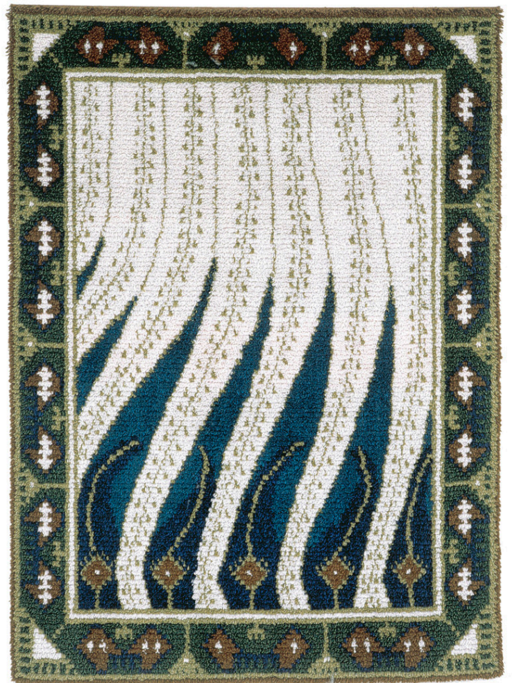
Kuva 4: Liekki , Akseli Gallen-Kallela SKYOy (2013)