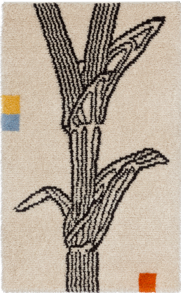
Kuva 3: Sananjalka , Osmo Rauhala SKYOy (2013)