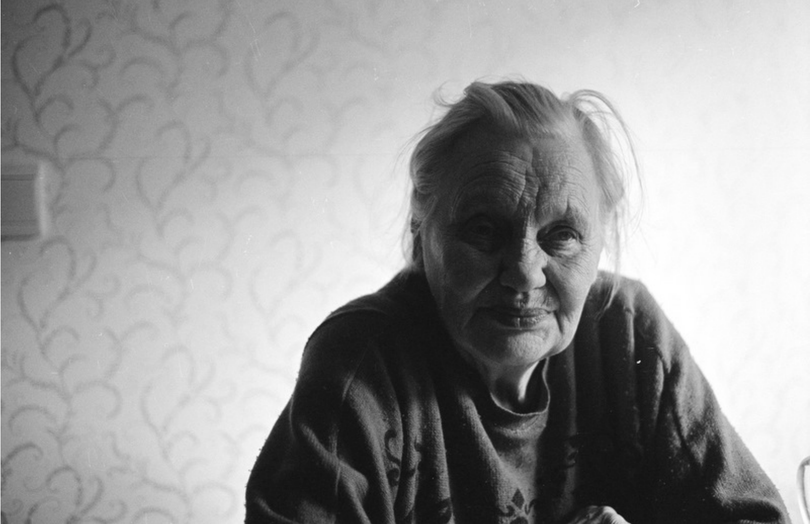
Valokuva, jota käytin pohjana teokselle.