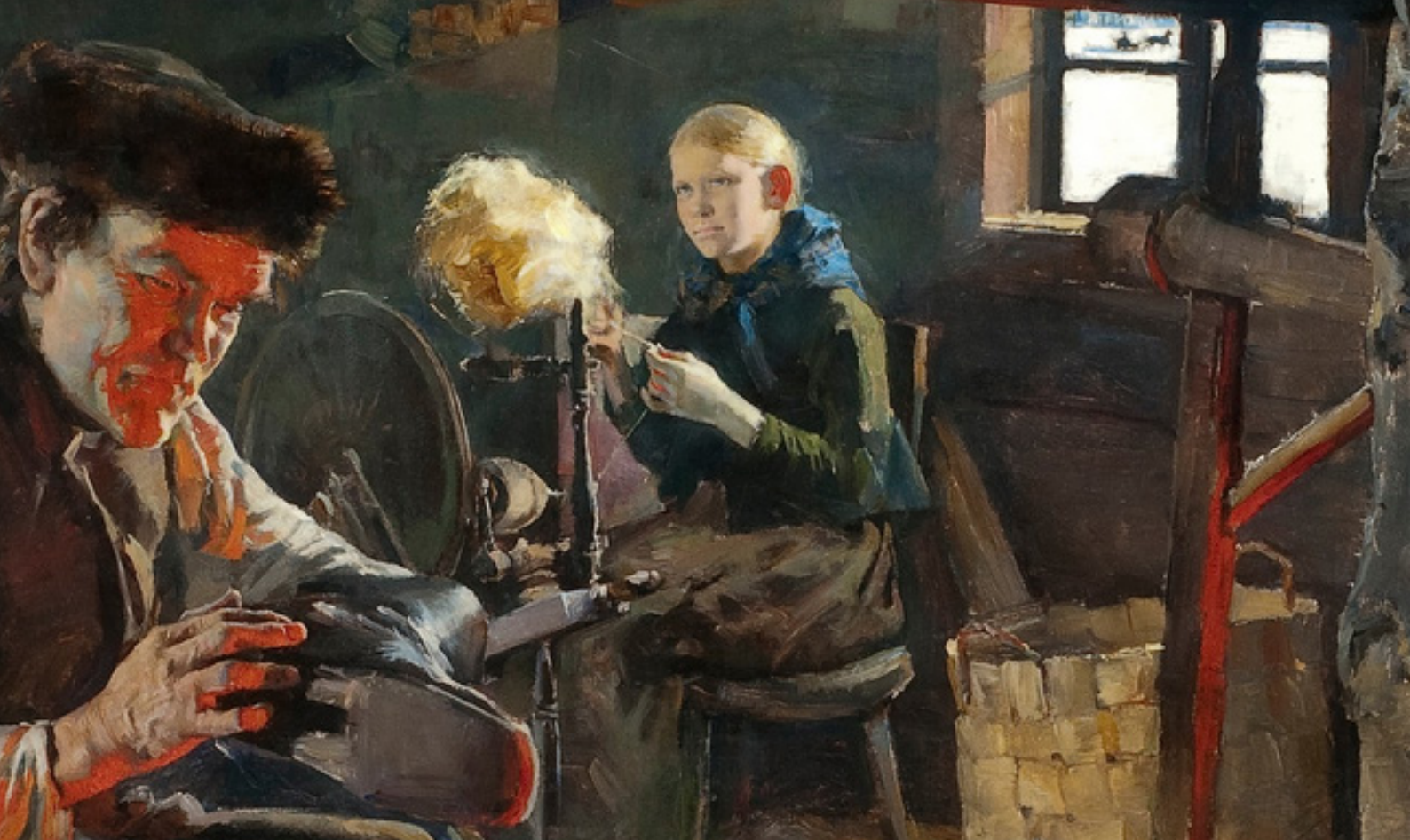
Kuva 1: Talonpoikaiselämää (yksityiskohta), Akseli Gallen-Kallela (1887)

ja taidot ovat siirtyneet yhteisen arkisen työn kautta sukupolvilta seuraaville. Tekeminen on ollut usein myös yhteisöllistä: perheen, suvun, tuttaviensa ja palvelusväen naiset ovat voineet kerääntyä samaan tupaan työläitä työvaiheita varten. Erityisesti Suomessa arkeen liittyvät käsityöt on toteutettu yleensä keittiössä, missä talon nainen tai naiset ovat hoitaneet muutkin työt, kuten talon lämmityksen, ruoan valmistamisen, lasten vahtimisen ja muut askareet. Ajallisesti käsityöt on tehty pääosin talven aikana, varsinkin maaseudulla. Säiden salliessa ulkotyöt myös naiset siirtyivät miesten avuksi. Pohjoisen pitkään ja pimeään talveen ovat myös sisätiloissa tehtävät arkea hyödyttävät työt sopineet erittäin hyvin. (Ranta 2012, 159-169)