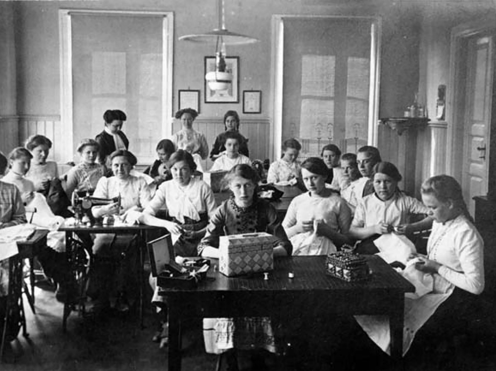
Kuva 2: Porvoon kutomakoulun naisopiskelijoita 1900-luvun alussa