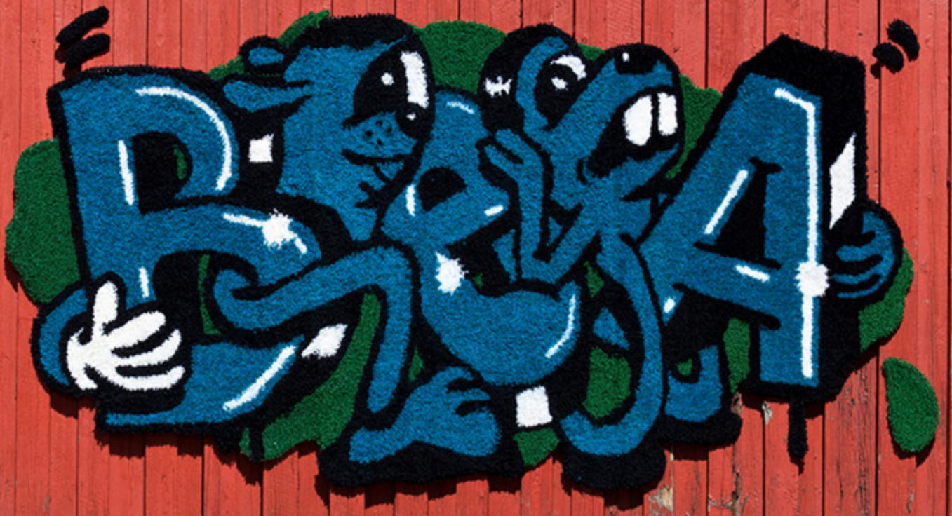
Kuva 6: BEA , Niina Mantsinen, kuva Lauri Merisaari (2012)