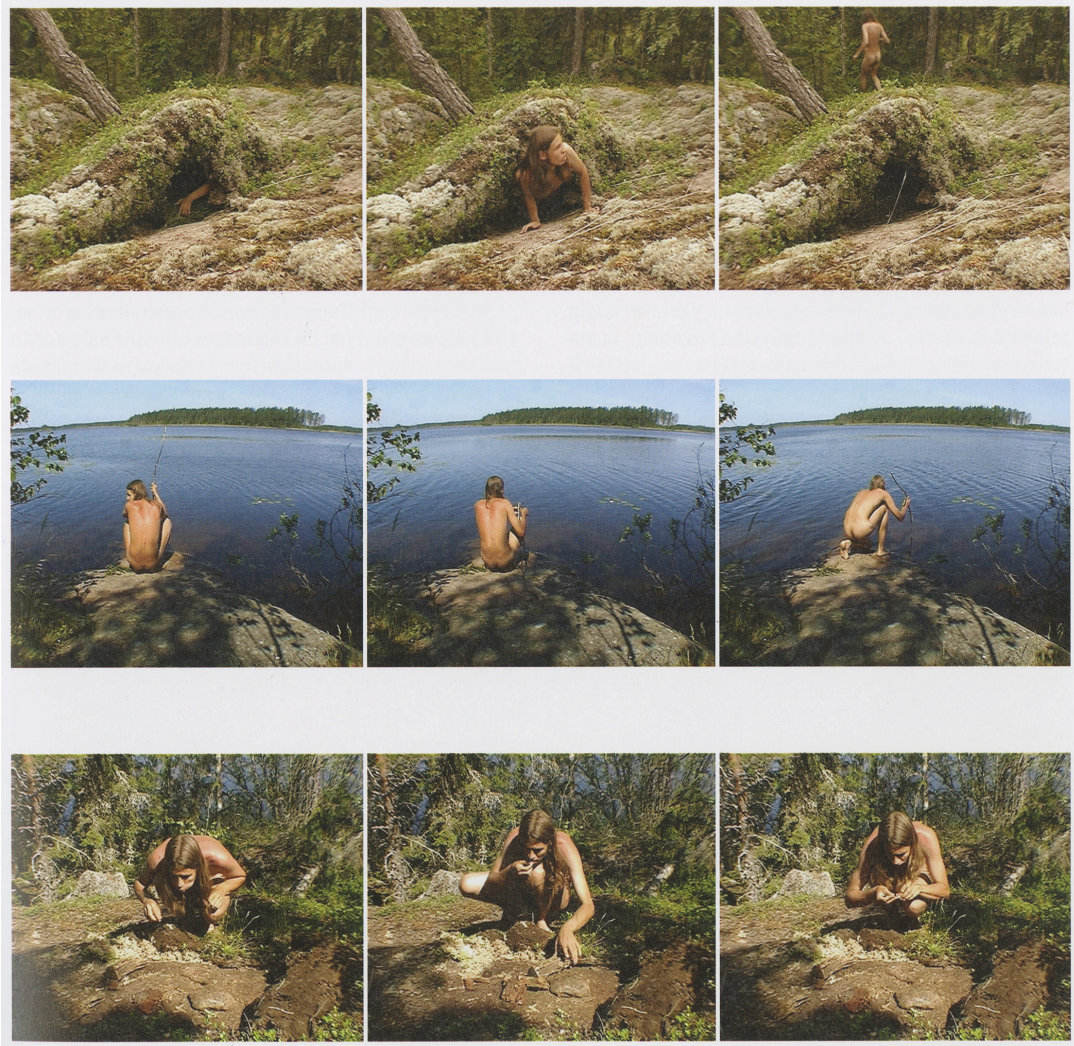
Kuva 1. Antti Laitinen, Bare Necessities, 2002

Opiskeluaikaisissa valokuvateoksissa nähdään suohon uppoava mies; videodokumentti Bare Necessities (2002) kuvaa Laitisen selviytymisyrittäjiä metsässä ilman mitään suojaa tai apuvälineitä. Bark Boat -teoksessa (2010) hän ylittää Suomenlahden Porkkalasta Viron Neitsytsaareen itse tehdyllä kaarnalaivan muotoisella lautalla. (Hirvi-ijäs 2014, 82.)