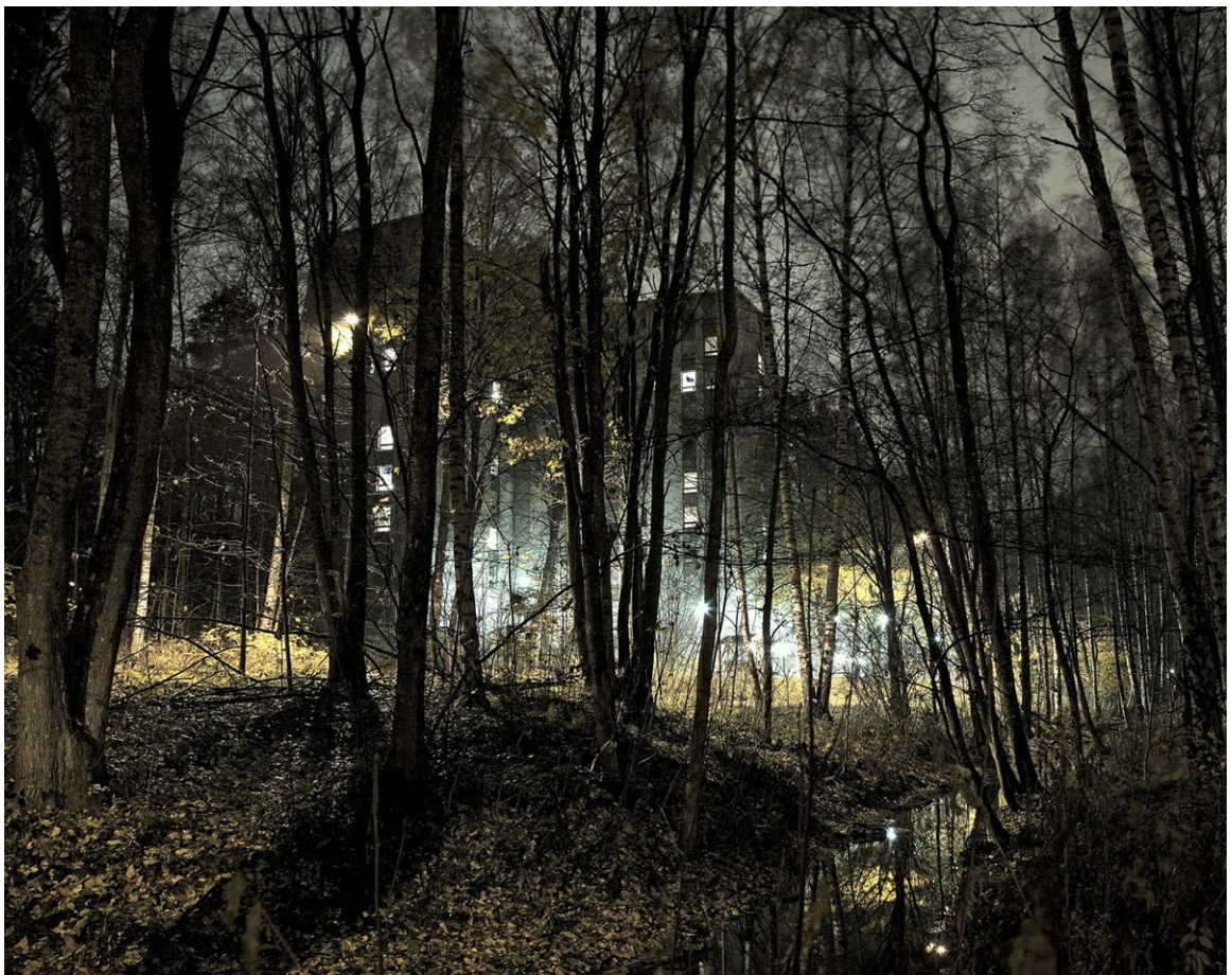
Kuva 5. Juuso Westerlund, sarjasta Roskasakki, 2014

Muotokuvat miehistä rinnastuvat valokuvasarjassa maisemallisiin kuviin suomalaisista metsistä ja lähiöistä, sekä vapaammin sommiteltuihin kuviin lapsista näissä ympäristöissä. Hätkähdyttävästi nämä maisemat säilövät arkirealismiin ylittäviä, maagisia elementtejä. Etenkin kuva (Kuva 5) puiden varjostamasta, mutta valoa tulvivasta lähiökerrostalosta viestii jostakin arjen latteuden ylittävästä tunnetilasta, jossa tylsä ja tavanomainen muuttuu kiehtovaksi. Westerlund esittää keski-ikäistyvän suomalaisen miehen syvempää tunne-elämää, joka hetkittäin täyttyy kaipuusta takaisin lapsuuteen ja aikaan jolloin oma ankea arkinen elinaluekin kimmeltää sadunomaista valoa.