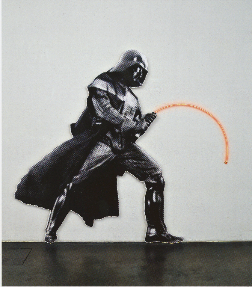
Kuva 2. Anssi Kasitonni, Kylän suurin kypärä ja letku letkeä , 2009

Materiaalisen moniosaamisen lisäksi Kasitonnin teoksissa viljellään runsaasti nostalgisia viittauksia lapsuudessa tärkeässä arvossa olleeseen populaarikulttuuriin ja sen hahmoihin. Usein nämä hahmot, esineet ja kuvat on poimittu nimenomaan pikkupojan esineistöstä ja teoksen aiheina ne ovat hellän kritiikin ja huumorin kohteina, kuten Star Wars -pahis Darth Vader teoksessa Kylän suurin kypärä ja letku letkeä . (Kuva 2) Huumori, oli se mustaa tai ei – on miestaiteilijoiden usein käyttämä tehokeino ja käsittelytapa teoksissa. Huumorin viljeleminen niveltyy helposti osaksi miestekijän myyttiä, fyysisen rankan työn ja taitavan rakentelun rinnalle. Taitava vitsinkertoja ja viihdyttävä on hyvä jätkä . Hän on olemisensa puolesta osa yleisesti hyväksytyjä tapoja olla mies, siinä missä voimakas, itsenäinen uroskin. Rankan työn ja yksin puurtamisen lisäksi arvostetaan nykytaiteen kentällä nykyään nokkelaa huumoria ja tee-se-itse-miesmäistä moniosaamista. Molemmat tekotavat solahtavat perinteiseen suomalaisen miehen malliin mukisematta.