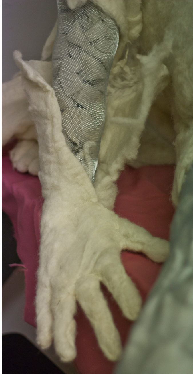
Kuva 9 Yksityiskohta veistoksesta työvaiheessa, jossa pohjarakenne ja käytetyt materiaalit ovat vielä näkyvissä.

Prosessin edetessä aloin päällystämään hahmon tukirankaa esihuovutetuilla villalevyillä. Jätin rungon avoimeksi, koska veistoksen painopiste muuttui useasti vaahtomuovilla täyttämisen myötä ja erillisiä elementtejä lisätessä. Halusin säilyttää työskentelyvapauden ja kyetä muuttamaan hahmon rakennetta tarpeen vaatiessa. Veistoksen asento muuttui prosessin aikana ja sen mittasuhteet elivät. Jos olisin tehnyt tukirangan ennen huovutetun ”ihon” lisäämistä, en olisi kyennyt enää tasapainottamaan