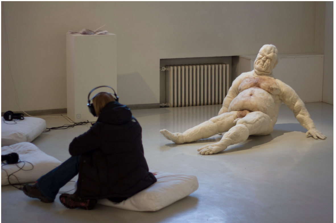
Kuva 12 Kuhnuri dokumentoituna kokonaisuudessaan näyttelyvieraan kera.

Valaistuksen osalta keskityin nostamaan mieshahmon esiin valaisemalla kahdesta eri suunnasta välttämättä turhan dramaattista heittovarjoa. Jalusta lehtisineen valaistiin huomaamattomammin ja tyynyryhmä lattialla jätettiin valaisematta. Gallerian aukioloaikoina myös luonnonvalolla oli huomattava rooli valaisuratkaisujen suhteen. Installaatiosta tuli kokonaisuudessaan vähäeleinen ja pelkistetty, koska halusin antaa tilaa etenkin kuulokkeiden äänille ja tuoda katsojan huomion teoksen keskipisteessä istuvaan miehen representaatioon, lihaksi tulleeseen mieskuvaan. Suunnitteluvaiheessa pyöritellyt installaatiovaihtoehdot katosta liehuvista lakanoista aina lattialle levitettyihin bokserikasoihin olivat väistyneet antaakseen tilaa teoksen todelliselle sisällölle, dialogille ja stereotyyppioille – keskustelulle hiljaisen miehen kanssa. (Kuva 12)