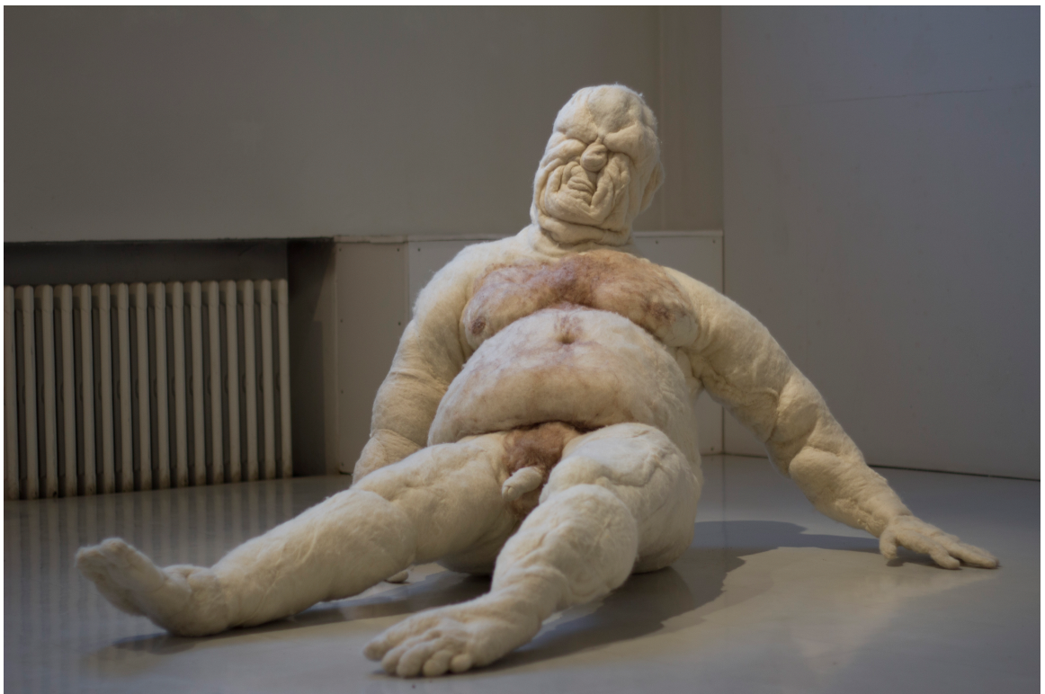
Kuva 11 Veistos installoituina Taidekeskus Mältinrannan galleriatilaan.

Asettelin äänentoistolaitteet veistosjalustan alle piiloon ja ohjelmoin ne toistamaan keskeytyksettä kukin omaa ääniraitaansa koko näyttelyn aukioloajan. Soittimia oli neljä kuten erillisiä ääniraitojakin ja jokaiselle omat kuulokkeensa. Kuulokkeet asetin kolmen valkoisen istuintyynyn päälle, jotka tulivat puolikaarella veistoksen eteen reilun puolen metrin päähän. Jalusta oli asetettu tilan nurkkaan mahdollisimman huomiota herättämättömästi, mutta kuitenkin niin että sekin tuli osaksi installaatiota. Jalustan päälle asettelin muutaman pinon ääniraitojen sisällön käänöslehtisistä ja ohjeistin näyttelyhenkilökuntaa lisäämään niitä sitä mukaa kun galleriavieraat niitä mukaansa ottaisivat.