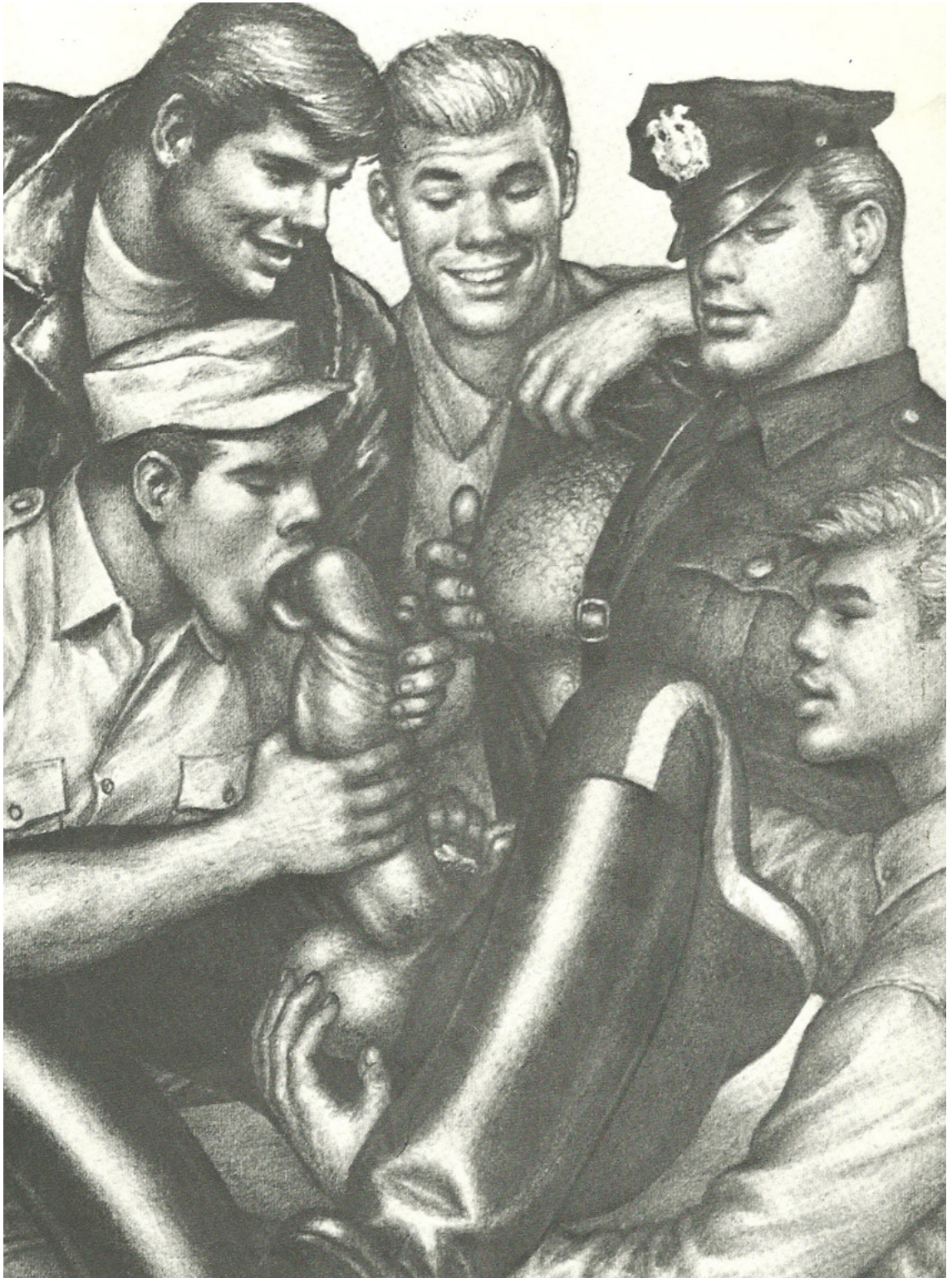
Kuva 7 Tom of Finlandin eli Touko Laaksosen eroottinen kuvitus vuodelta 1968.

Kuvataiteilija Reima Juhani Hirvonen on tehnyt hyvin toisenlaista taidetta homoseksuaalisuudestaan. Niin ikään pornografista kuvastoa käyttäen Hirvonen piirtää haurasta, traumojen sävyttämää kuvaa seksuaalisuudesta ja miehestä sen keskellä. Hänen taitessaan mieskeho ei ole seksiä tihkuva erotiikan alttari, vaan pikemminkin