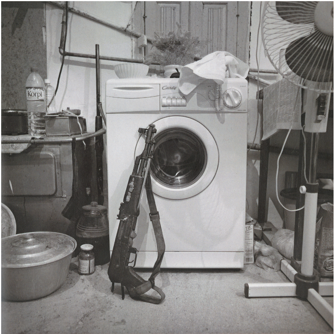
Kuva 6. Harri Pälviranta, Guns at Home # 7, 2007

Miehen läsnäoloa tai kulttuurista maskuliinisuutta voi dokumentaarisissa valokuvissa esittää näyttämättä itse ihmistä. Harri Pälvirannan mustavalkoisessa valokuvasarjassa Guns at home (2004–2007) aiheena ovat albanialaisissa kodeissa säilytetyt aseet. Kuvissa metsästyskiväärit ja kalashnikovit poseeraavat tyynesti ihmisten asunnoissa, makuu- ja olohuoneissa, keittiöissä ja eteisenurkissa. Aseita ei korosteta kuva-aiheena ilmiselvästi, vaan ne sulautuvat arkiseen ympäristöönsä luonnollisena elementtinä kuten valokuvassa pyykkikoneeseen nojaavasta aseesta (Kuva 6). Ehkä juuri siksi aseiden tunnistaminen kuvissa hätkähdyttää. Leena-Maija Rossin mukaan kuvissa on tehokasta juuri etäännytyks . Kuvat näyttävät väkivallan mahdollistavia välineitä, eivät väkivaltaisia tekoja tai väkivallantekojen jälkiä. (Rossi 2009, 66.)