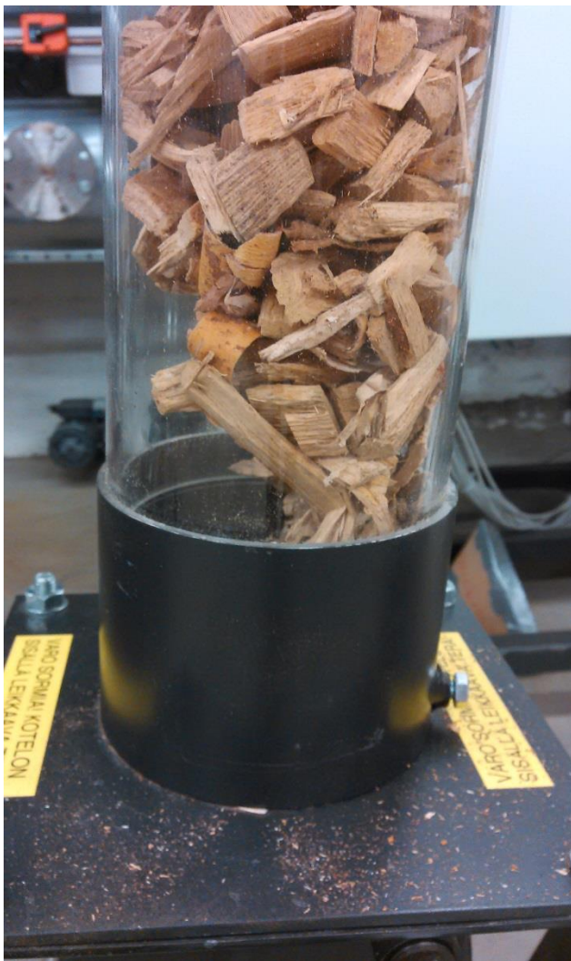
KUVIO 13. Iso palakoko holvaantuneena syöttöputkeen

Ruuvin teho säädettiin asetuksille 13 %, 9,5 % ja 6 % (Taulukko 8). Nämä asetukset osoittautuivat oikeiksi tälle näytteelle, joten niitä ei tarvinnut enempää säätää. Isoa palakokoa oli niin vähän, että siitä riitti vain yhteen polttoon molempien kosteuspitoisuuksien osalta.