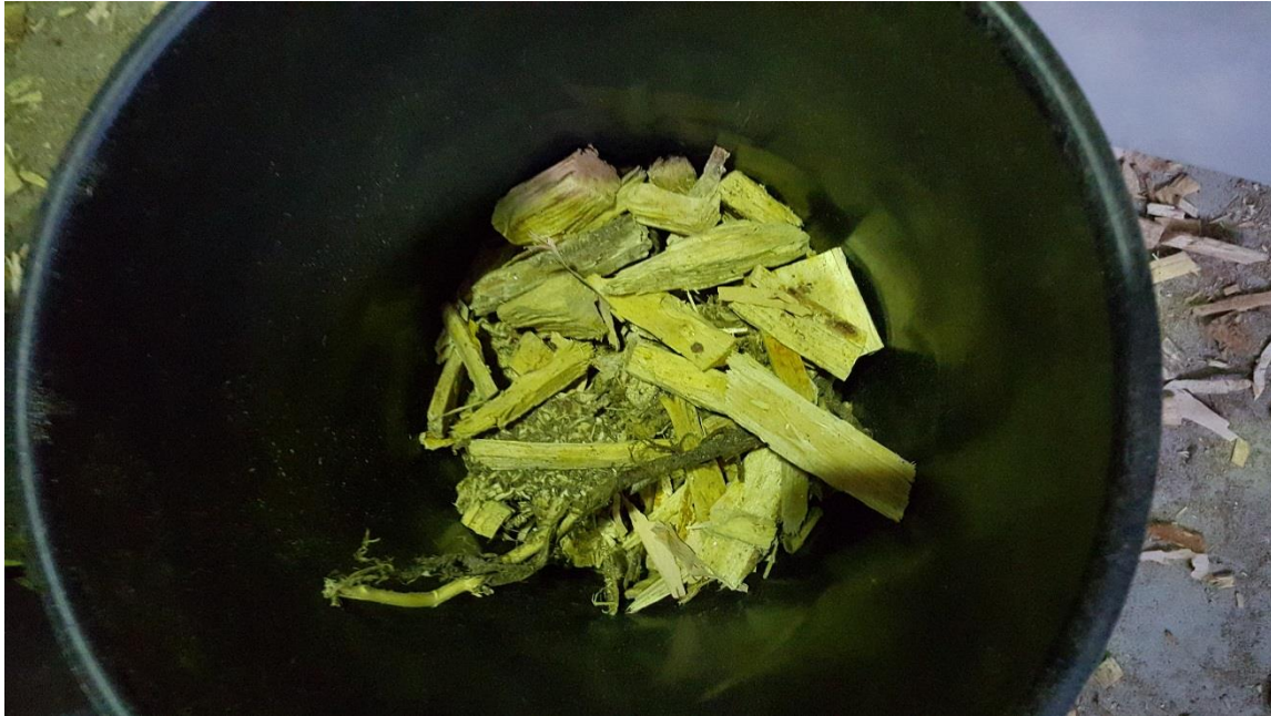
KUVIO 3. Poistetut liian suuret hakepalat ja oksat.

Opinnäytetyössä käytetään 10x17 mm:n seulan läpäisseestä palakoosta nimitystä pieni palakoko ja hakkeesta, joka ei läpäissyt seulaa, nimitystä iso palakoko. Seulonnan yhteydessä suurimmat hakepalat ja oksat poistettiin (Kuvio 3).