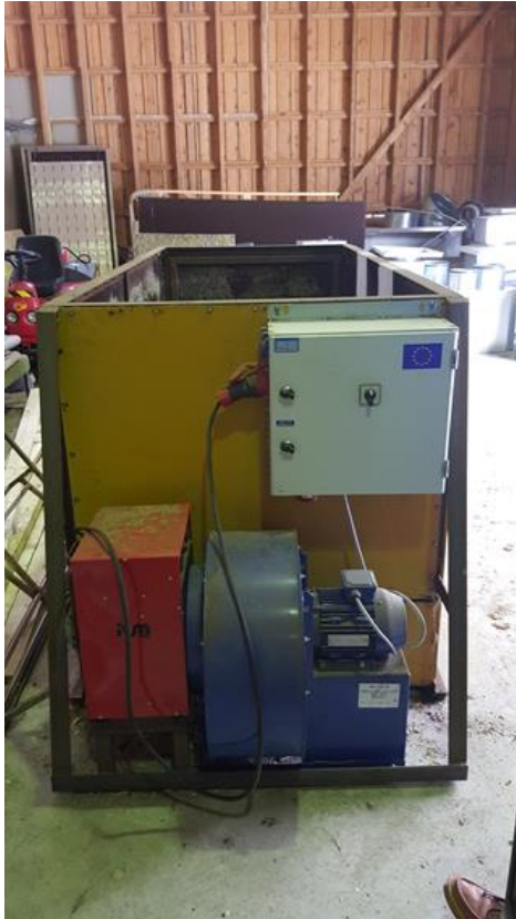
KUVIO 5. Lavakuivuri ulkopuolelta. Laitteet (vasemmalta alkaen) lämmitin, puhallin, moottori ja sähkökaappi

Hake oli tavoitteena kuivata noin 15 %:n ja 25 %:n kosteuspitoisuuteen. Ensimmäisellä kuivauskerralla 16.2.2016 lavakuivurissa kuivattiin ison ja pienen palakoon haketta yhtäaikaaisesti verkkoseinämän avulla. Pienen palakokoon haketta oli noin 40–45 cm:n paksuinen kerros. Isoa palakokoa oli kasattuna noin 10–15 cm vähemmän kuin pientä palakokoa.