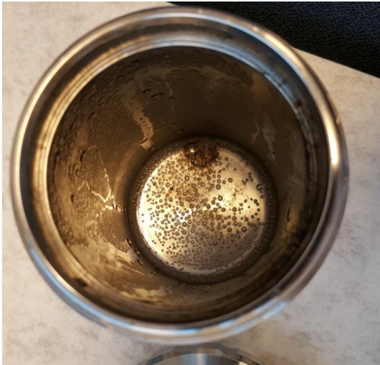
KUVIO 9. Epäpuhtaasti palanut näyte pommikalorimetrissä