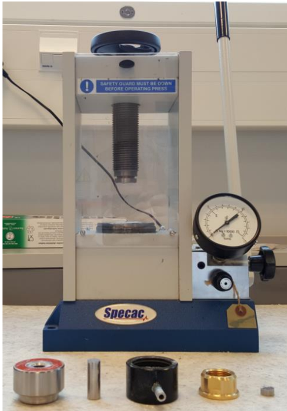
KUVIO 8. Prässi ja tabletintekovälineet