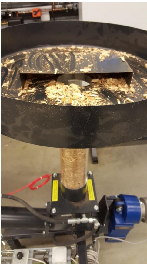
KUVIO 10. Hakkeen syöttö syöttöruuviin