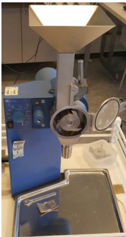
KUVIO 6. Jauhantamylly IKA WERKE MF 10 basic

Ennen pommikalorimetrin (Kuvio 7) käyttöä testattiin bentsoehapon avulla, että pommikalorimetrin kalibraatioasetukset olivat kunnossa. Näytteet testattiin pommikalorimetrissä standardin SFS-EN ISO 1716:n mukaisesti (VTT 2016, viitattu 11.4.2016). Bentsoehappo tiivistettiin tabletin muotoon FTIR-laitteistossa käytettävällä tabletintekolaitteistolla. Pommikalorimetrin kalibroinnin tarkistuksen jälkeen yritettiin tehdä tulokosteasta jauhetusta hakkeesta myös tabletteja, mutta ne olivat liian kosteita pysyäkseen kasassa. Hake jauhettiin laboratorion omalla IKA WERKE MF 10 basic –jauhantamyllyllä ja mylly puhdistettiin jokaisen jauhantakerran jälkeen ennen uuden näytteen jauhamista. Jauhantamyllyssä käytettiin 2,0 mm:n suuruista seulaa.