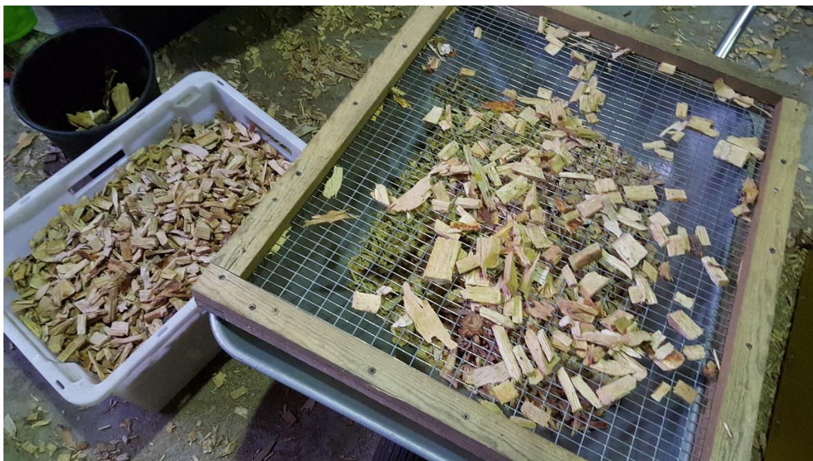
KUVIO 2. Vasemmalla laatikossa seulottua haketta ja oikealla käytetty seula

Haketta seulottiin kahteen eri palakokoon minkkiverkosta tehdyllä seulalla (Kuvio 2), jonka silmäkoko oli 10x17 mm. Seulottavat hakkeet olivat 10x17 mm:n seulan läpäisevä palakoko, ja tätä suurempi hake. Pienenpää 10x17 mm:n palakokoa tuli seulottaessa huomattavasti enemmän kuin suurempaa palakokoa. Isommalla palakoolla saatiin suoritettua vain yksi koepolttu kutakin kosteuspitoisuutta kohden hakkeen vä-häisen määrän takia.