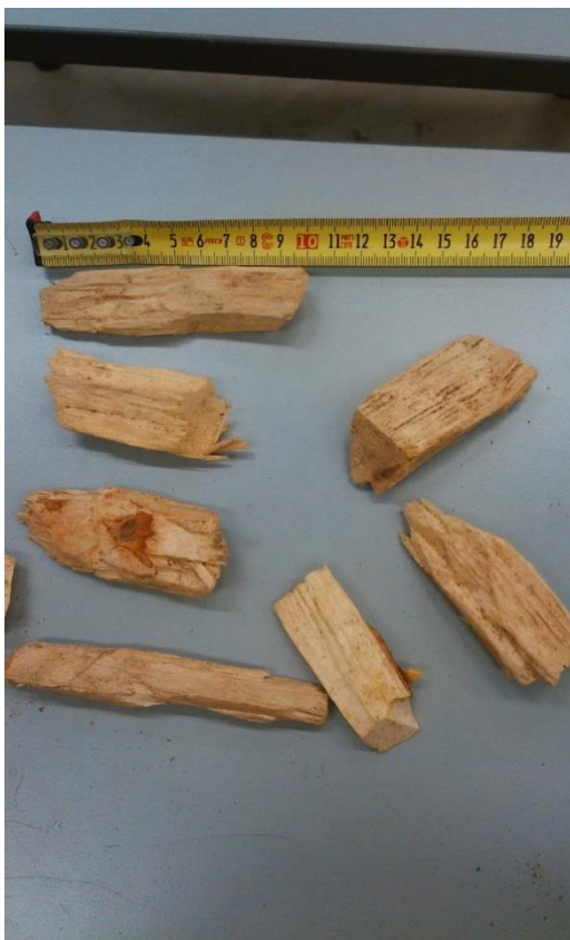
KUVIO 11. Hakkeesta ennen polttoa poistettuja liian suuria hakepaloja

Haketta tilattaessa sen palakooksi luvattiin 30x30 mm, mutta joukossa oli vielä useita yli 50 mm:n hakepaloja ja jopa muutama 100 mm:n pala, vaikka niitä oli jo seulonnan yhteydessä poistettu. Nämä suuret hakepalat poistettiin näytteestä ennen polttoa, koska ruuvi olisi saattanut mennä jumiin näistä palasista (Kuvio 11).