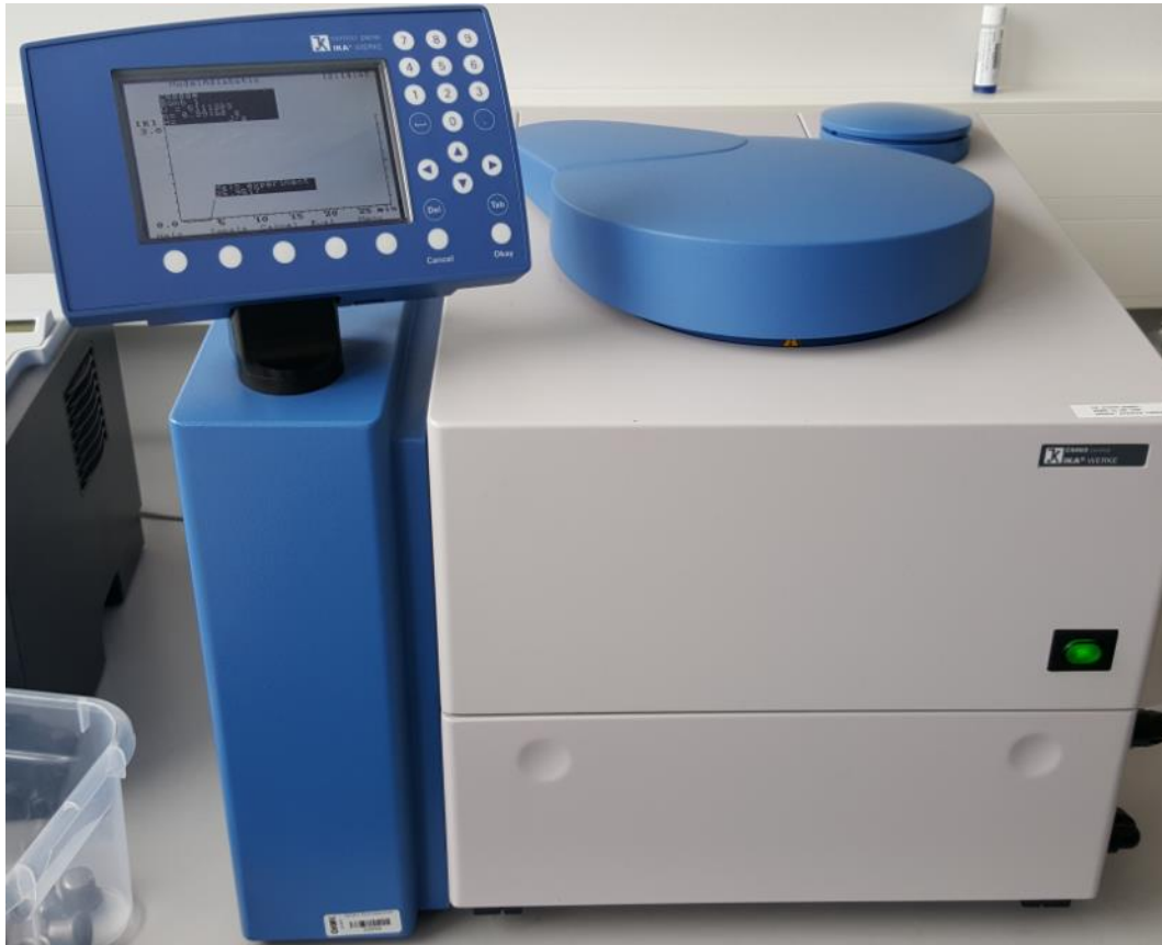
KUVIO 7. Lämpöarvomäärittämissä käytetty pommikalorimetri IKA C5003

palavasta aineksesta. Näytteitä otettiin kolme jokaisesta kosteusprosentista ja niistä otimme ylös niiden Ho- ja Hu-arvot eli ylemmän kalorimetrinen lämpöarvon ( Q_{gr} ) ja alemman tehollisen lämpöarvon ( Q_{net} ) joista laskimme näytteille keskiarvot.