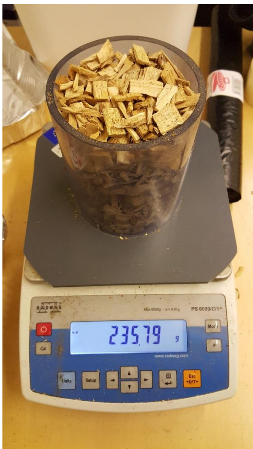
KUVIO 4. Irtotiheyden mittausta litran kokoisella astialla