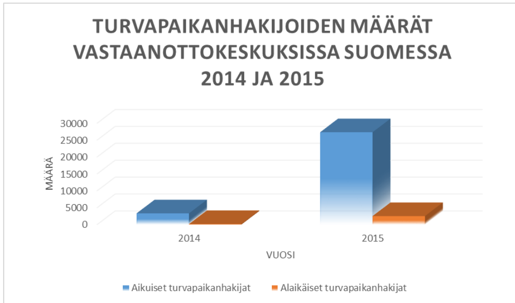
KUVIO 1. Aikuisten ja alaikäisten turvapaikanhakijoiden määrät vastaanottokeskuksissa Suomessa vuosina 2014 ja 2015 (Maahanmuuttovirasto 2016.)

yhteensä 212, kun vuotta aiemmin niitä oli vain 28. Yksiköistä 68 oli alaikäisten yksiköitä vuonna 2015, kun vuotta aiemmin vastaavien yksiköiden osuus oli 8. Asukkaiden määrä alaikäisten yksiköissä kasvoi 150 asukkaasta 2 500 asukkaaseen. (Maahanmuuttovirasto 2016c.)