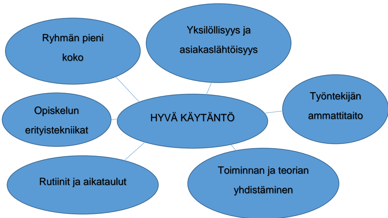
KUVIO 2. Hyvän käytännön ominaisuuksia nivelvaiheessa

Käytännön ja teorian yhdistämisellä näytti tutkimusten perusteella olevan yhteyksiä kotoutumisen edistymisessä parantuneeseen kielitaitoon, kun kieltä päästään teorian opiskelun ohella käyttämään käytännössä. Tästä huolimatta kotoutumista edistävässä toiminnassa tulee huomioida myös monia muita osa-alueita (Kuvio 3).